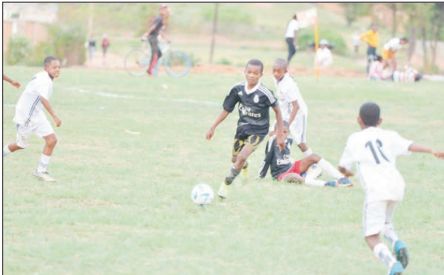
Ireo tanora Malagasy miatrika ny tetikasa.