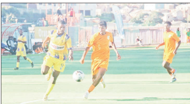
Grand Tournoi d'Antananarivo teny Ambohidratrimo.

Lalao niisa telo be izao, no nanombohana ny fifaninana baolina kitra « Grand Tournoi d'Antananarivo », karakarain'ny Liginy baolina kitra eto Analamanga, eo ambany fiahian'ny FMF « Federation Malagasy de Football » tamin'ny sabotsy 02 desambra 2023 lasa teo dia ny fihaonan'ny Cosfa sy US Pro narahany lalao-ny Elgeco Plus sy Disciples Espoir ary nofaranan'ny lalao-ny CFFA sy ny AC Toulon. Marihana fa ho fanomanana ny fifaninam-pirenena rehetra ho avy eo amin'ny