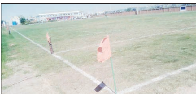
Kianja «annexe Makis Andohatapenaka».

Ankatoky ny famaranana miisa 6 be izao, no hifanesy hotontosaina amin'ny kianja Makis Andohatapenaka (kianja anatin'ny sy kianja «annexe»), amin'ny alahady 10 desambra 2023 ho avy izao dia ny «1/2 finale Coupe de Madagascar D1 Homme 2023» sy ny «1/2 finale Championnat de Madagascar D1 Dame 2023» ary ny «1/2 finale Championnat de Madagascar D2 Dame 2023», nefa dia tsy hiova ny vidim-pidirana fa ho 2000 Ar ho an'ny ankizy, 5000