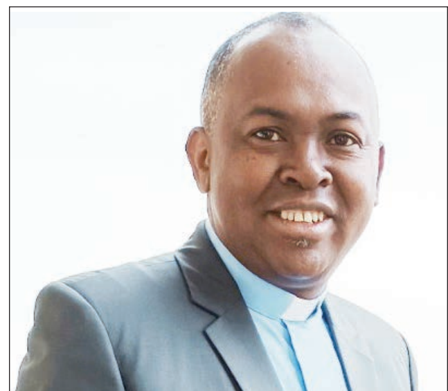
Ny Eveka vaovaoan'ny Diosezin'i Fort-Dauphin.