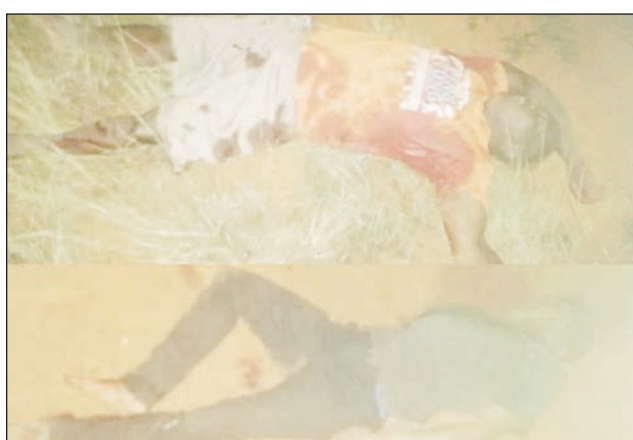
Dahalo lavo tany Ambatomanoina.