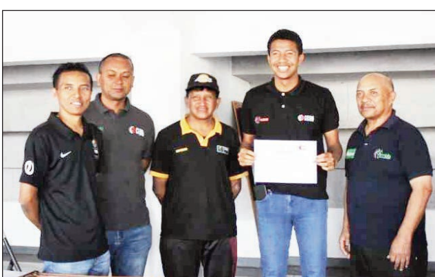
Fanolorana mari-pankasitrahana tany Vatofotsy.