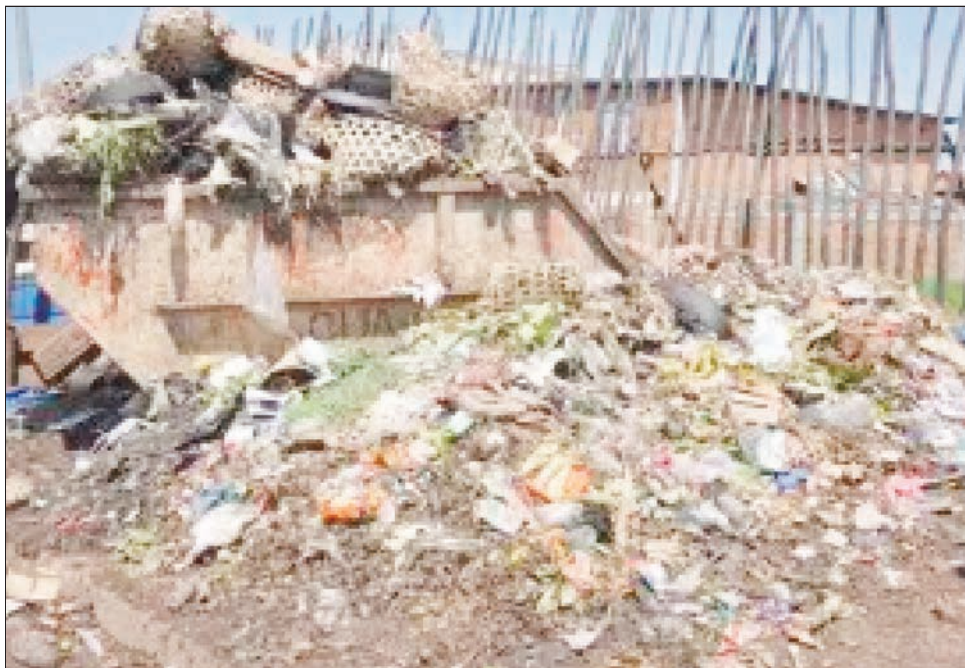
Miavosa sy mantsina ny fakon'Antananarivo.

Nandritra ny fitondran'ny ben'ny tanàna Vazaha be Naina Andriatsitohaina, nandritra izay 4 taona izay dia miaina ao anaty fako misavovona Antananarivo Renivohitra . Hafa anefa ny teny natao nandritra ny propagandy tamin'ny fotoan'androny, fa sahy nilaza ampahibemaso fa tompon'andraikitra ny ben'ny tanàna raha misy fako eto andrenivohitra . Nilaza mihintsy izy tamin'izany fa atero any amin'ny lapan'ny tanàna ny fako raha toa ka misy . Antananarivo madio sy milamina no ataontsika rehefa tonga eo amin'ny fitondrana aho hoy izy. Inona no misy ankehitriny ? fako masiso tsy laitra iainana no misy manerana ny faritra maro . Izay andehanan'ny mpitondra teo aloha mba nesorina ihany ho takon-kenatra , fa ny any amin'ny tsy hita maso dia tena mampiteny ny moana . Nisy ny mpanao politika efa nitondra fako teny amin'ny lapan'ny tanàna, fa valy boraingina sy teny mamazivazy no namparan'i Vazahabe tao amin'ny tambazotran-