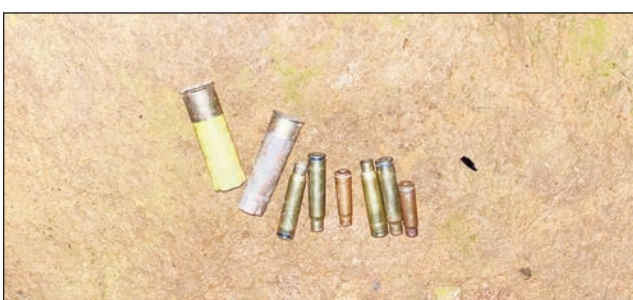
Bala amin'ny fitaovam-piadiana mahery vaika ampiasain'ny dahalo any Ankazobe.

Manao ny ataony mihitsy amin'izao fotoana ny dahalo ao amin'ny distrikan'Ankazobe faritra Analaman-ga, amin'ny fanafihana mitam-piadiana miaraka amin'ny herisetra sy fakana an-keriny. Tany Mahavelona Ankazobe izay anisan'ny faritra mena amin'ny asan-dahalo. Ampolony ny olona efa nalain'ny dahalo an-keriny. Lasibatry ny herisetra ny zaza amam-behivavy ary vola be no takalon'ny takalon'aina. Tao anatin'ny 2 volana izay, tsi misy matory an-trano intsony ny olona ao amin'ireo fokontany maromaro mandrafitra an'i Mahavelona Ankazobe noho ny asan-dahalo mahery vaika. Mandositra any antsaha ireo mponina amin'ny alina