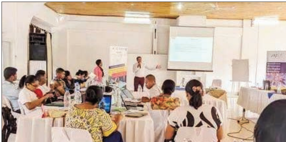
Ireo mpampiofana amin'ny Fanabeazana ho Olom-pirenena Vanona, na FOV.

Manampy antsika eto Madagasikara, amin'ny fanabeazana ho olom-pirenena vanona amin'izao fotoana ny fikambanana iraisam-pirenena miasa eto. Nivory sy niofana nandritra ity herinandro ity ireo mpampiofana amin'ity sehatry ny fanabeazam-bahoaka ho olom-pirenena ity. Tao amin'ny « Hôtel des Thermes » Antsirabe faritra Vakinankaratra, no nanatanterahana ny atrikasa mikasika ny fanomanana ny fampiofanana ireo mpampianatra hisahana ny Fanabeazana ho Olom-pirenena Vanona na FOV, eo anivon'ny sekoly ambaratonga faharoa (CEG) nanomboka ny alatsinainy lasa teo ary nifarana androany. Raha atambatra, kaominina aman-jatony ao anatin'ny faritra 5 eto Madagasikara no hisitraka ny tetikasa mandritra ny 5 taona dia ireo