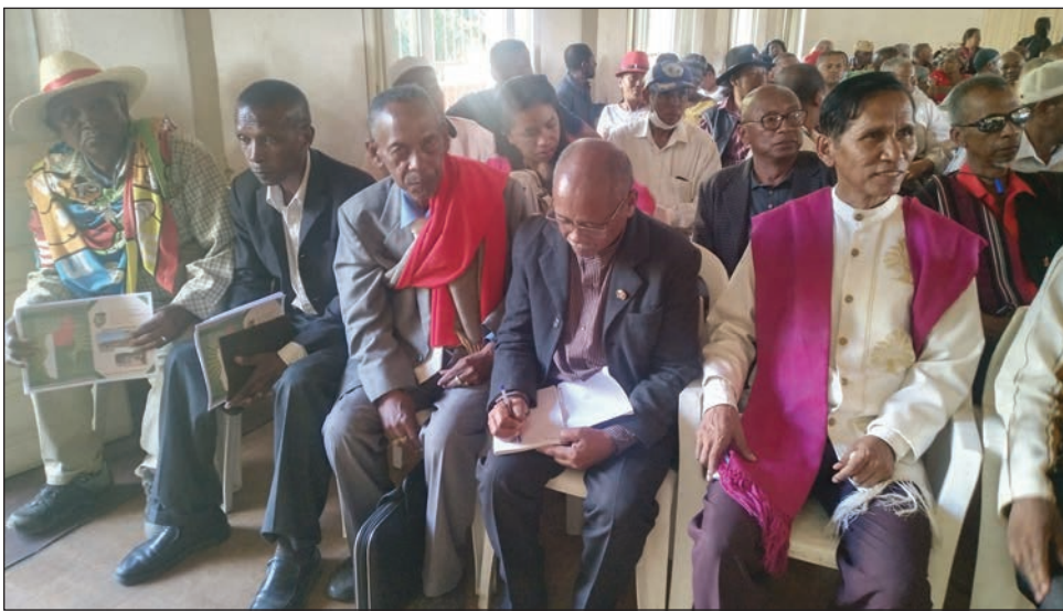
Ireo Raiamandreny ara-dRazana sy Foko Malagasy teny Ambohidratrimo.

Nikaondoha momba ny raharaham-pirenena nandritra ny roa andro, teny Mandriambo Ambohidratrimo, ny ARFM, na ny Antenimieran'ny Raiamandreny ara-dRazana sy Foko Malagasy. Anisan'ny nivoitra tamin'ny fehin-keviny, fa hanangana governemanta izy ireo, governemanta Malagasy sy tena an'ny vahoaka Malagasy. Nangatahany koa mba hody any an-tanindrazany ao anatin'ny 72 ora ireo diplomatany rehetra monina sy miasa eto amintsika, aleo ny Malagasy no hifandamina mahakasika ny raharaha tokantrany hoy ny fanambarana. Taorian'ireo asam-baomiera nahitana ny vaomieran'ny fampihavanana, politika sy raharaham-pirenena ary ara-drazana, dia nisy ny fehin-kevitra nivoaka narafratra ho tondrozotra, ka isan'ny nisongadina tamin'izany ny filazana fa "tsy manankery intsony ny Lalampian'ny Repoblika fahaefatra, ka hiroso amin'ny fananganana fanjakana vaovao Malagasy. Ho fanatantarahana izany, hisy fananganana Governemanta hitantana ny tany sy ny fanjakana". Nahitsy sy hentitra ireo namaky ny tondrozotra: "angatahana ireo diplomatany rehetra mba hody any an-tanindrazany avy ao anatin'ny 72 ora, fa handamina ny Tanindrazanay izahay, ka rehefa voalamina ny tanindrazana, ary miverina amin'ny Malagasy ireo Nosy Malagasy vao miverina". Raisin'ny ARFM ho fahavalon'ny Malagasy koa, hoy hatrany ny fanambarana, izay masoivoho vahiny manatrika ny fianianan'ny filoha Rajoelina izay ninia ho Vazaha, fianianana hatao eny Mahamasina anio.