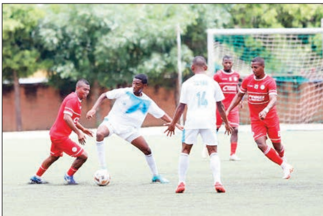
Grand Tournoi d'Antananarivo 2023.

Hiditra eo amin'ny lalao ampahefa-dalana amin'ny sabotsy 16 sy alahady 17 desambra ho avy izao, ny fifaninanana baolina kitra «Grand Tournoi d'Antananarivo 2023», karakara-rain'ny ligin'ny baolina kitra eto Analamanga, ka fantatra fa eny amin'ny kianja «Elgeco Plus Stadium By Pass» avokoa no hanatanterahana an'ireo lalao rehetra amin'izany. Marihana fa saika tafita hiatrika an'izany dingan'ny ampahefa-dalana izany avokoa ireo ekipana goavana ao amin'ny OPL,