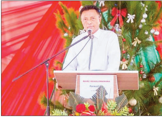
Ny filoha Marc Ravalomanana, 74 taona.

izay mihàtra amintsika rehetra izao. Aoka ho tsaroantsika tsara fa ny politika no manoritra ny momba anao androany sy ny hoavin'ny rahampitso. Raha mahantra ianao dia nohon'ny rafitra sy ny politikam-panjakana no anton'izany. Entin'ny sasany hanararotana ny Malagasy ny hoe tsy manana fotoana hanaovana politika, fa mila mitady izay ho hanina isan'andro ny Malagasy. Marina tokoa fa sarotra ny fiainana, kanefa izao zavamisy izao dia tsy hanatsara ny fiainan'ny vahoaka Malagasy mihitsy. Noho izany mitohy ny tolona," hoy izy.