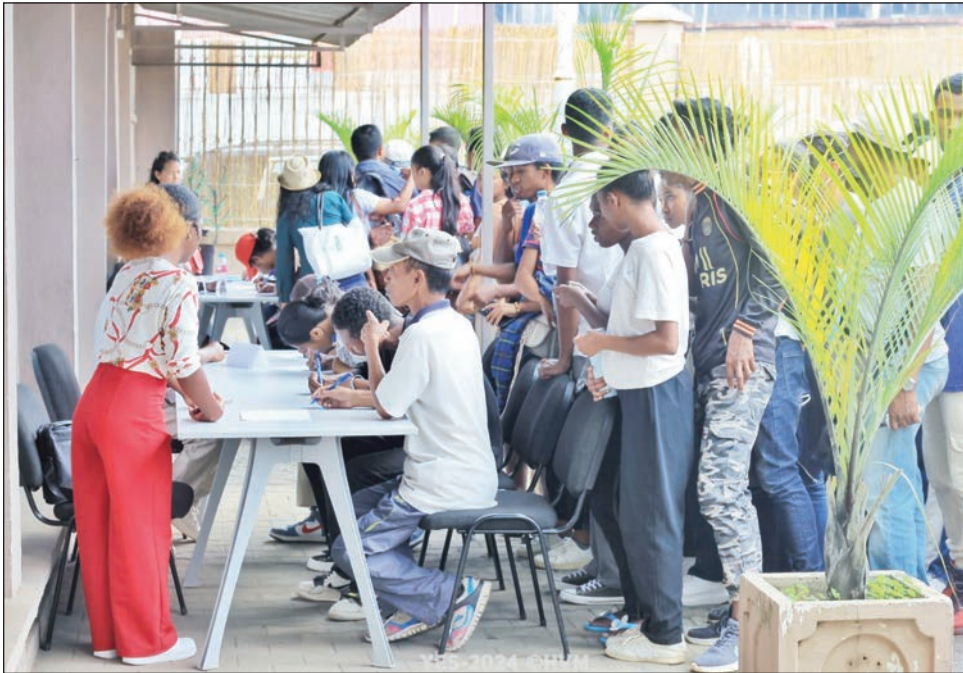
Ireo tanora nisoratra anarana teny Andraharo.

Hanome fampianarana teny anglisy ny tanora liana amin'izany ny antoko HVM : Hery Vao-vaon'i Madagasikara. Maro sahadry no tonga nisoratra anarana amin'izany fampianarana teny anglisy "YES andiany 2024" izany. Ho an'ireo izay mbola maniry hisitraka ny fampianarana dia isaky ny alarobia ny fandraisana ny fisoratana anarana eny amin'ny QG HVM ANDRAHARO. Tombony lehibe ho an'ny tanora malagasy ny fisian'ny fampianarana tahaka izao, satria manampy be amin'ny fidirana amin'ny sehatry ny asa. "Haren-tsaina, fahaizana amam-pahalalana hanampy anao tanora hanana ny maha ianao anao sy hidiranao amin'ny sehatry ny asa, izay no atolotro ho anao fa tsy sanatria sombimofo tsy mahavita taona