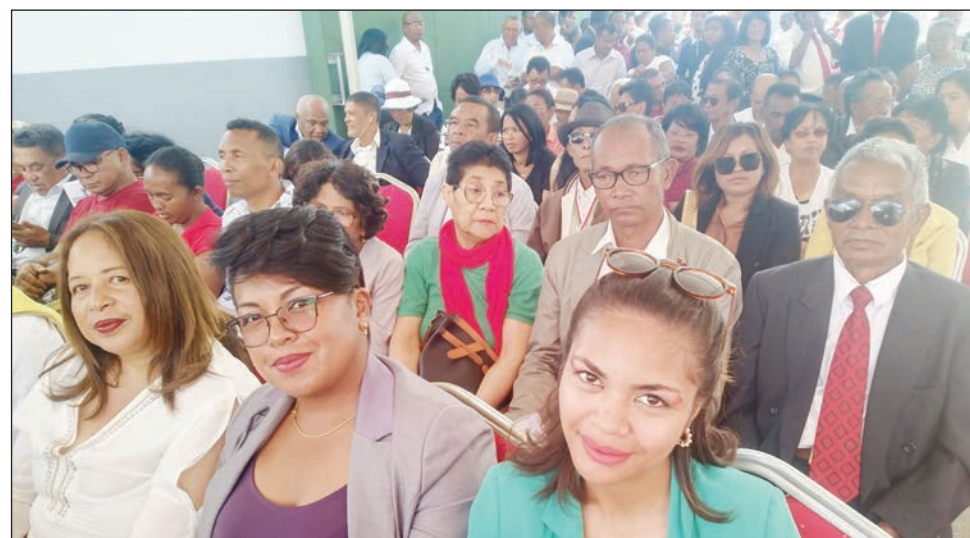
Ireo nankahery ny depiote Fetra teny amin'ny Tribonaly Anosy, tamin'ny fitsarana natrehany ny talata teo.