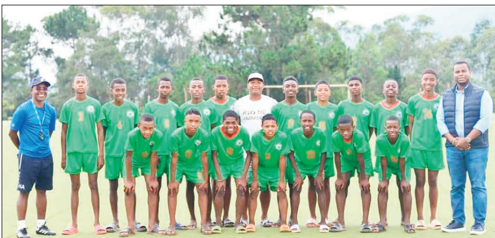
U15 Sport Scolaire zazalahy Malagasy.

Efa tonga any Harare renivohitr'i Zimbabwe, izay toerana hanatantehana ny fifaninanana baolina kitra « Championnat d'Afrique Football Scolaire 2023 - Phase zonale - COSAFA », ny mpilalao Malagasy sokajy U15 sokajy zazalahy sy zaza-vavy, izay handray anjara amin'io fifaninanana io . Fandaharan-dalaoan'ny U15 Malagasy zazavavy : 14 desambra : 12h30--Madagascar # Namibie, 15 desambra : 09h00-Angola # Madagascar, 12h00-Afrique du Sud # Madagascar, 15h00-Zambie # Madagascar. Fandaharan-dalaoan'ny U15