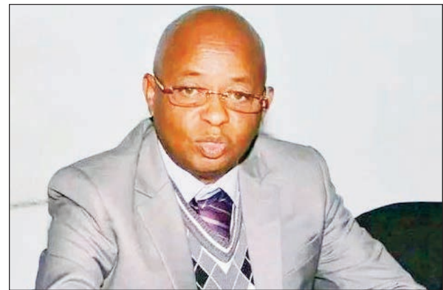
Ny Prefet an'Antananarivo.