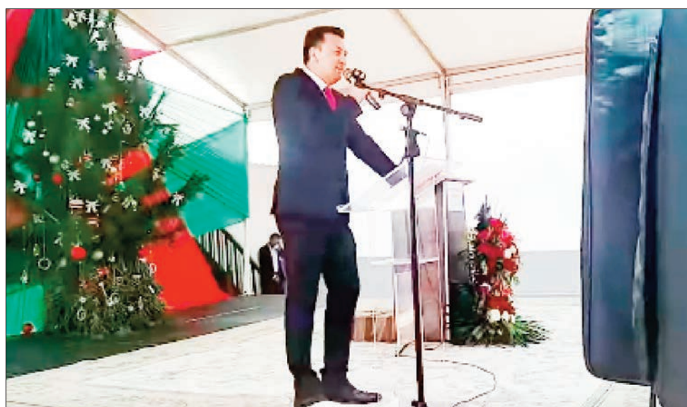
Ireo solontena, niatrika ny fiarahabana ny filoha Ravalomanana, tratra ny faha-74 taonany ny talata teo.