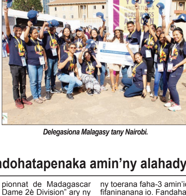
Delegasiona Malagasy tany Nairobi.