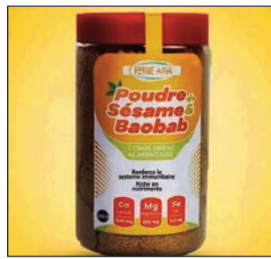
Vokatra sakafo avy amin'ny sesame sy baobab.

« Varimbarian'ny lavitra ny maro amin'ny Malagasy ka tsy mahita ny ambany maso ». Marina loatra io raha ny tontolon'ny fanjifana sakafo eto amintsika no dinihana. Sondriana loatra amin'ireo vokatra sakafo hafarana avy any Dilambato ny maro amintsika, koa tsy mahatsiaro saina intsony fa manana karazan-tsakafo voajanahary vokatra ny tany eto Madagasikara izay mitondra fahasalamana feno ny Malagasy.