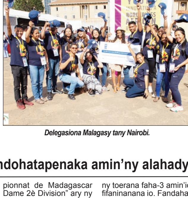
Delegasiona Malagasy tany Nairobi.