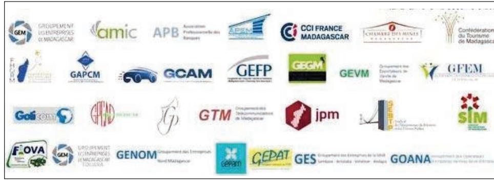
Ireo fikambanana sy vondron'ny mpan-draharaha tsy miankina nanao fanambarana niaraka.

Manoana ny olan'ny angôvo eto amintsika dia ny resaka jiro sy rano, nampiaka-peo izao ny sehatra tsy miankina eto amintsika mivondrona amin'ny fikambanana miisa 30 eo. Tokony hatomboka amin'izay ny tetikasa Sahofika sy Volobe, hahazoana rianarana avy amin'ny rian-drano, hoy ireto mpan-draharaha maro avy amin'ny sehatra tsy miankina ireto. Fotoanan'ny fanatanterahana asa izao, fa tsy fotoanan'ny resabe intsony hoy ny fanambarana. Ireo tetikasa famokarana angôvo 2 ireo no heverin'izy ireo, fa vaholana maharitra amin'ny olan'ny jiro eto amintsika, eny fa na ny rano koa aza. Ny angôvo azo havoazina avy amin'ny rano, hoy ihany ny fanambarana dia azo tanterahana