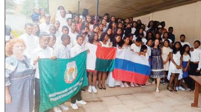
Ireo mpan-dray anjara tamin'ilay fampisehoana fifaninanana niarahana tamin'ny Rosiana.