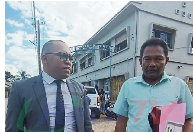
Ny mpanao gazety Gasikara Fenosoa teny Fiadanana (ankavia).