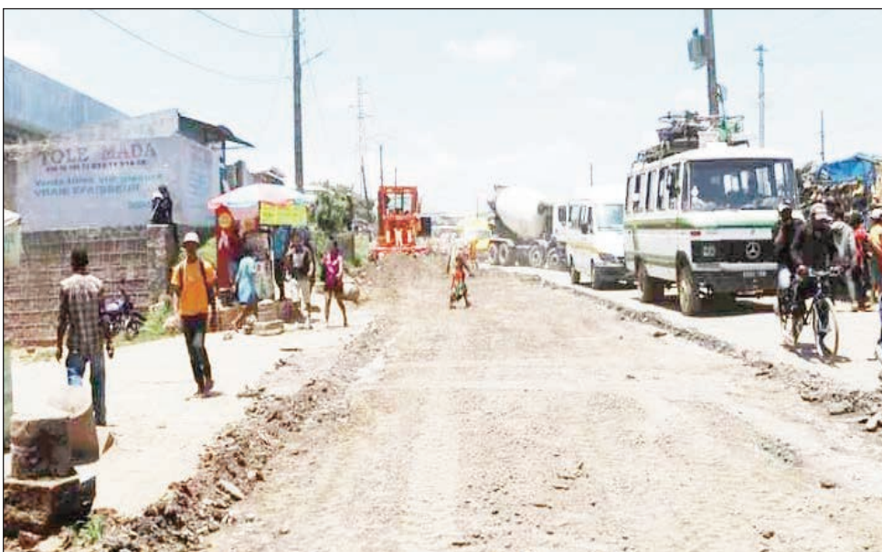
Ny fanamboarana ny lalana eny amin'ny Fasan'ny Karana.

Amin'ny faran'ny volana janoary 2024 vao ho vita ny fanarenana ny lalana Ankadimbahoaka, Fasan'ny Karana, Anosizato, na ny lalampirenena: RN 58. Arak'izany, 6 herinandro eo no hanamboarana sy hanarenana izany lalana izany. Natomboka ofisialy ny talata teo ny fanarenana io lalam-pirenena RN 58 io. Ny orinasa Colos no miantSORAKA ny asa atao amin'izany. Mampikaikaika ny mpampiasa lalana tokoa ny fisiana ampahan-dalana ratsy dia ratsy amin'io