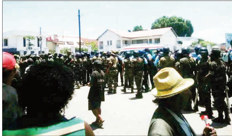
Nitifitra sy nandefa baomba mandatsa-dranomaso anefa avy eo ireo herim-pamoretana.