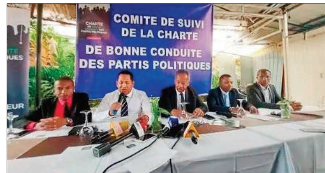
Ireo ao amin'ny Komity mpanara-maso ny fitsipi-pitondrantenan'ny antoko politika.

Misaona indray ny fanatanjahantena Malagasy