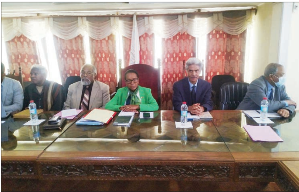
Ireo anisan'ny nitarika ny dinika teny Tsimbazaza omaly.