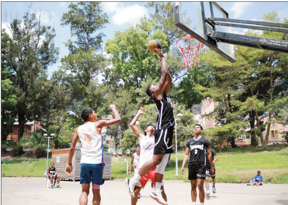
Basikety 3x3 Malagasy.

Ho tanterahina eo amin'ny amin'ny kianja « terrain spécial 3x3 » eo amin'ny Esplanade anoloan'ny Lapan'ny Tanànan'i Toamasina Faritra Atsinanana amin'ny sabotsy 11 sy alahady 12 novambra 2023 izao ny hetsika basikety « Tournoi FIBA 3x3 Game On » izay ho eo ambany fahian'ny FMBB « Fédération Malagasy de Basket Ball » ary ho karakain'ny ligim-paritry ny basikety baolina Atsinanana miaraka amin'ny Kaominina andrenivohitr'i Toamasina sy ho tohanana'ny Telma Madagascar sy MVola. Natokana hoan'ny sokajy U17 Zatovalahy sy OPEN Lahy sy OPEN Vavy Ary Vétéran Lahy sy Vétéran Vavy izy ity izay hiaraka amin'ny fanetsiketsehana samihafa, varotra fampirantiana sy « Concours Dunk