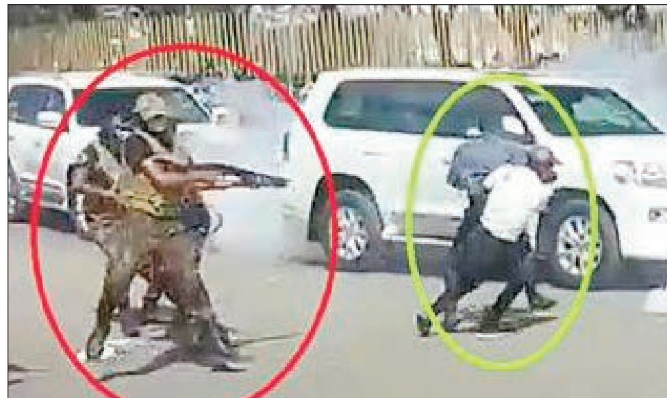
Fisamboarana nataon'ireo herim-pamoretana ny depiote Fetra teo Mahamasina.