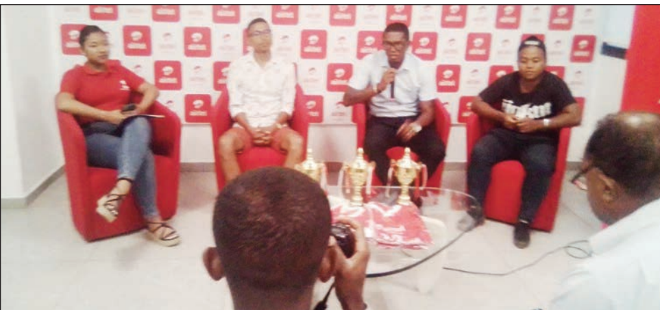
Fc Copain sy Airtel teny Alarobia/Ivandry.