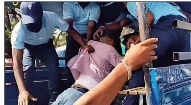
Ny fisamborana niaro herisetra natao tamin'ny depiote Fetra tetsy Mahamasina.