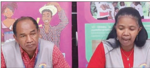
Anisan'ny mpitarika ireo mpanara-maso avy amin'ny Safidy.

Mahakasika ny fifidianana sy ny voka-pifidianana, tamin'ny fifidianana amboetra natao teto amintsika ny 16 novambra lasa teo, misy mandrahona amin'izao fotoana, ireo mpanara-maso ny fifidianana avy amin'ny fiarahamonim-pirenena Safidy. Araka ny fanambarana nataon'izy ireo : "iharan'ny fandrahonana ireo mpanaramaso Safidy eran'ny faritra, ka amin'ny alalan'ny antso an-tariby no