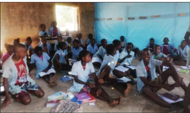
Sekolim-panjakana any Bezezika, mianatra amin'ny tany ireo mpianatry ny CEG.

Mampalahelo fa mipetraka mianatra amin'ny tany ireo mpianatra amin'ny CEG any Bezezika faritra Menabe. Tranompokonolona tsy misy varavarana zara raha mitafo sady tsy misy dablo, no ianaran'ny mpianatra, misy trano efitra roa mba nomen'ny fanjakana saingy tsy misy fitaovana sady tsy mbola natolotry ny tompony dia tsy azo ampiasaina, ka dia vakivaky fotsiny ao ny rindrina sy fitaratra ary ahiana hirodana ho azy toy ny Tranoben'ny Serasera teo iny, satria efa ho avy ny orana. Miantso ireo malalananana, sy izay afaka manampy ireo mpampianatra sy ray aman-dreny ao amin'ity Ceg ity noho ny fahasahiranana ny ray aman-dreny, tsy hahafahany mampiana-janaka ny any Mahabo sy Ankilivalo ary na dia hiezaka aza izahay hoy izy ireo : ny rano ambolena tsy misy, etsy ankilany koa ny asan-dahalo mamely.