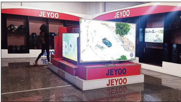
Entana hita amin'ny Tranomboatra Baolai.

Rehefa manakaiky toy izao ny volana desambra dia ny fety maro ho avy no hiantefan'ny sain'ny daholobe. Manana tolotra miavaka mifanojo amin'izany ny Tranomboatra « Baolai » etsy Soarano sy Analakely ary Bazar - Be Toamasina. « Maro ny entana vaovao, loha-laharana amin'ny kalitao sady mibika amin'ny vidiny mirary izay hita ato aminay. Izay hita ao ny Laser TV samihafa misy hatramin'ny 120" - Smart tv sy télé led misy manomboka 32" hatramin'ny 85" ( misy antoka 1 taona daholo),