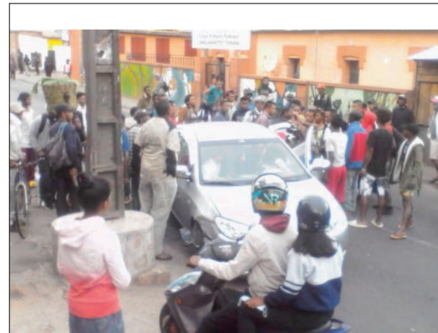
Lozam-piara-kodia teo Analamahitsy Tanàna ny alahady teo.