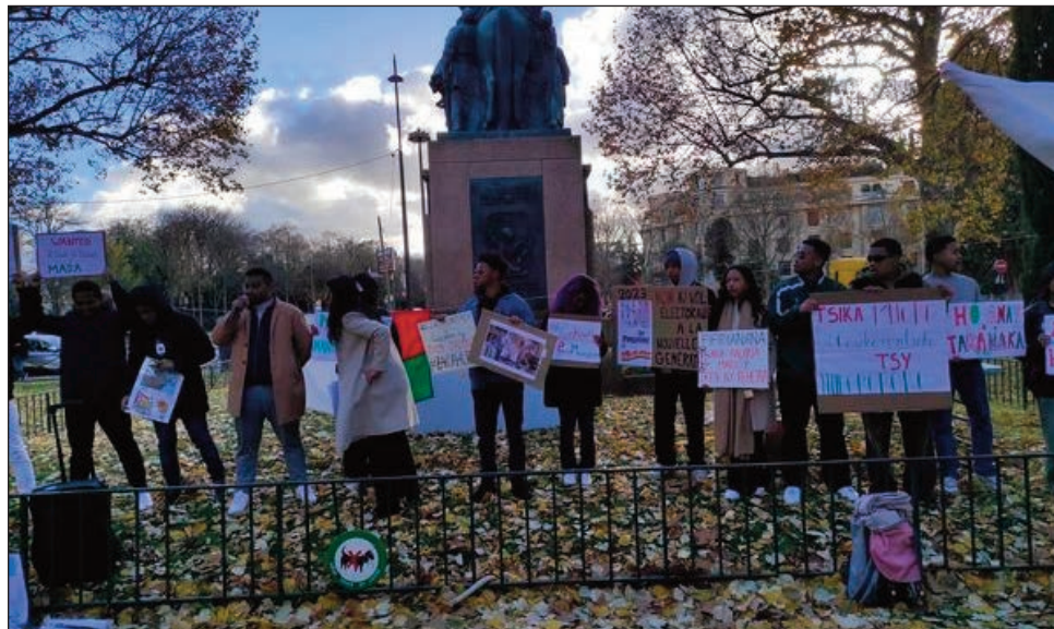
Hetsika fotsy notanterahan'ireo Malagasy monina any Montréal any Canada ny sabotsy teo.