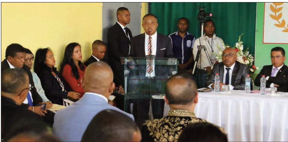
Ny CENI namoaka voka-pifidianana “fôpla” ny sabotsy teo.

Raha any an-dakilasy, no anoharana ny fifidianana amboetra teo iny, dia mpianatra manao « fraude » no misy. “Fraude” no nataon'i Andry Rajoelina ka nahazoany isa tsara, anisan'izany ny fanafanana taloha ilay 8 cm, fa nivoaka ihany izany tamin'ity taona ity. Midika tsotra izao, fa tsy fahazana izany raha any mpianarana. Mpianatra tsy mamitaka ny tenany fotsiny ihany, fa mamitaka ny rehetra hatramin'ireo ray aman-dreniny. Toy izany koa ny an'ity kandida frantsay ity, tsy ny tenany ihany no fitahiny, fa ny vahoaka malagasy manontolo mihitsy, ary hatramin'ny any ivelany io. Ny tena mpianatra anefa mahalala tsara ny fahaizan'ilay mpianatra, ary ny taranja nanalàny fanadinana tsy misy ary tsy anaoavana fahagagana, fa tena mitaky fahazana. Miharihary araka izany, fa hala-tahaka na “fraude” matoa izy nahazo naoty tsara, ary tsy misy fanazavana ankoatran'izay. Eto amin'ity resaka fifidianana ity ihany koa, dia toy izany. Tsy misy afa-tsy hosoka sy tsy fahamarinana ihany no hany tokana hahafahan'i Andry Rajoelina nahazo vato. Raha nanao toy iretsy kandida 10 tsy nanao fampielezan-kevitra izy angamba fa nian-dry fotsiny, dia aza inoana marimarina fa zara hahazo isam-bato 1 hatra-