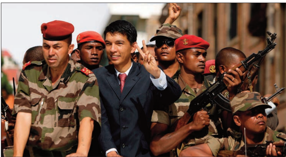
Fanonganam-panjakana notarihan'i Andry Rajoelina tamin'ny taona 2009.

Tamin'ny fotoana na-naovan'i Andry Rajoelina sy ny forongony fanonganam-panjakana teto amin'ny firenena, ny 2009 – 2010, no nanomboka nikorosy fahana ny soatoavina malagasy sy ny maha malagasy mihitsy amin'ny ankapobeny. Anisan'ny nisongadina tamin'izany ny tsy fanomezan-danja na fanajana ireo lazaina ho raiamandreny na zokiolona. Tsy nohenoin-teny mihitsy ireo olona fanaja ireo. Anisan'ny tranga niharihary tamin'izany ny teny amin'ny toby miaramila Ampahibe, ny nani-ratsiran'ny ambany grady ny manamboninahitra ambony indrindra teto amin'ny firenena. Teo koa ny nitranga teny amin'ny Episcopat Antanimena, izay ny filoham-piangonana mihitsy no nozimbazimbaina sy sahy nokasihin-tanana mihitsy. Mety tamin-dRajoelina avokoa izany rehetra izany, sy ny sisa nanaraka rehetra. Folo taona mahery aty aoriana, mbola tsikaritra mitohy izany fomba sy toetra ratsy izany. Tsy henoiny ary tsy hamakiany loha ireo raiamandreny samihafa na ara-drazana na avy amin'ny fiangonana, na ny manam-pahaizana, izay tena to teny