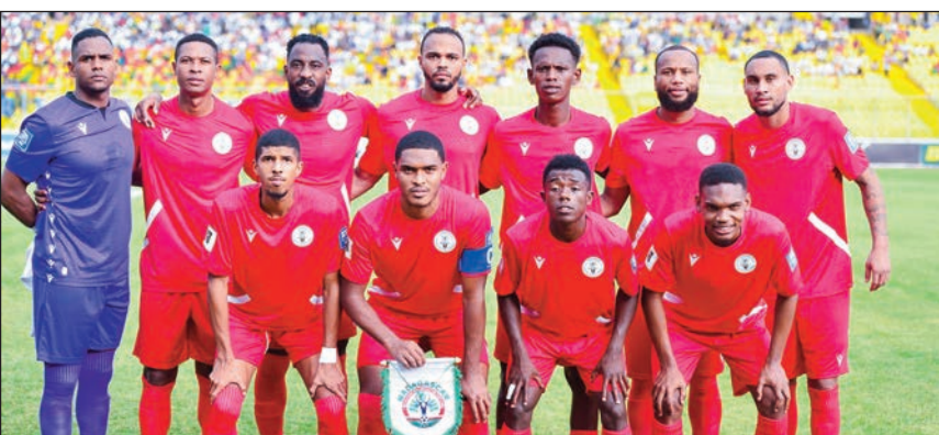
Barea de Madagascar tany Ghana.

Mahavelom-bolo ireo mpilalao man- drafitra ny Barea'i Madagasikara miatrika lalao baolina kitra indroa miantoana sahady, izay ny eki- pan'ny Barea de Madagascar no niatrika ny fifanintsanana haha- zoana miatrika ny « Mondial 2026 », nataony tamin'ny zoma lasa teo tany Kumasi Ghana, ka naharesy