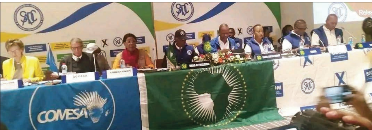
Ireo mpanara-maso ny fifidianana iraisam-pirenena, teny amin'ny Novotel Alarobia ny sabotsy teo.

Nitafa tamin'ny mpanao gazety, nitatitra ny fana-raha-maso ny fifidianana nataony, teny amin'ny Novotel Alarobia ny sabotsy teo ny mpanaramaso iraisam-pirenena avy amin'ny Sadc (Southern Africa Development Community), ny Vondrona Afrika, ny Comesa (Common Market for Eastern and Southern Africa) ary ny OIF (Organisation Internationale de la Francophonie). Anisan'ny nambaran'izy ireo tamin'izany, ny tokony hisian'ny fifampiresahana eo amin'ny samy Malagasy hametrahana fitoniana eto amin'ny firenena. Tsy tena nahasahana faritra maro teto amin'ny Nosy izy ireo, satria birao fandatsaham-bato 2000 mahery teo ihany no voasahany tamin'ny