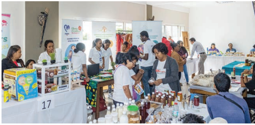
Fihaonambe nasionalin'ny mpandraharaha tetsy Antaninarenina.

Nomarihana ny herinandro teo teto amintsika ny herinandro'ny fandraharaha maneran-tany. Nomarihana tamin'ny alalan'ny fihaonambe nasionalin'ny mpandraharaha andiany faha-5 izany tamin'ity taona ity, tao amin'ny Hotel Le Pavé Antaninarenina nandritra ny roa andro misesy, ny 17 sy 18 Novambra 2023 teo. Ny hetsika dia nahitana varotra sy fampirantiana ary famelabaran-kevitra narahina adivevitra. Fihaonambe nasionalin'ny mpandraharaha izy io,