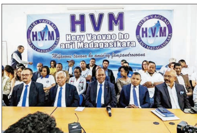
Ireo lohandohan'ny mpisorona ao amin'ny antoko HVM ny sabotsy teo.

Mahakasika ny raharaham-pirenena, indrindra ny homba ny fifidianana filohampirenena fihodinana voalohany natao amboetra ny alakamisy lasa teo ny fanatanterahana azy, naneho ny heviny tamin'ny alalan'ny nitafa tamin'ny mpanao gazety teny Andraharo ny antoko HVM ny sabotsy teo. Voalaza tamin'izany, fa mijoro hatrany ny HVM hiaro ny rariny sy ny aradala, satria tsy afaka hiantoka ny fitoniana ara-politika io fifidianana izay natao amboetra io, ary vao maika hanapotika ny fiarahamonina Malagasy sy ny toe-karena. Tsy hanaiky ny valim-pifidianana izay peta-toko, sy tsy nandraisan'ny rehetra anjara, tsy manaraka ny fenitra