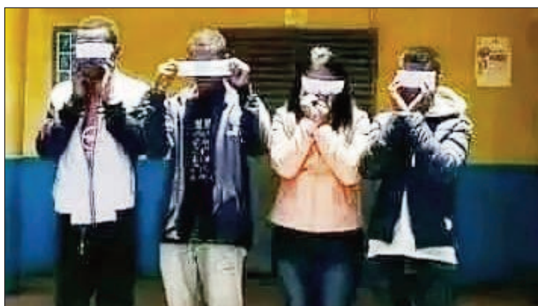
Ireo voatazona noho ny raharaha Ntsoa VHF.