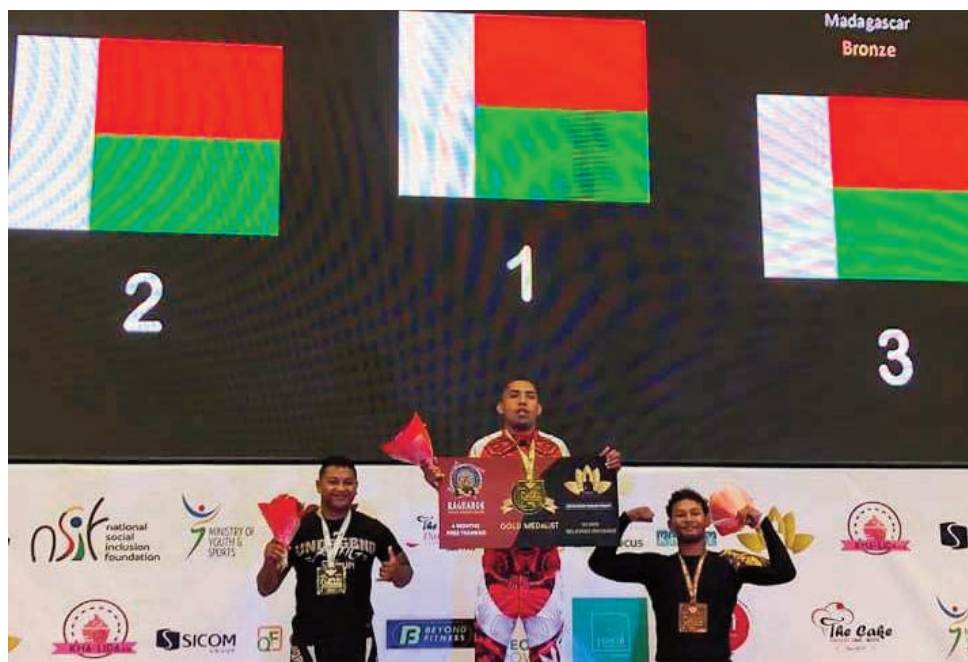
Santonan'ireo athleta malagasy niakatra Podium tany Maorisy.