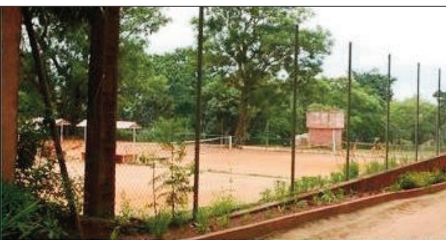
COT Ankadikely Ilafy.

Hiatrika fifaninana « Championnats de Madagascar 2023 » ny tenisy sokajy « Toutes catégories », sy so- kajy « Vétérans », amin'ny alatsinainy 27 novambra ho avy izao, ka hatramin'ny alahady 3 desambra 2023 etsy amin'ny kianja filalaovan'ny COT « Club Olympi- que de Tananarive » etsy Ankadikely Ilafy », handrai- san'ireo ligy rejionaly rehetra eto Madagasikara anjara (Amaron'i Mania, Analamanga, Atsimo Andrefana, At- sinanana, Boeny, Haute Matsiatra, Vakinakaratra). Mpikarakara manazava loatra ny FMT « Federation Malagasy de Tennis », hotronin'ireo mpanohana ofi- sialy dia ny Telma Madagascar sy ny Club Olympique de Tananarive.