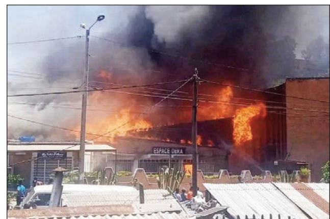
Ny fahamaizan'ny Espace Dera Tsiadana.