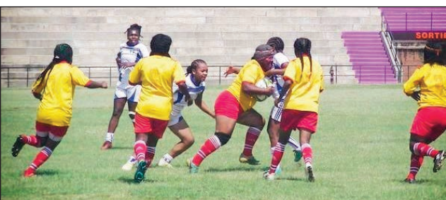
Fihaonana teny Andohatapenaka tamin'ny alahady.

Nitohy tetsy Andohatapenaka ny fifaninanana rugby vehivavy, fiadiana ny ho tompondakan'i Madagasikara sokajy D-1 sy D-2 tamin'ny alahady 19 novambra teo, ka lalao niisa 3 no tanteraka tamin'ireo 4 tao anaty fandaharan-dalao. Voka-dalao azo : Uasc Cheminot 05 – 00 Fanja Anjanahary, XV Red Tanjombato 00 - 46 Ftl Lalamaty, Ftm Manjakaray 19 – 37 Fta Antohomadinika. Marihana fa somary nangadihady toy ny mahazatra ny fijerem-baolina tetsy amin'ny kianjan'ny Makis Andohatapenaka, satria baolina sokajy vehivavy no natrehana.