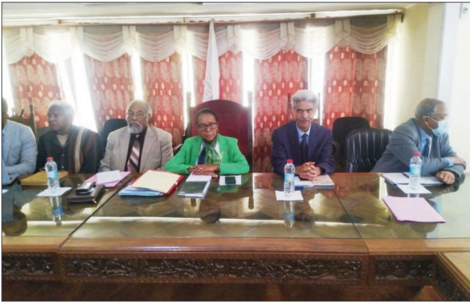
Ireo anisan'ny nitarika ny dinika teny Tsimbazaza omaly.