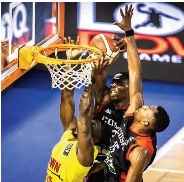
Ny Cospn Madagascar tany Johannesburg.

Tsy tafita ho any Kigali Rwanda, hiatrika ny dingana famaranana, amin'ny fifaninanana basikety "BAL (Basketball Africa League) 2024" ho tanterahina amin'ny volana martsa 2024 ho avy izao ny ekipa Malagasy Cospn, niatrika ny fifaninanana "Road To Bal 2024 – Elite 16 Division Est" notanterahina tany Johannesburg Afrika Atsimo tao amin'ny kianja "Ellis Park Arena" ary nifarana tamin'ny alahady 26 novambra 2023 teo, fa lavon'ny ekipan'i Dynamo du Burundi tamin'ny moka fohy 79-78 teo amin'ny lalao fiadian-toerana tamin'io fifaninanana io. Teo amin'ny lalao ankatoky ny famaranana natao