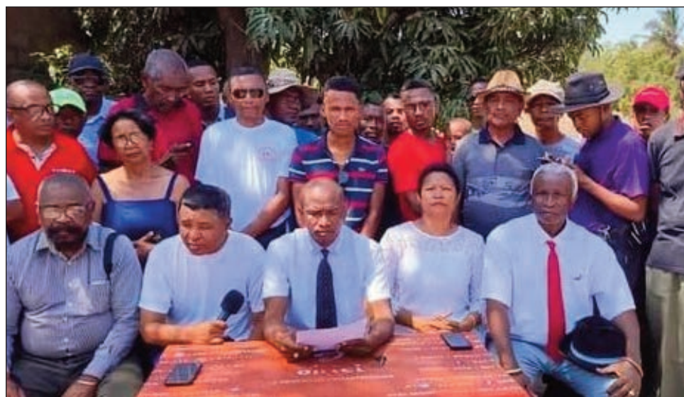
Ny avy amin'ny KMMR Atsimo Andrefana.