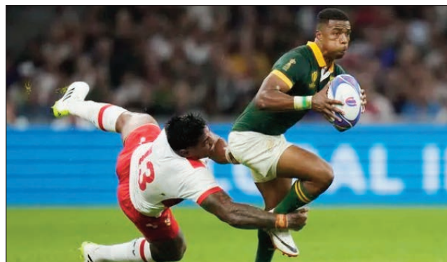
Fiadiana ny amboaran'ny tompon-daka eran-tany amin'ny rugby atao any Frantsa.

Nifaranatamin'ny alahady 01 oktobra 2023 teo, ny andro faha-4 amin'ny fifanintanam-bondrona, eo amin'ny fifaninanana rugby fiadiana ny ho tompondaka eran-tany 2023, tontosaina any Frantsa ankehitriny. Ny fihaonan'i Australie sy Portugal ao amin'ny vondrona (C) 34 - 14 ary ny an'ny Afrique de Sud sy Tonga 49 - 18 ao amin'ny vondrona (B) no namarana an'izany tantetraka. Voka-dalao andro faha-3 tontosaina tamin'ny sabotsy 30 septambra 2023 teo : Argentine 59 -