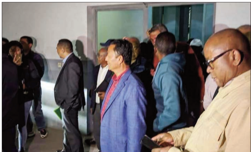
Ny diabe am-pilaminana nataon'ny vondron'ireo kandidà 11, niaraka tamin'ireo depiote avy eny Ambatonakanga, nankeny Anosy ny talata tolakandro teo.