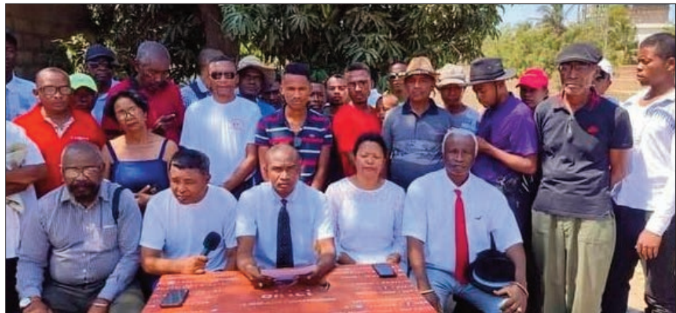
Ny vondron'ireo kandidà 11 nandeha hihaona tamin'ny FFKM tao Ampandrana ny talata hariva teo.