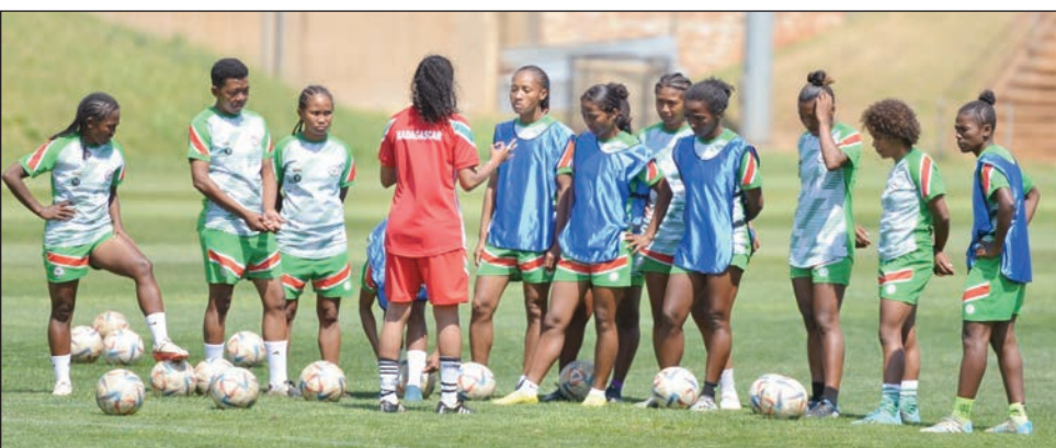
Barea vehivavy atsy Afrika Atsimo.