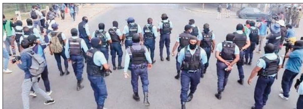
Misy raha ao, matoa ny zandary no tena mavitrika amin'ny famoretana.

Manoana ny hetsika an-dalambe nisy tamin'ity herinandro ity, noho ny hetsika nataon'ny vondron'ireo kandida 11, sy noho ny fandikan-dalàna ataon'ny ao amin'ny Zandarimariam-pirenena mahakasika izany, mimenomenona ankehitriny ny ao anivon'ny polisim-pirenena sy ny ao anivon'ny tafika Malagasy, momba ny fitarihana ny fitandroana ny filaminana mandritra izany ataon'ny EMMO, na ny OMC. Tompon'andraikitra amin'ny polisy sy ny tafika no nilaza fa mandika ny lalàna misy ny zandary miseho mitarika ny OMC io. Araka ny lalàna hoy izy ireo, araka ny: "Décret n° 84-056 du 8 février 1984 portant création de l'Organisme Mixte de Conception (J.O. n° du , p. ), modifié par décret n° 2002-058 du 29 janvier 2002 Article premier - Il est institué au niveau national et à l'échelon des Collectivités décentralisées un organisme mixte de conception et un état-major mixte opérationnel à tous les ni-