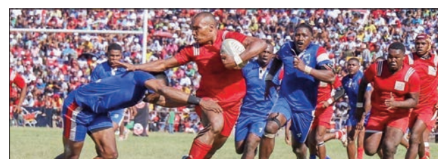
Fihaonan'ny Ftm sy Cosfa teny Andohatapanaka.

Ny ekipan'ny Cosfa Miaramila sy Ftm Manjarkaray, no fantatra avy amin'ny fanapahan-kevitra ny Malagasy Rugby, fa hiatrika ny lalao famaranan'ny fifaninanana rugby « Energy Top 20, 2023 », izay hotontosaina amin'ny alahady 08 oktobra 2023 ho avy izao etsy amin'ny kianja Makis Andohatapanaka, hanomboka amin'ny 3 ora tolakandro, hialohavan'ny lalao fiadiantoerana faha-3, hifanandrinan'ny 3Fb Fahasalama sy ny Uscar Commu-