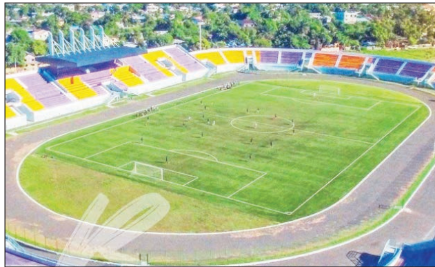
Kianja « Barikadimy Stadium Toamasina ».