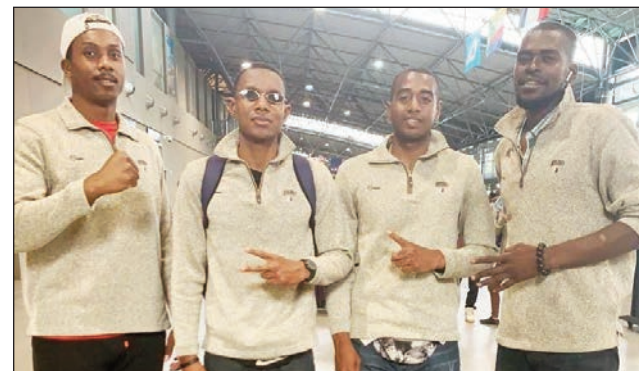
ANTANANARIVO tonga teny Ivato.