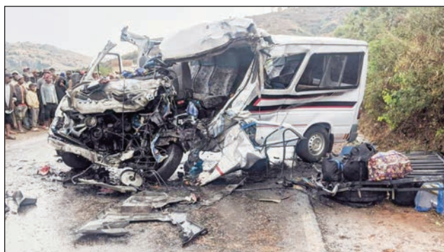
Ilay taksibrosy niharan-doza tamin'ny RN7.