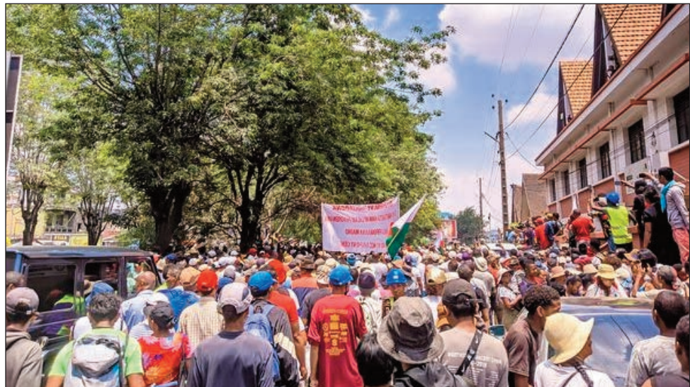
Ny hetsika am-pilaminana nataon'ny vondron'ireo kandidà 11 teny amin'ny Cenam 67ha, ny talata teo.