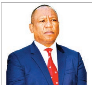
Praiministra, anisan'ny mpanapotika ny firenena tao an-dRajoelina koa i Ntsay Christian.

Miezaka mafy indray izao ny Governemantan'i Ntsay Christian manao izay hanarian-dia: "diversion" ny vahoaka malagasy. Atao-ny izay hanakonana ny tena fototry ny olana eto amin'ity firenena ity. Tsy inona izany fa ny fizakan'i Andry Rajoelina ny zompirenena frantsay. Tsy azo ekena velively sy lavina marindrano ny hirotsahany ho kandidà filohampirenena eto amin'ny tany sy fanjakana. Ny fanarian-dia ataony ankehitriny dia ny filazana efa ntravahana ny fandrafa na ny fidinana an-dalambe, tsy sakantsakanana intsony, ankoatra ny mankeo amin'ny kianjan'ny 13 Mey. Izany hoe mody aseho fa malalaka ny fanehoan-kevitra an-dalambe ary ampanjakana ny demôkrasia. Fitaka bevava sy fihatsarambelatsivahy tsotra izany, ka tsy tokony ho voafandrika amin'izany ny kandidà 11 sy ireo solombavambahoaka miara-dia amin'izy