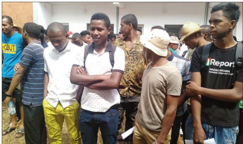
Ny hetsiky ny vondron'ireo kandida 11 teny Tanjombato sy teny Mahamasina omaly.