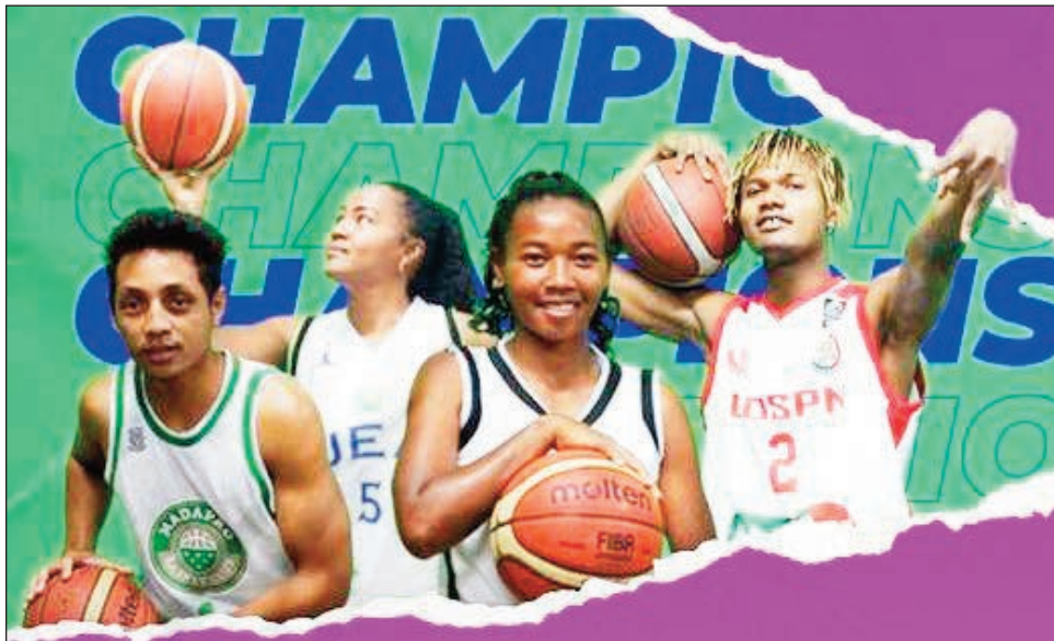
Basket N 1 A lahy sy vavy.