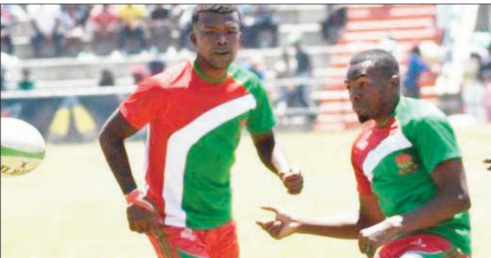
Rugby Federaly 2, 2023.