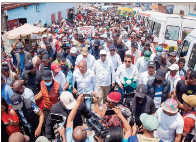
Ny hetsiky ny vondron'ireo kandidà 11, tao amin'ny Boriboritany faha-5 omaly.

Toerana miisa 7 no hiaingan'ny Diabe hataon'ny vondron'ireo kandidà 11 anio sabotsy 14 oktobra. Ny voalohany eo amin'ny kianja Barea Mahamasina ho an'ireo olona avy any Atsimondrano, Tanjombato, Tsimbazaza, Anosibe, Ampefiloha, ... Ny faharoa miainga eo amin'ny rond point Ampasika: ny avy any Itaosy, 67 ha, Andohatapanaka, ... NY faha-3, miainga eo amin'ny rond point Ankazomanga ho an'ny avy any Ankazomanga, Ambohimananina, Ivato, Antanimena, ... Ny faha-4, miainga avy ao amin'ny rond point Anjanahary ho an'ny avy any amin'ny Anjanahary, Analamahitsy, Avaradrano, ... Ny faha-5, miainga eo amin'ny rond point Ampasampito ho an'ny avy any Ampasampito, Ambohim-