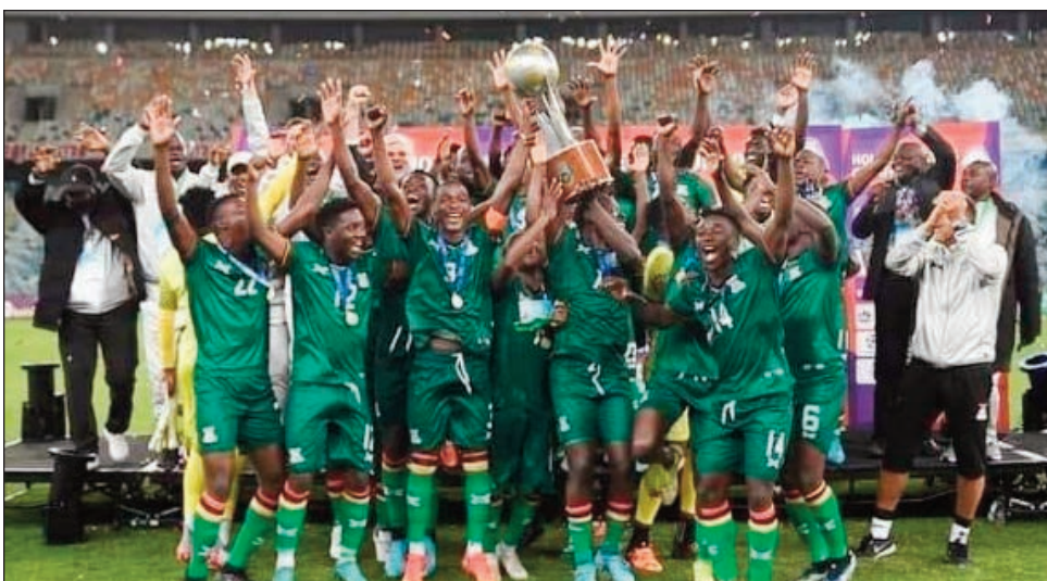
Ny ekipa vehivavy Zambia tompondaka farany (2022).

Ho fantatra amin'ny lalao famaranana ho tontosaina rahampitso alahady 15 oktobra 2023, izay ekipam-pirenena hisalotra ny anaram-boninahitra tompo-ny amboara Cosafa Cup 2023, ka handimby ny vehivavy Zambia, izay nandrombaka ny amboara farany tamin'ny andiany faha-10 (taona 2022). Amin'ny 4 ora hariva (ora Afrikana Tsimiso), no hanatanterahana an'io lalao famaranana io, izay hialohan'ny lalao fiandrian-toerana faha-3 hanomboka amin'ny 1ora atoandro (ora Afrikana Tsimiso). Hifarana rahampitso izany ity andiany faha-11 amin'ny fifaninana baolina kitram-behivavy ity. Marihana fa omaly zoma 13 oktobra no nanatanterahana an'ireo lalao ankatoky ny