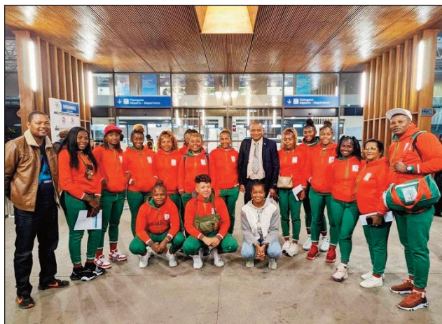
Delegasiona rugby à 7 vehivavy Malagasy lasa any Tunisie.