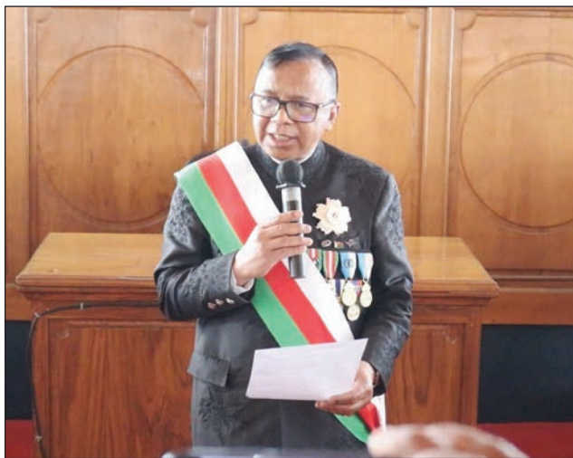
Ny filohan'ny Antenimierandoholona vaovao, natao amboetra ny fametrahana azy.

Amboetra no nametrahana ny jeneraly misotronono Richard Ravalomanana ho filohan'ny Antenimierandoholona, vita omaly ny fifidianana ho amin'izany, ka senatera miisa 15 amin'ny 18 no nifidy azy. Tsy ara-dalàna ny fivoriana tsy ara-potoana nanaovana izany fifidianana izany, satria toko ny ho 12 andro no anatanterahana fivoriana tsy ara-potoana izany, ary tokony mivory ihany koa ny Antenimierampirenena vao mivory ny etsy Anosikely. Rariny raha any amin'ny kizo ny firenena ankehitriny, satria fitondrana jiolahimboto araka ny tenin'ny kandida Hajo Andrianainarivelo no mitondra eto, na efa lasa nametra-pialàna aza ilay filoha niantana ny firenena nandritra ny 5 taona dia mbola izy ihany no mi-baiko ireo rehetra teo am-