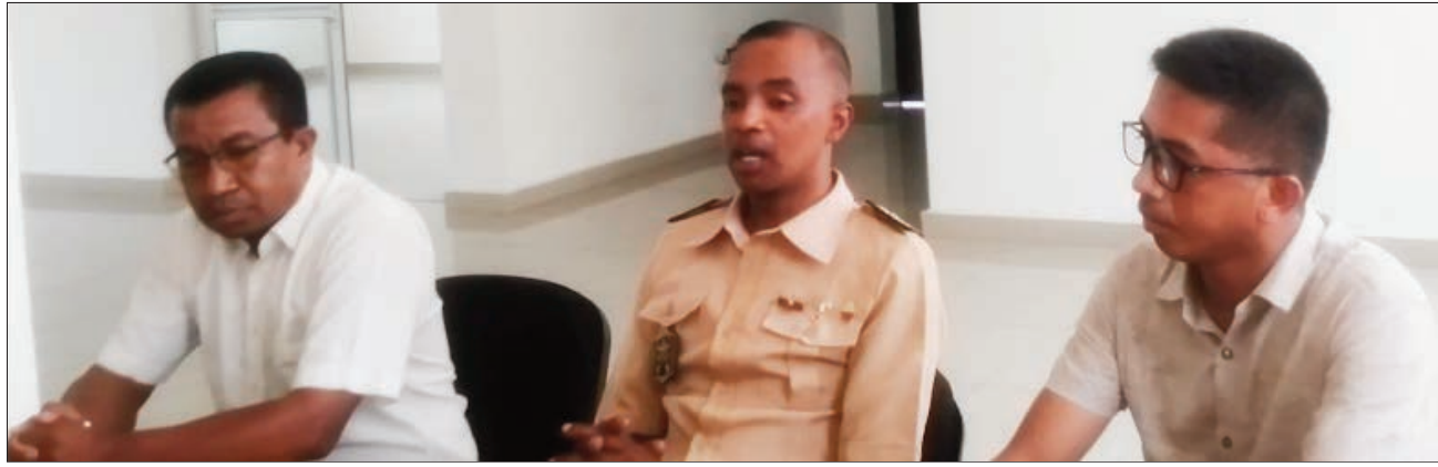
Ny Prefet sy ny talen'ny Jirama Morondava ary ny tompon'andraikiry ny GES.

Tsy ampy ny herinaratra izay avy amin'ny GES mpamokatra ny herinaratra haparitaky ny JIRAMA Morondava faritra Menabe, satria amin'izao fotoana izao ny Jirama Morondava dia efa tsy mamokatra herinaratra intsony, fa ny GES no mamokatra izany, fa mitsinjara sisa no ataon'ny JIRAMA dia manangona facture ; raha ny zava-misy hatreto dia mbola nofinofy ho an'i Morondava izany ho foana izany ny delestage, satria dia 25,6% ny filan'ny mponin'i Morondava ihany no herinaratra vokarin'ny GES satria ny 2500KW na 2,5Mw no filana ampy ho an'i Morondava dia tsy misy afatsy 640Kw na 0,64 MW fotsiny, no vokatra afaka omena ny mponin'i Morondava, ka dia inona moa izany, fa dia toy ny lakan-dranon'i Dabaraha ihany ny olan'ny delestage eto Morondava, ka sarotra ny hino sy hisy fahagagana hahafaona ny delestage eto Morondava izany, satria dia mbola andalam-pamitana ny centre solaire eny Kimony izay