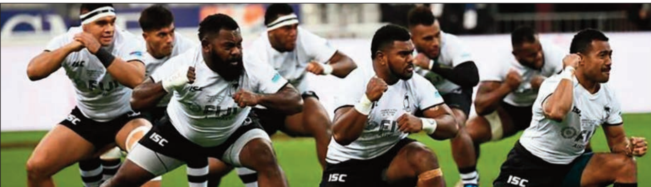
Ekipam-pirenen'i Fidji baolina lavalava.