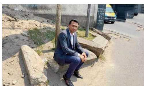
Teto no nosamborina i Rina, ary niverina naka sary teo izy omaly rehefa nivoaka teny amin'ny Fitarana.