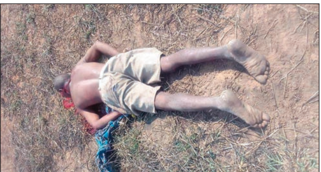
Dahalo lavo tany Menabe.

Tato ato zay dia miha-mahazo vahana ny tsy fandriampahalemana ato amin'ny faritra Menabe, satria dia saika isan'andro no ahe-noana trangana tsy fandriampahalemana manerana ny faritra Menabe. Distrika iray amin'ireo distrika dimy mandrafitra ny faritra ihany no voafehy sy ahitam-bokatra dia ny distrikan'i Miandrivazo izany, fa ireo distrika efatra kosa dia raha tsy misy halatr'omby dia fakana an-keriny na fangalarana ireo olona varira. Tao anatin'ny therinandro lasa izay fotsiny dia omby aman-jatony no lasan'ireo dahalo ary olona 3 nisy naka an-keriny, ny iray no efa navototsot'ireo naka an-keriny azy rehefa nadoa vola 20 tapitrisa ariary