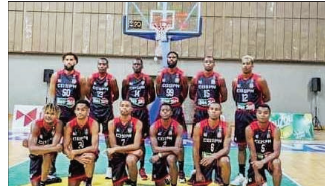
Ny ekipan'ny Cospn Oktobra 2023.