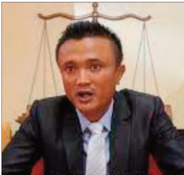
Ny filohan'ny SMM.

Noho ny toedraharaham-pirenena amin'izao, nanao fanambarana ny SMM, na ny sendikan'ny mpitsara eto Madagasikara, aza atao fitaovana anaovana ramatahora ny fitsarana hoy izy ireo: "Manoloana ny toe-draharaha misy eto amin'ny tany sy ny firenena, ny Sendikan'ny Mpitsara eto Madagasikara dia manao izao fanambarana izao: Manantitra hatrany ny tokony hanajana ny lalàna velona eto amin'ny tamin'ny Repoblika'i Madagasikara; Mitaky ny fanajana ireo zo fototra rehetra voalazan'ny Lalàmpanorenana, zo izay sitrahan'ny olom-pirenena isam-batan'olona. Mitaky ihany koa ny tsy hanaovana ny rafi-pitsarana misy ho fitaovana entina hanaovana rama-