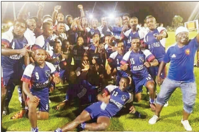
Ftm tompondakan'i Madagasikara 2023.

Tontosa teny amin'ny kianja Makis Ando-hatapenaka tamin'ny alahady 8 oktobra 2023 teo, ny lalao famaranana ny fifaninanana Rugby « XXL Energy Top 20 2023 », ka nifanandrian'ny fileovana Cosfa Miramila sy Ftm Manjarkaray. Ity farany no nandrombaka ny anaramboninahitra tompondakan'i Madagasikara 2023 ary nahazo ihany koa ny lelavola 3 tapitrisa ariary rehefa nandresy ny miaramila tamin'ny isa 31 noho 27, tao anatin'ny lalao niady dia niady hatramin'ny farany. Baolina nenti-tanana niisa 3 no tongan'ny Ftm ary tsara baolina niisa 4 no tafidiny raha tsara baolina niisa 4 no tafidiny ny Cosfa ary baolina nentin-tanana