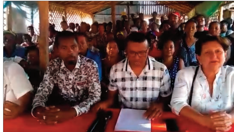
Ny hetsika am-pilaminana, nataon'ny vondron'ny kandida filoha 11, teny Itaosy Antananarivo Atsimondrano omaly.