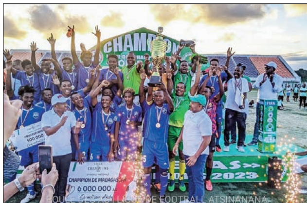
Ny Kfca Diana nandray ny amboara.