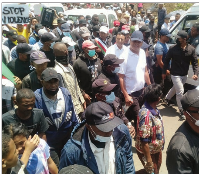
Ny sasany amin'ireo kandidà 11 teny Itaosy omaly.

Nitohy teny Itaosy Antananarivo Atsimondrano indray, ny hetsika am-pilaminana nataon'ny vondron'ireo kandidà miisa 11 omaly. Maro dia maro tokoa ireo mpanara-dia azy ireo nandritra izany. Na nisy aza ny naratra ny sabotsy teo, toy ny kandidà filoha Marc Ravalomanana, tonga nanatevina ny hetsika ny tenany. Nisongadina nandritra izany, fa na inon-kidona, na inon-kihàtra, mitohy hatrany ny hetsika ataon'izy ireo mandra-pivalin'ny fitakiana: dia ny tsy famelana ny kandidà Vazaha Andry Rajoelina hirotsaka, ny fitakiana ny fifidianana madio sy mangarahara ka hovanana ny HCC sy ny CENI, havoaka ireo olona voasambotra noho ny