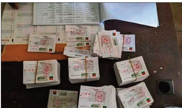
Lisitry sy kara-pifidianana any Morondava.

Manao antso avo amin'ny tompon'andraikitra, ireo mponina feno 18 taoana miakatra, ao amin'ny distrikan'i Morondava, fa maro ireo tsy tafiditra anatin'ny lisitry ny mpifidra, milaza izy ireo fa goragora tanteraka ny fanaovana ny lisitry ny mpifidy, satria raha ny zava-misy hoy izy ireo, tokony hiakatra ny isan'ny mpifidy nohon'ny nanaovana hetsika fanaovana karatra faobe iny, fa toa vao mainka nihena ka manontany tena izy ireo hoe: natao aiza ny anaranay izay noraisinareo toa tsy hita anatin'ny lisitra, satria raha ny zava-misy ao amin'ny fokontany iray ao Marofandilia fotsiny no jerena dia karne miisa 120, no fenon'ireo mpanangona lisitra dia ny mahagaga fa olona 700