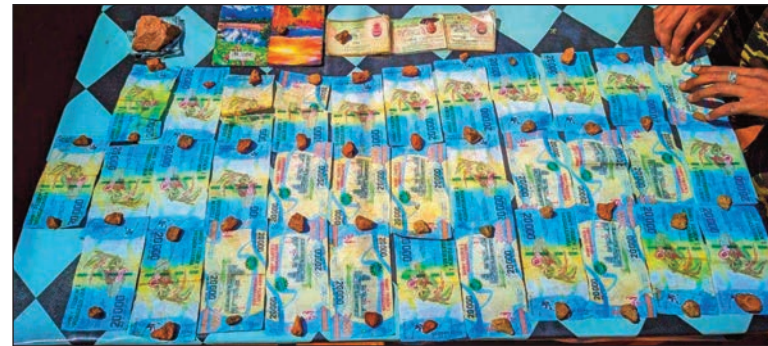
Vola sandoka sarona tany Miandrivazo.