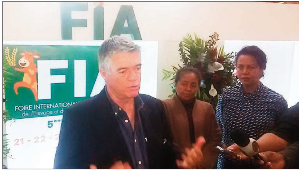
Ireo anisan'ny mpikarakara ny FIA 2023.