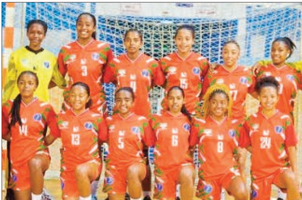
Akio Malagasy any Tunisie.

Nanomboka tamin' ny alakamisy 7 septambra teo any Monastir Tunisie, ka tsy hifarana raha tsy amin'ny alakamisy 14 septambra ho avy izao, ny fifaninana « CAN Junior féminin de handball 2023 » andiany faha-30, izay mifandrindran-dalana amin'ny «CAN Cadets Féminins 2023» andiany faha-19. Mandray anjara amin'ity fifaninana ity izay nozaraina ao anaty vondrona roa i Tunisie (mpampiantrano), Guinée, R. D. Congo, Angola, Algérie, Egypte, Mali, Madagascar, Côte d'Ivoire ary Kenya, ka ao amin'ny vondrona B miaraka amin'i Algérie, Tunisie, Mali ary Egypte (tompondaka lefitra farany) ny Akio U21 Malagasy. Ratsy fanombohana ny Akio Malagasy tamin'ity fifaninana ity, satria lavon'i Tonizia mpampiantrano