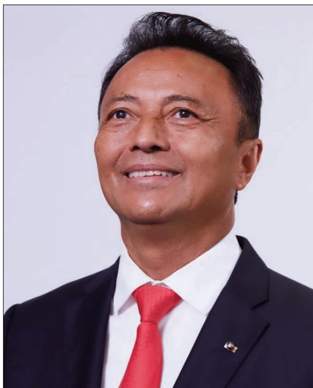
Ny filoha Marc Ravalomanana.