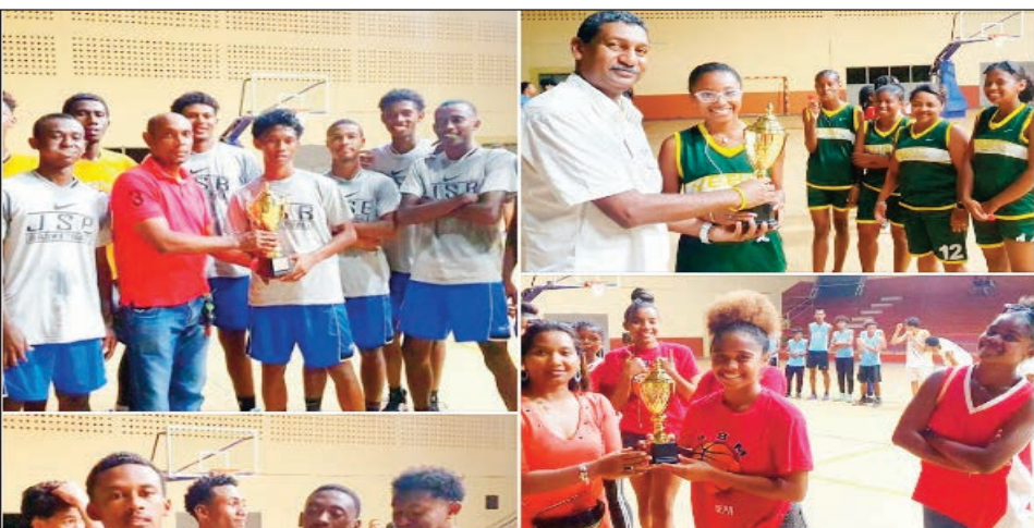
Tompondaka rejionaly Boeny 2023.

Natomboka omaly zoma 09 septambra 2023 tao amin'ny kianja mitafo (Terrains extérieurs), sy tao amin'ny « Complexe sportif Ampisikina | Mahajanga » Faritra Boeny, ka tsy hifarana raha tsy amin'ny alahady 17 septambra 2023 ho avy izao, ny fifaninana basikety fiadiana ny ho tompodaka nasionaly sokajy N1B vehivavy sy sokajy U20 zatovolaha. Anisan'ireo misolo tena ny Faritr'i Boeny amin'izany ny ekipan'ny Ybbc sy JsB izay tompodakan'ny N1B Dame sy U 20 any Boeny.