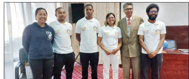
« Forum National Mini-basket ».