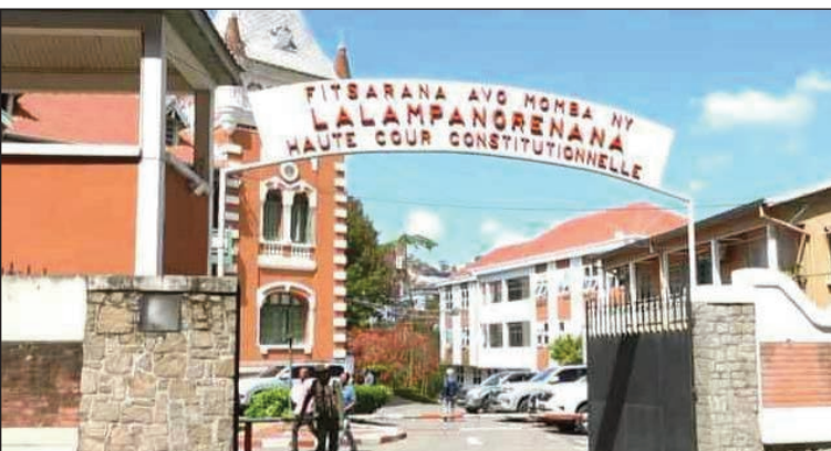
Mitodika etsy Ambohidahy ny mason'ny rehetra anio.

Tantara mitohy ny mahakasika ny firotsahan-kofidian'ny filoha Andry Rajoelina, sy izy ninia naka zom-pirenena Frantsay ka maha very ny fizakany ny zom-pirenena Malagasy. Noho izay antony izay, sy noho izao ho fiatrehana fifidianana izao. Nametraka fitoriana teny amin'ny HCC, Fitisarana Avo momba ny Lalampangrenana ny kandidan'ny MMM, Hajo Andrianainarivelo omaly, satria manit-sakitsaka ny lalana velona ny mbola hiltasahan'Andriamatoa Andry Rajoelina ho fidiana. Toy izany koa, mangataka ny fanafoanana ny firotsahan-kofidian'i Andry Rajoelina teny amin'ny HCC koa ny avy amin'ny antoko HVM. Namafisin'ny HVM fa tsy mahafento ny fepetra takian'ny lalana ity kandida ity.