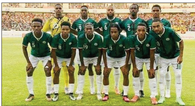
Barea tao amin'ny kianja manarapenitr'i Angola.

Nahavita nanao ady sahala tamin'ny ekipam-pirenena i Angola indray, ny Barea de Madagascar, tamin'ny alakamisy 07 septambra tany amin'ny kianja « Stade National de Tundavala » any Lubango Angola, teo amin'ny lalao fifaninananambondrona andro faha-6 amin'ny «CAN Côte d'Ivoire 2024». Toy ny tamin'ny lalao mandroso nifatrehana tamin'ity ekipam-pirenena i Angola ity, ka nisaraha ady sahala 1-1 tetsy Mahamasina dia io ady sahala 0-0 indray,