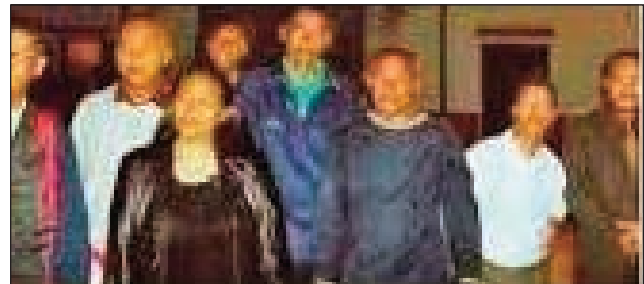
Ireo mpanao gazetin'ny Radio Fahazavana noagadrain'ny fitondrana Rajoelina tamin'izany fotoana.

Nitsingerina omaly ny andro nivoahan'ireo mpanao gazetin'ny Radio Fahazavana ny fonja, izay noagadrain-dRajoelina sy ny Praisimista tamin'izany, Camille Vital. Ity farany mantsy no nisolo-tena ny fanjakana niam-panga sy nitody ireo mpiasa 10 mianadahy ny andron'ny 20 Mey 2010. Nampiasaina natao fitaovana tamin'izany ny minisitry ny serasera tamin'izany fotoana izany. Rehefa nosamboriny izy ireo io andro io, dia nentina teny amin'ny BC Anosy ary notanana teny nandritry ny valo (8) andro, izay tena tsy araka ny lalàna izany. Avy eo dia nampidirina am-ponja teny amin'ny fonjan'Antanimora nandritry ny 3 volana ngarangidiny, ary ny 08 Septambra 2010 no navoaka ny fonja. Nanao ny asany anefa ireo olona ireo amin'ny mahampy gazety azy, fa tsy noraharahian'ny fitondrana tetezamitan-dRajoelina. Ireo