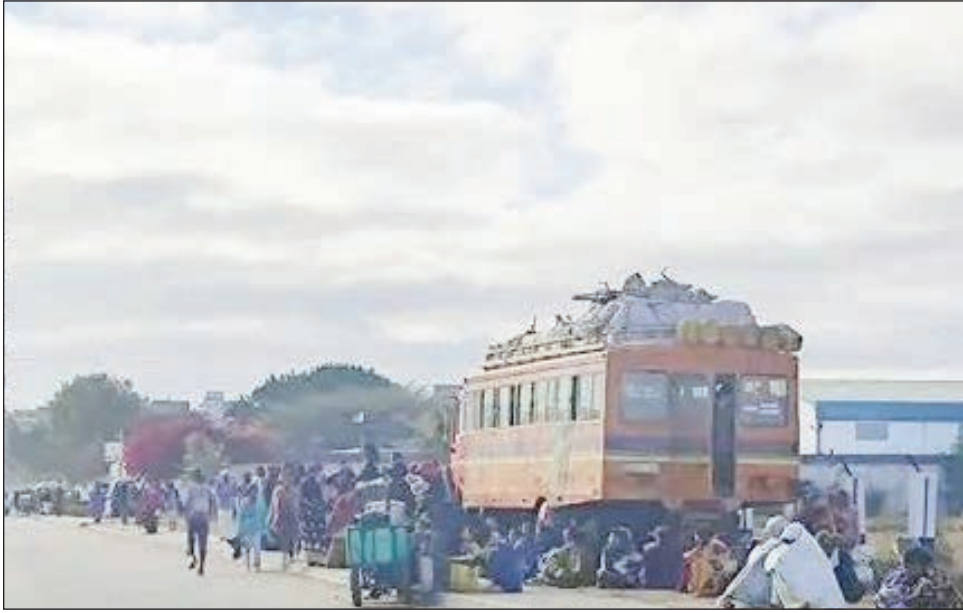
Ireo mpandeha tamin'ilay fiarabe, tsy hitan'izy ireo izay ho aleha.

Efa 3 andro izao, miaramiharitra eo ireo mpandeha. Matory eo, na andro na alina.