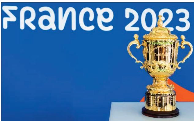
Coupe du monde de rugby.

Ny ekipam-pirenen'i Frantsa sy Nouvelle-Zélande, no hanokatra ny fifaninana fiadiana ny ho tompondaka eran-tany amin'ny Rugby à XV 2023 andiany faha-10, rahampitso zoma 8 septambra 2023 hanomboka amin'ny 01 ora sy 45 minitra frantsay. Ny 8 septambra ka hatramin'ny sabotsy 28 oktobra 2023 ho avy izao no hanatanterahana ity hetsika ity any France, ka ny « World Rugby » no mpikarakara azy. Marihana fa isaky ny 4 taona hatramin'ny taona 1997 no ha-