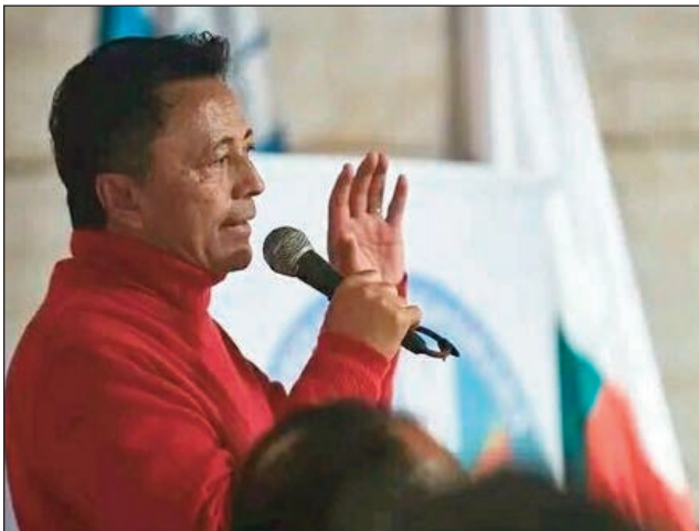
Ny Filoha Marc Ravalomanana, efa manana traikefa amin'ny fitantanam-pirenena.

Mandeha ny fananganana KMMR : Komity Manohana ny Filoha Marc Ravalomanana, amin'izao fotoana izao manerana ny Nosy. Tsy ho vitan'ny antoko Tiako i Madagasikara (TIM) irey ny ho fampandaniana ny filoha Marc Ravalomanana amin'ny fifidianana ho avy io, izay no mahatonga indray ny fananganana ny KMMR, vovonana hivondronan'ireo resy lahatra rehetra amin'ny filoha nasionalin'ny TIM, fa hany tokana tena ho afaka hanavotra ny firenena sy ny vahoaka Malagasy amin'izao krizy lalina mahazo azy izao. Ny KMMR dia tsy ny TIM ihany no ao anatin'ny, fa ao koa ireo fikambanana sy antoko politika hafa, ny avy amin'ny fiarahamo-