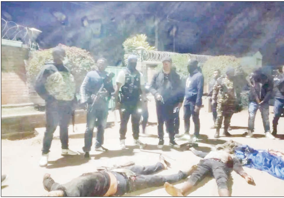
Ireo jiolahy 2 lavon'ny mpitandro filaminana.

Misy jiolahy iray voatitifitra teo amin'ny feny miafina