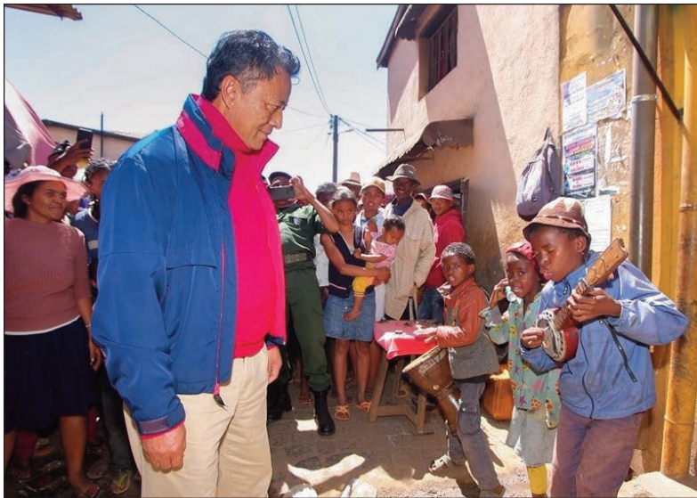
Ny filoha Marc Ravalomanana tany Imerintsiasosika omaly.

Nihaona sy nitafa mivantana tamin'ny vahoaka tany Talata Volonondry Antananarivo Avaradrano, sy tany Imerintsiasosika distrikan'Arivonimamo omaly sy afak'omaly ny filoha Marc Ravalomanana, filoha nasionalin'ny antoko TIM. Toy ny fanaony dia tany antena, no nisy izay fahaonana teo amin'ny tia sy ny manina izay. Nambarany tamin'izany fa : "amin'ny maha FIRENENA IRAY an' i MADAGASIKARA, dia homent-sika lanja manokana ny fananantsika KOLONTSAINA sy FOMBA NENTI-PAHARAZANA maro samihafa. Hirehareha amin'ny maha Malagasy antsika isika. Hitambatra ho iray ao anatin'ny firaisaknam-pirenena, ary hiasa miaraka mba hanatrarana ny tanjona apetraka." Ny talata teo, tany Talata Volonondry, nilaza ny filoha Marc Ravalomanana fa : " tsy maintsy atao izay hanampiana anareo TANTSAHA REHETRA manerana an'i Madagasikara, amin'ny fanamorana ny fahazoana ny ZEZIKA, ny MASOMBOLY, ny fanarenana sy fanamboarana LAKAN-DRANO izay manondraka ny tanimbary sy ny tanimboly, satria izany rehetra izany no miantoka ny FAMOKARANA ho an'i Madagasikara. Rehefa manana VOKATRA manana KALITAO ny MALAGASY dia tanteraka ireo VISION na vina ao amin'ny MAP PLUS dia ireto avy izany: ho lasa FIRENENA MI-