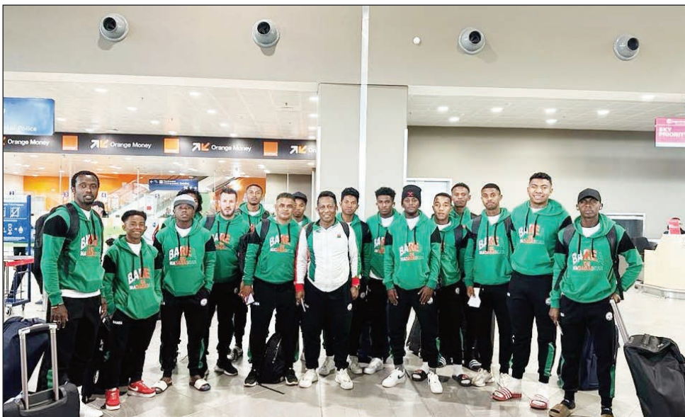
Barea septambra 2023.