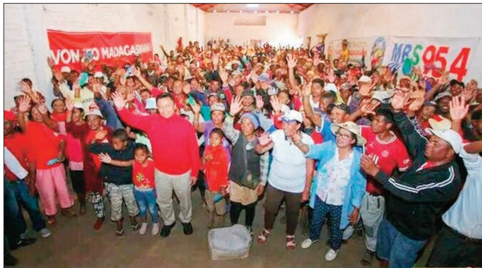
Tafatsangana ny biraon'ny FOktim ao amin'ny fokontany Ampisahanala ao Sambava Kaominina Urbaine faritra Sava.