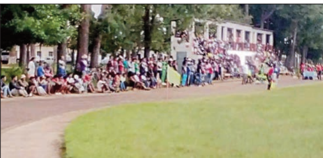
Ny Kianja Antsirabe.

Fantatra ireo iray vondrona amin'ny fifaninana baolina kitra « Ligue des Champions Malagasy – D2 National 2023 », dingana faharoa hotanterahina any Mahajanga sy Antsirabe amin'ny 15 hatramin'ny 24 septembre 2023 ho avy izao. Any Mahajanga : FC Zoya Boney, Kfca Diana, Espoir