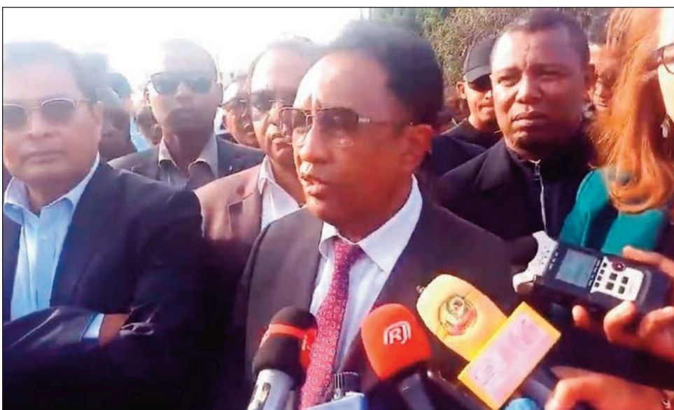
Ny sasany tamin'ireo mpitarika teny Mandrimena omaly.