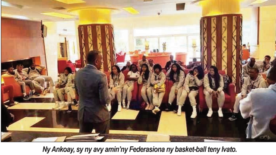
Ny Ankoay, sy ny avy amin'ny Federasiona ny basket-ball teny Ivato.

Notoloran'ny Federasiona Malagasy ny taranjampanatanjahantena basket-ball « primes » na tolotra lelavola avokoa ireo mpilalao amin'ny ekipam-pirenena Malagasy amin'ity taranja ity teo amin'ny sokajy rehetra, izay nahazo medaly volamena tamin'ny Lalao Nosy andiany faha-11 natao teto amintsika, nifarana ny alahady teo iny. Tratra ny tanjona hoan'ny Ankoay: Medaly volamena ho an'ireo sokajy rehetra : FIBA 3x3 Lahy sy Vavy, sy teo amin'ny Basketball 5x5 Lahy sy Vavy.