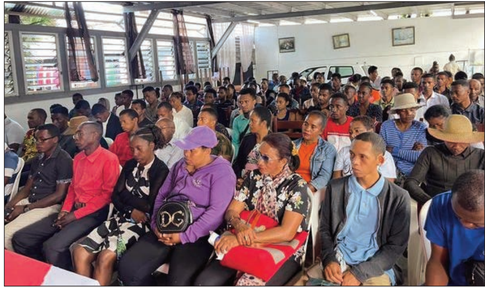
Ny hetsiky ny olom-pirenena : Madagasikara tsy entina vahiny, nosakanan'ny mpitandro filaminana, saika hatao tao amin'ny ISTS Mandrimena Antananarivo Atsimondrano.