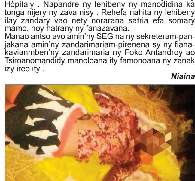
Ilay lehilahy, anisan'ny maty notifirin'ilay zandary.