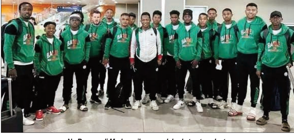
Ny Barea an'i Madagasikara ny alahady teo teny Ivato.