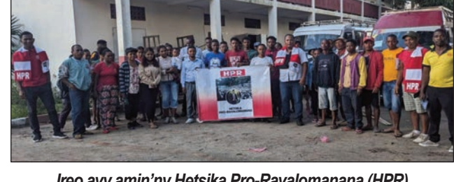
Ireo avy amin'ny Hetsika Pro-Ravalomanana (HPR) any Toamasina.