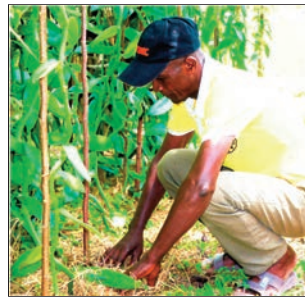
Tantsaha mpamboly lavanila any amin'ny faritra Sava.

M anampy ireo mpamokatra lavanila eto amintsika ny governemanta Amerikana. Nampiakatra 280 % ny varotra lavanila ireo mpamokatra tohanan'ny governemanta amerikana. Nanampy ireo mpamokatra lavanila any amin'ny faritra SAVA hampitombo ny fidiram-bolany, sy ny fidirana amin'ny tsenan'ny lavanila sady miaro ny tontolo iainana ny governemanta amerikana, tato anatin'ny 3 taona, tamin'ny alalan'ny Sampandraharaha Amerikana misahana ny Fampandrosoana Iraisampirenena (USAID). Varotra lavanila amin'ny kalitao tsara indrindra, izay nahatratra 4 tapitrisa dolara mahery no notohan'ny tetikasa - fitomboana 280% nandritra ny 3 taona - ary nanangona karbaona maherin'ny dimy tapitrisa taonina. Anisan'ny zava-bitan'ny tetikasa tena manan-danja ihany koa ny nahazoana mari-pankasitrahana Rainforest Alliance sy Grown For Good, ho an'ny tantsaha mpandray anjara maherin'ny 3.000.