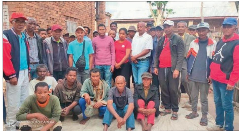
Ny nametrahana ireo mpitarika ny KMMR: Komity Manohana an'i Marc Ravalomanana N°05 amin'ny biletà tokana, ao amin'ny distrikan'Antananarivo Atsimondrano, tetsy amin'ny Magro Behoririka.