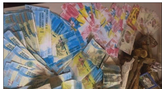
Ireo vola sandoka sarona tany Ambatolampy.