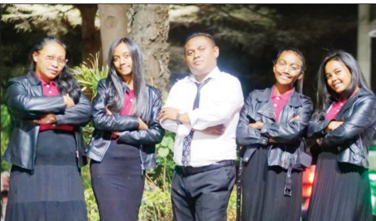
Ny Groupe Heritsaina ZJ.