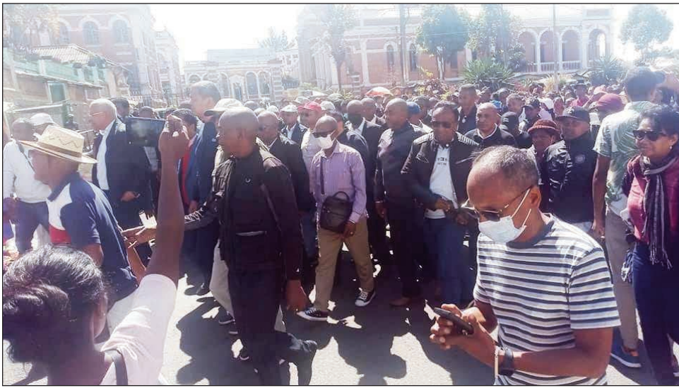
Ny hetsika an-dalambe notarihan'ireo kandida 11 teny Mahamasina omaly.

Nanao diabe nan-keny amin'ny Lapan'ny Fanatanjahantena sy ny Kolontsaina Mahamasina omaly, ireo vondron'ny kandida filohampirenena miisa 11, na tsy tafiditra aza izy ireo satria nosakanan'ny mpitandro filaminana, azo lazaina fa fahombiazana izany hetsika izany. Tsy nisy akory ny lalao handball tao amin'ity Lapan'ny Fanatanjahantena sy ny kolontsaina ity, fa fialana bala no nataon'ny tompon'andraikitra ny Tafita miandraikitra ity toerana ity. Olona marobe no nanao dia azy ireo teny antoerana. Rehefa tsy tafiditra tao Mahamasina izy ireo, niverina nihazo an' Ambohidahy sy Ambohijato, mbola tsy nisy eritreritra ny ho eny amin'ny kianjan'ny 13 mey aloha omaly io, fa raha ny fanambarana heno dia ny alatsinainy izao ny fotoana eny Analakely raha toa ka mbola avela hirotsaka ny kandida vazaha; raha toa ka tsy hovanina ny governemanta misy ankehitriny izay fitondram-panjakana mitanilapa; ary raha toa ka tsy nahatratra ny CES: Tribunal Manokana Hisahana ny Fifidianana. Rehefa tsy tanteraka ireo dia eny amin'ny kianjan'ny 13 mey ny rehetra amin'ny alatsinainy ho avy izao. Fa ankoatra izany, « tsy mahalala menatra, olona 11 dia atahorana », hoy