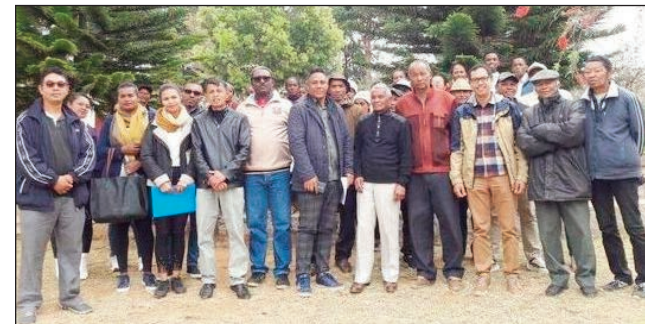
Ny nananganana ny KMMR tao amin'ny kaominina Anjeva Avaradrano.