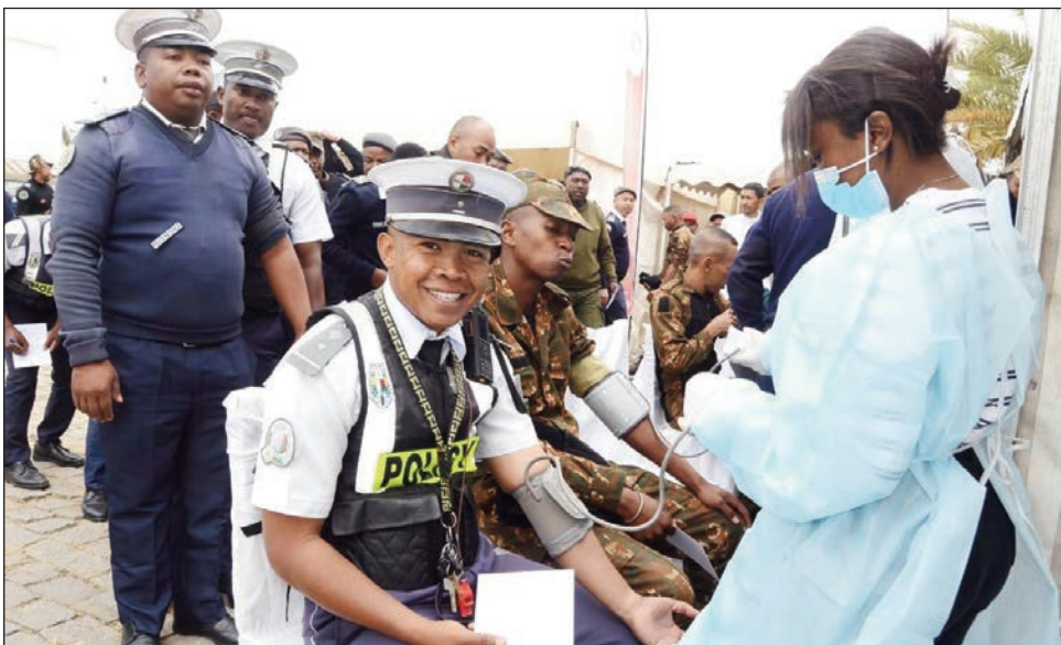
Polisy nanome rà tamin'ity herinandro ity.

Polisy miisa 700 no nanome rà maimaimpoana tamin'ity herinandro ity ao anatin'ny fankalazana ny faha-62 taonan'ny polisim-pirenena Malagasy. Izany no natao dia fanampiana ireo mpiara-belona mila izany. Toy ny mahazatra sy efa fanaon'ny Polisim-pirenena isan-taona ny fanomezana rà maimaim-poana ho an'ny Minisiteran'ny fahasalamana. Izany hetsika izany dia tafiditra ao anatin'ny fanamarihana ny faha-62 taonan'ny Polisim-pirenena ary mifanaraka indrindra amin'ny teny filamatry ny Minisiteran'ny filaminam-bahoaka dia ny "Polisy miaro sy manampy vahoaka".