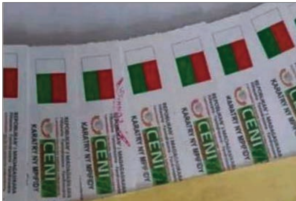
Kara-pifidianana navoakan'ny CENI.

Hita sy tsapa fa atosito-sika tokoa ny ondry botry hoy ny fitenenana mahita ireo manodidina an-dRajoelina, manao di-doha mafy hoy ny rehetra manohana azy amin'ny tsy rariny izay misy sy mitranga ho enti-miatrika ny fifidianana. Ny feo re dia milaza fa manahirana ny eny Mahamasina omy, sy ny fahitana ireo mpanohana an-dRajoelina tonga teny amin'ny Hotel Colbert, milaza fa mbola tsy fantatra ny ho avin'ny fifidianana ny 9 novambra ho avy izao. Olo-malaza efa nihinana sy nanahirana teto fahiny ireo omaly ireo, mbola mitsapa sao mba mahazo anjara raha tafaverina eo i Boaikely, nefa toa efa ho nofinofy izany sisa, rehefa nametra-pialana Rajoelina ny 9 septambra lasa teo, midika izany fa tsy ho tafaverina eo intsony ny tenany.