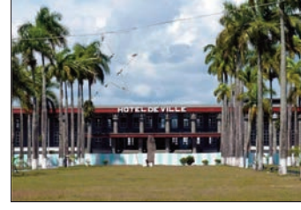
Ny toerana nanatanterahana ny hetsika.

Tsy diso anjara tamin'ny fanamarihana ofisialy ny andro eran-tanin'ny farmasiana ny tany Toamasina faritra Atsinanana. Nankalazaina ny 25 Septambra teo, tamin'ny alalan'ny fampirantiana nialohavan'ny diabe ny andro erantany ho an'ny farmasiana tany amin'ny renivohitry ny faritra Atsinanana. Nikarakara izao hetsika miavaka izao, izay natao nanoloana ny lapan'ny tanànan'i Toamasina, ny avy amin'ny holafitry ny farmasiana, ny fikambanana farmasiana, nahitana ireo farmasiana sy laboratoara ary nisy koa nandritra izany ny fitiliana, sy fizaham-pahasalamana maimaimpoana toy ny tamin'ny aretina diabetà, ny tosidrà. Nanampy azy ireo tamin'ny fanololana fanafady azo antoka, nisy niaraka tamin'izany ny fanontanianana sy fampahafantarana karazampanafody.