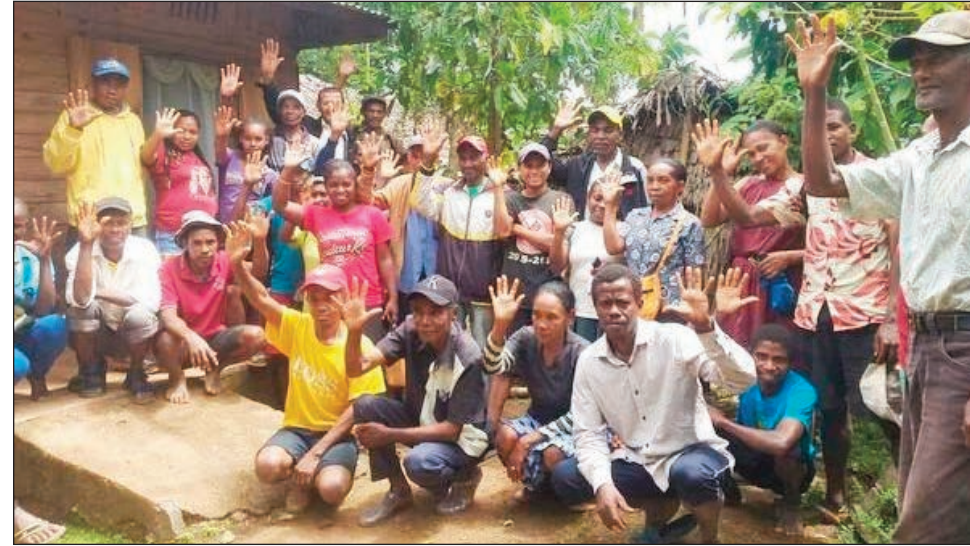
Fananganana ny biraon'ny KMMR natao ny alakamisy teo, tany amin'ny kaominina Anjeva distrikan'Antananarivo Avaradrano.