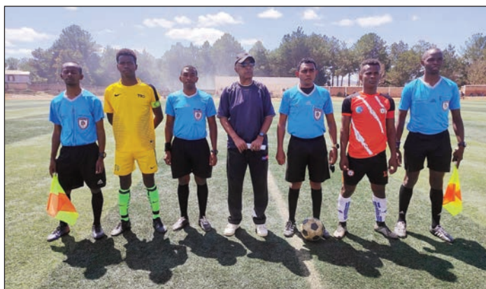
Fifanandrian'ny Fc JM Androy sy FC JSA Level Ihorombe.