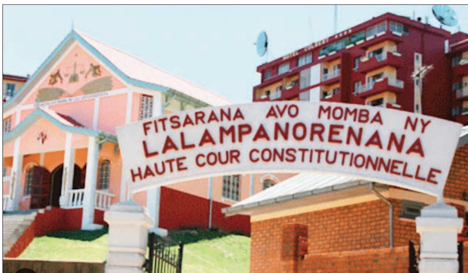
Ny HCC no hitan'ny maro ho fototry ny tsy fanarahan-dalàna eto amin'ny firenena.

Mbola adihevitra tokony hipetraka ihany ve ny maha tany tan-dalàna an'i Madagasikara amin'izao fotoana izao? Tsy efa iarahamahita sy miaina ve ny zava-misy? Fototry ny olana lehibe eto amin'ity firenena ity, ny tsy fampanjakana ny rariny sy ny hitsiny, sy ny fahalovana mahazo laka ary manampy trotraka ny tsy fifampitokisana. Mizotra mankany amin'ny fahasimbana sy fahapotohana ny lalan'ny firenena. Miha-mikorosy fahana ny toe-tsaina mandala ny firaisankina sy fihavanana, ary miha-simba hatrany ny fiaraha-monina. Izay sisa ve no niafaran'ilay firenena malagasy miditra amin'izao tapany voalohany amin'ny taonjato faha-21 izao? Ilay firenena manana maha izy azy ary tsy mena mitaha amin'ny hafa tany amin'ny vanim-potoana taloha tany toy ny tamin'ny fahampanjaka ny taonjato faha-18 sy 19.