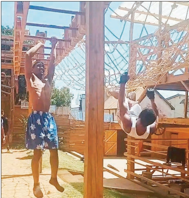
Ampahany amin'ireo fotodrafitrasa misy ao amin'ny « Mollos park ».

Tsy lavitra, etsy Ampandrana, ampitan'ny « Cafe gasy », no ahitana ny « Mollos park ». Toerana tony, madio rivotra nefa miorina afovoan'Antananarivo. Samy hita eny an-toerana avokoa ireo fitaovam-pikotranana sy fitaizam-batana ary fialamboly toy ny Baby foot, billard, boule, zumba fitness, « i chavire - vole » sns... Ny « Mollos park » irery ihany koa no manana ny fotodrafitrasa takiana amin'ny fanaovana ny « Ninja warrior » eto larivo. Toerana mety sy mendrika hanatanterahana fihaonana anivon-javaboahary toy ny fivoriam-pianakaviana, mpiaramiasa, mpianatra, ihany koa ny « Mollos park » etsy Ampandrana. Tsy ireo tanora ihany fa samy tsy misy diso anjara amin'ny fisian'ireo fotodrafitrasa eny an-toerana ny sokajin-taona rehetra, izay mahatsapa fa mila koloina mandrakariva amin'ny alalan'ny fialam-