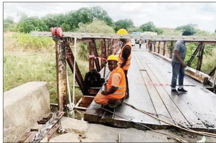
Fanamboarana tetezana amin'ny RN4.

Asiam-panamboarana amin'izao fotoana ny tetezan'i Mangapaika amin'ny lalampirenena faha-4 (RN4) iny. Am-perin'asa ny ao amin'ny Asa Vaventy amin'ny fanatsarana ny fifamoivoizana amin'ny lalam-pirenena faha-4 (RN4). Nasiam-panamboarana ny tetezan'i Mangapaika ao Antanambao - Andranolava PK 505+400 amin'ny RN4. Efa antitra ity tetezana ity ka nohavaozina. Ny famatsiambolan'ny Banky Iraisampirenena amin'ny alalan'ny tetikasa CERC, no anarenana an'izao foto-drafitr'asa izao ary ny orinasa ZHONGMEL no manao ny asa. Ho voahelingelina noho izany ny fifamoivoizana . Mampijaly ny mpampiasa azy ity lalana ity rehefa fotoam-pahavaratra. Nahiana mafy hitera-doza tamin'ny farany teo. Betsaka ny mpandeha mandalo sy mampiasa azy io, ka heverina hisy akony amin'ny ara-toekarena ny fahavitany, ezahana ho vita mia-lohan'ny fahavaratra ny asa, hoy ny tompon'andraikitra.