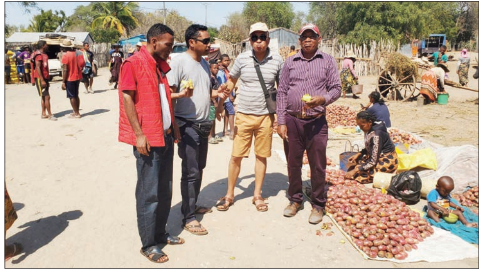
Ny tafa tamin'ny mpanao gazety nataon'ny filoham-piangonana ao amin'ny FFKM omy sy afak'omy, teny Ampandrana.