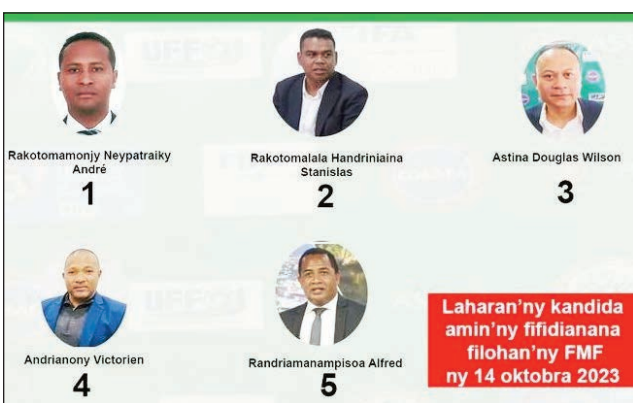
Laharan'ny kandida 5 ho amin'ny filohan'ny FMF.