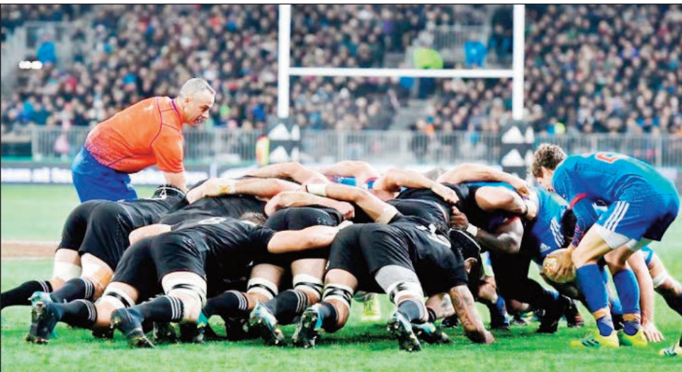
Mondial rugby France 2023.