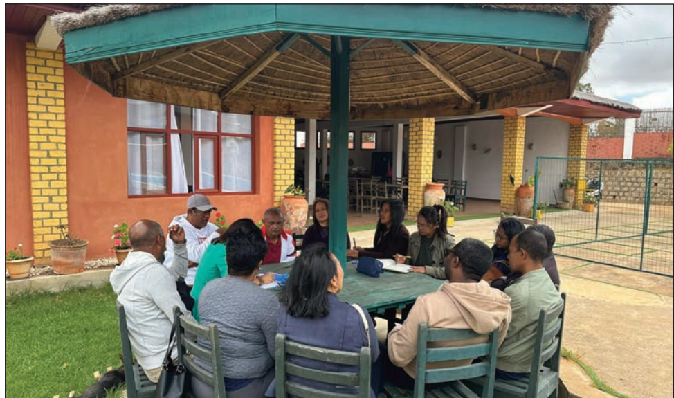
Ny fihaonan'ireo kandidà miisa 9 ho filohampirenena, tamin'ny iraka avy amin'ny Firenena Mikambana teny Andraharo omaly.