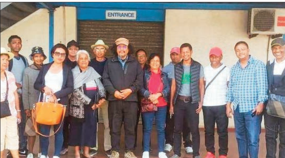
Fivorian'ny mpitarika ny KMMR Avaradrano teny Imerinkasinina ny sabotsy teo.

Ny fananganana ny birao mpitantana ny KMMR Boriboritany faha-3, tao amin'ny Magro Behoririka.