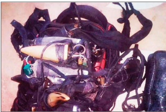
Fitaovana nampiasain'ireo dahalo maty voatitifitra.

Dahalo miisa 3 mpanakan-dalana, no lavon'ny fokonolona sy mpitandro filaminana tany amin'ny distrikan'i Tsiroanomandidy faritra Bongolava. Dahalo miisa 3 nikasa haka an-keriny ankizy nirava avy nianatra izy ireto, tao amin'ny tetezana antsoina hoe Manafoana, no nokarohin'ny miaramila tao amin'ny "Bataillon d'Infanterie" Tsiroanomandidy, taorian'ny antso nataon'ny fokonolona tao Ambohiby. Mbola nanakana lehilahy iray hafa koa ireto olon-dratsy ireto, saingy