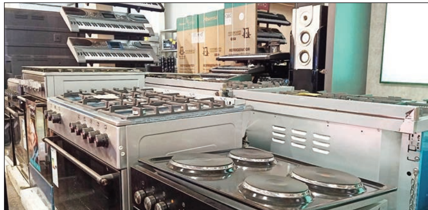
Entana maro samy hafa amin'ny Tranombarotra Baolai.