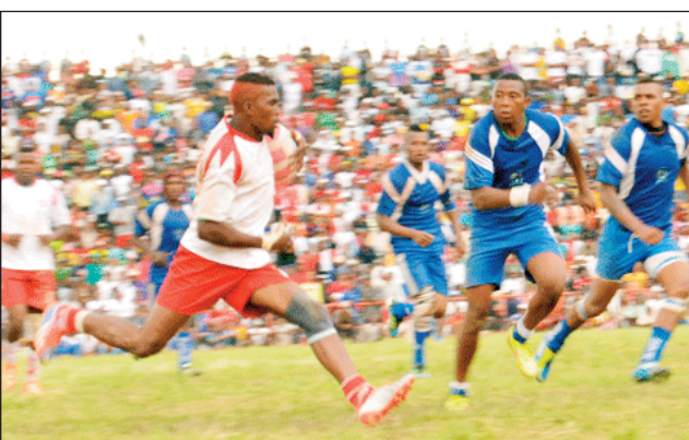
Lalao XXL Top 20, 2023.

Rehefa voatery naoto noho ny fiatrehana ny lalao'ny Nosy 2023 dia hotanterahina etsy amin'ny kianjan'i Makis Andohatapanaka, amin'ny alahady 01 oktobra 2023 ho avy izao, ireo lalao ankatoky ny famaranana ny fifinanana rugby « XXL Top 20, 2023 », izay hialohan'ny andro voalohan'ny fifinanana sokajy federaly 2 miisa roa. Fandaharan-dalao amin'io alahady