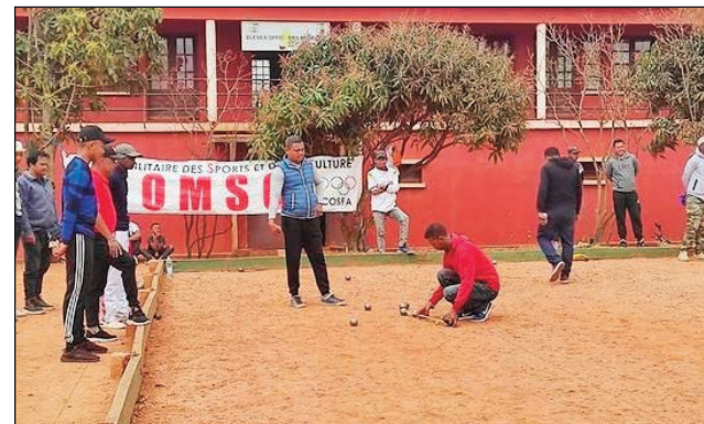
Lalao tsipy kanetibe, ao anatin'ny fankalazana ny faha-40 taonan'ny Cosfa.