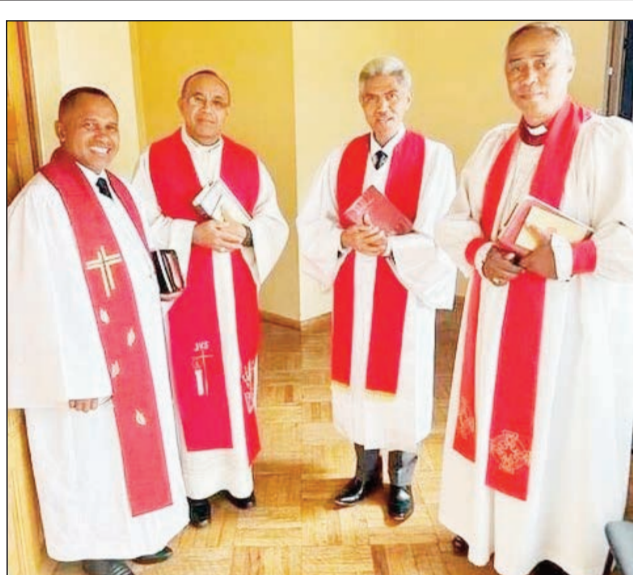
Ireo filoham-piangonana ao amin'ny FFKM, nitafa tamin'ny mpanao gazety.