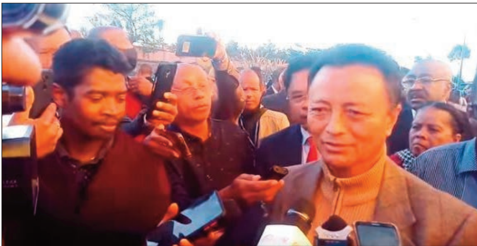
Ny filoha Marc Ravalomanana, teny amin'ny ISTS Mandrimena Antananarivo Atsimondrano.

Naneho ny heviny ny kandida Filoha Marc Ravalomanana nandritra ny famaranana ny fihaonambe nasionaly ny FFKM, mikasika ny fehinkevitra izay nivoaka nandritra ny fifampidinihana sy fifampihainoana teo amin'ny samy Malagasy, nandraisan'ireo mpanao politika sy fikambanana ary fiarahamonim-pirenena anjara teny Mandrimena Antananarivo Atsimondrano . Efa tamin'ny taona 2009 hoy ny Filoha Marc Ravalomanana no efa nolazaina ombieny ombieny raha mbola tany Afrika Atsimo aho ny resaka dialogue na ny fifampiresahana hoe ianareo samy Malagasy aoka hifampihaino , izao isika hoy izy efa taona 2023 dia mbola ventesina ihany izany . Isika angamba hoy izy tsy manana sofina mi-haino na manao tsinontsi-