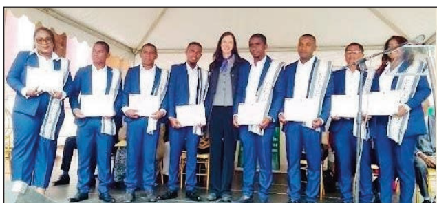
Manam-pahaizana momba ny areti-mifindra vao nahavita fiofanana.