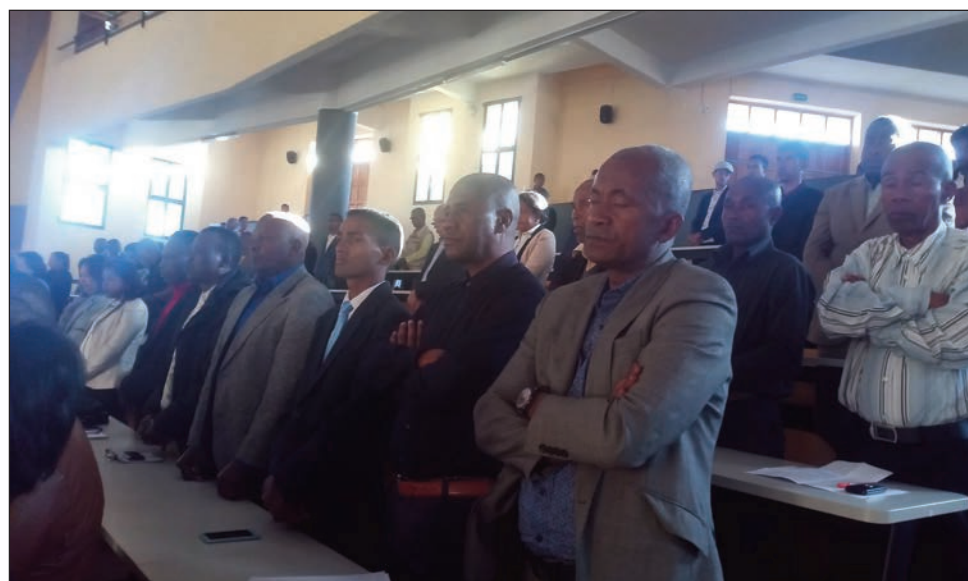
Nisy ny fihaonana teo amin'ny COMTIM, DISTIM Boriboritany faha-5 sy ny biraon'ny Foko-TIM isam-pokontany. Nitarika ny fotoana ny depiote Fetra Ralambozafimbololona. Ny votoatin'ny fivoriana dia ho fiomanana amin'ny fifidianana sy fananganana ny KMMR ao amin'ny distrika Antananarivo V.