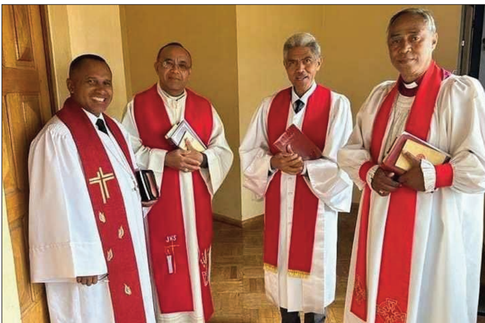
Ireo filoham-piangonana ao amin'ny FFKM.

Nivoaka ny alakamisy teo ny fehin-kevitra mahakasika ny fihaonambe nasionaly nataon'ny FFKM : Fiombonan'ny Fiangonana Kristiana eto Madagasikara, natao tao amin'ny ISTS Mandrimena Andoharanofotsy Antananarivo Atsimondrano : voalaza fa mila fihaonana maika eto amin'ny firenena handravonana ny zava-misy mialoha ny hanatanterahana ny fifidianana. Ankoatra izany, tao anatin'izao fihaonambe nasionaly FFKM izao koa no nifampihainoana momba ny fiainam-pirenena. Tonga nandray anjara tamin'izany ireo ankolafinkery samihafa. Teo ny tolokevitra samihafa momba ny fanarenana ny fiainam-pirenena, andaniny. Etsy ankilany, voaresaka manokana ny momba ny fifidianana: teo ireo vonona ny hiroso avy hatrany amin'izany ; teo ireo nihevitra fa tsy fifidianana mihihity no hifampandroso an'i Madagasikara. Misy ireo resy lahatra, fa ilaina ny fifidianana sain-