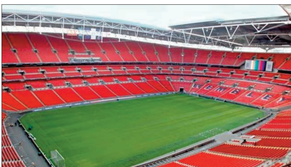
Ny kianja Wembley Stadium any Londres, hanaovana ny lalao famaranan'ny UEFA Champion's League.

Vita afak'omaly hariva, tany Monaco ny antsapaky ny lalao isam-bondron'ny UEFA Champions League 2023-2024, fiadiana ny ho tompon-dakan'i Eoropa eo amin'ny isan-tarika baolina kitra.