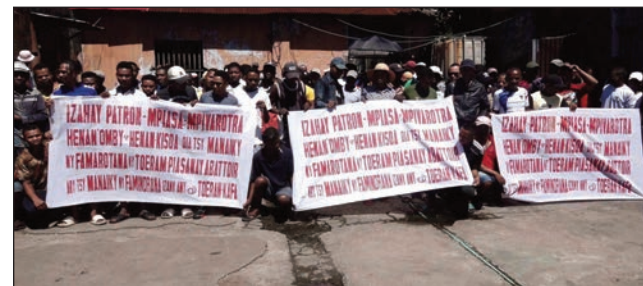
Ny fitokonana ireo mpikirakira ny resaka hena any Toamasina.