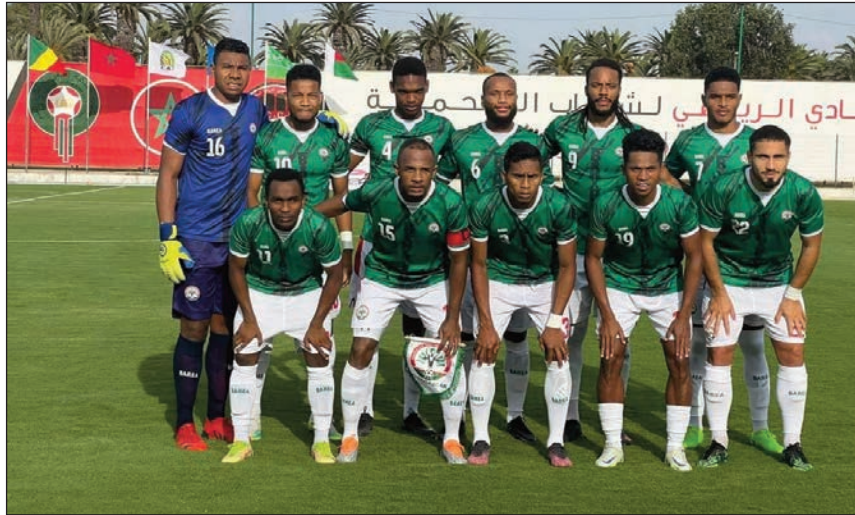
Ny Barea an'i Madagasikara 2023.