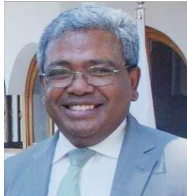
Ny Praministra Tantely Andrianarivo fahavelony.