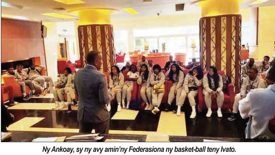
Ny Ankoay, sy ny avy amin'ny Federasiona ny basket-ball teny Ivato.

Notoloran'ny Federasiona Malagasy ny taranjampanatanjahantena basket-ball « primes » na tolotra lelavola avokoa ireo mpilalao amin'ny ekipam-pirenena Malagasy amin'ity taranja ity teo amin'ny sokajy rehetra, izay nahazo medaly volamena tamin'ny Lalao Nosy andiany faha-11 natao teto amintsika, nifarana ny alahady teo iny. Tratra ny tanjona hoan'ny Ankoay: Medaly volamena ho an'ireo sokajy rehetra : FIBA 3x3 Lahy sy Vavy, sy teo amin'ny Basketball 5x5 Lahy sy Vavy.