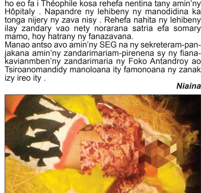
Ilay lehilahy, anisan'ny maty notifirin'ilay zandary.