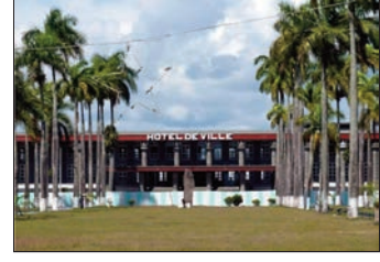
Ny toerana nanatanterahana ny hetsika.

Tsy diso anjara tamin'ny fanamarihana ofisialy ny andro eran-tanin'ny farmasiana ny tany Toamasina faritra Atsinanana. Nankalazaina ny 25 Septambra teo, tamin'ny alalan'ny fampirantiana nialohavan'ny diabe ny andro erantany ho an'ny farmasiana tany amin'ny renivohitry ny faritra Atsinanana. Nikarakara izao hetsika miavaka izao, izay natao nanoloana ny lapan'ny tanànan'i Toamasina, ny avy amin'ny holafitry ny farmasiana, ny fikambanana farmasiana, nahitana ireo farmasiana sy laboratoara ary nisy koa nandritra izany ny fitiliana, sy fizaham-pahasalamana maimaimpoana toy ny tamin'ny aretina diabetia, ny tosidrà. Nanampy azy ireo tamin'ny fanolor fanafody azo antoka, nisy niaraka tamin'izany ny fanontaniana sy fampahafantarana karazampanafody.