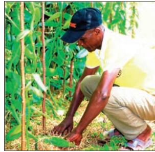
Tantsaha mpamboly lavanila any amin'ny faritra Sava.

M anampy ireo mpamokatra lavanila eto amintsika ny governemanta Amerikana. Nampiakatra 280 % ny varotra lavanila ireo mpamokatra tohanan'ny governemanta amerikana. Nanampy ireo mpamokatra lavanila any amin'ny faritra SAVA hampitombo ny fidiram-bolany, sy ny fidirana amin'ny tsenan'ny lavanila sady miaro ny tontolo iainana ny governemanta amerikana, tato anatin'ny 3 taona, tamin'ny alalan'ny Sampandraharaha Amerikana misahana ny Fampandrosoana Iraisampirenena (USAID). Varotra lavanila amin'ny kalitao tsara indrindra, izay nahatratra 4 tapitrisa dolara mahery no notohan'ny tetikasa - fitomboana 280% nandritra ny 3 taona - ary nanangona karbaona maherin'ny dimy tapitrisa taonina. Anisan'ny zava-bitan'ny tetikasa tena manan-danja ihany koa ny nahazoana mari-pankasitrahana Rainforest Alliance sy Grown For Good, ho an'ny tantsaha mpandray anjara maherin'ny 3.000.