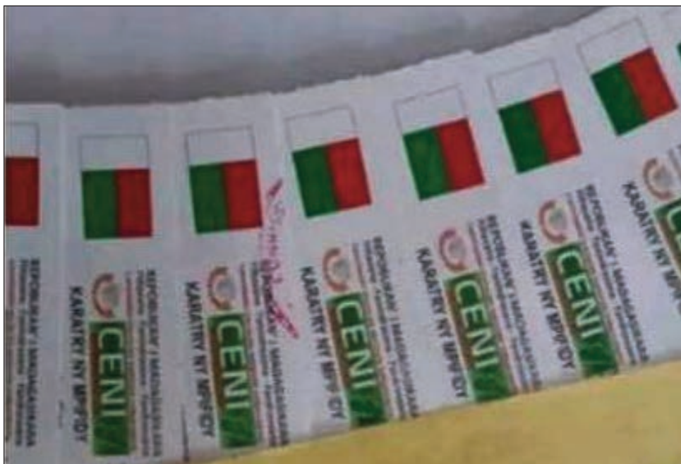
Kara-pifidianana navoakan'ny CENI.

Hita sy tsapa fa atosito-sika tokoa ny ondry botry hoy ny fitenenana mahita ireo manodidina an-dRajoelina, manao di-doha mafy hoy ny rehetra manohana azy amin'ny tsy rariny izay misy sy mitranga ho enti-miatrika ny fifidianana. Ny feo re dia milaza fa manahirana ny eny Mahamasina omy, sy ny fahitana ireo mpanohana an-dRajoelina tonga teny amin'ny Hotel Colbert, milaza fa mbola tsy fantatra ny ho avin'ny fifidianana ny 9 novambra ho avy izao. Olo-malaza efa nihinana sy nanahirana teto fahiny ireo omaly ireo, mbola mitsapa sao mba mahazo anjara raha tafaverina eo i Boaikely, nefa toa efa ho nofinofy izany sisa, rehefa nametra-pialana Rajoelina ny 9 septambra lasa teo, midika izany fa tsy ho tafaverina eo intsony ny tenany.