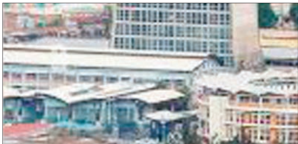
Ny foiben-toeran'ny Banky Iraisam-pirenena eto Madagasikara, etsy Anosy.