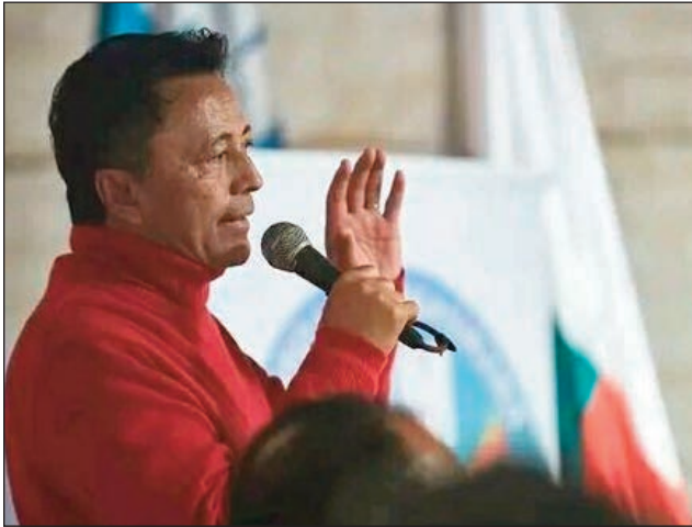
Ny Filoha Marc Ravalomanana, efa manana traikefa amin'ny fitantanam-pirenena.

Mandeha ny fananganana KMMR : Komity Manohana ny Filoha Marc Ravalomanana, amin'izao fotoana izao manerana ny Nosy. Tsy ho vitan'ny antoko Tiako i Madagasikara (TIM) irey ny ho fampandaniana ny filoha Marc Ravalomanana amin'ny fifidianana ho avy io, izay no mahatonga indray ny fananganana ny KMMR, vovonana hivondronan'ireo resy lahatra rehetra amin'ny filoha nasionalin'ny TIM, fa hany tokana tena ho afaka hanavotra ny firenena sy ny vahoaka Malagasy amin'izao krizy lalina mahazo azy izao. Ny KMMR dia tsy ny TIM ihany no ao anatin'ny, fa ao koa ireo fikambanana sy antoko politika hafa, ny avy amin'ny fiarahamo-