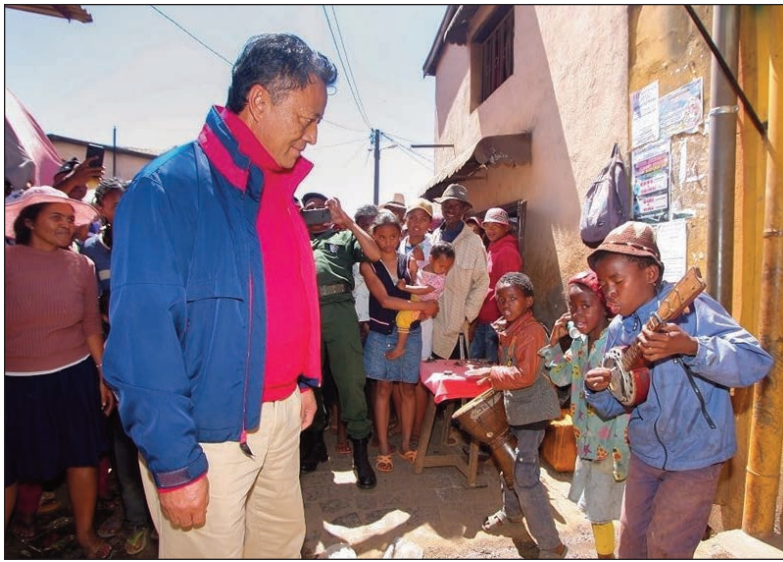
Ny filoha Marc Ravalomanana tany Imerintsiasosika omaly.

Nihaona sy nitafa mivantana tamin'ny vahoaka tany Talata Volonondry Antananarivo Avaradrano, sy tany Imerintsiasosika distrikan'Arivonimamo omaly sy afak'omaly ny filoha Marc Ravalomanana, filoha nasionalin'ny antoko TIM. Toy ny fanaony dia tany antena, no nisy izay fihaonana teo amin'ny tia sy ny manina izay. Nambarany tamin'izany fa : "amin'ny maha FIRENENA IRAY an' i MADAGASIKARA, dia homentisika lanja manokana ny fananantsika KOLONTSAINA sy FOMBA NENTI-PAHARAZANA maro samihafa. Hirehareha amin'ny maha Malagasy antsika isika. Hitambatra ho iray ao anatin'ny firaisaknam-pirenena, ary hiasa miaraka mba hanatrarana ny tanjona apetraka." Ny talata teo, tany Talata Volonondry, nilaza ny filoha Marc Ravalomanana fa : " tsy maintsy atao izay hanampiana anareo TANTSAHA REHETRA manerana an'i Madagasikara, amin'ny fanamorana ny fahazoana ny ZEZIKA, ny MASOMBOLY, ny fanarenana sy fanamboarana LAKAN-DRANO izay manondraka ny tanimbary sy ny tanimboly, satria izany rehetra izany no miantoka ny FAMOKARANA ho an'i Madagasikara. Rehefa manana VOKATRA manana KALITAO ny MALAGASY dia tanteraka ireo VISION na vina ao amin'ny MAP PLUS dia ireto avy izany: ho lasa FIRENENA MI-