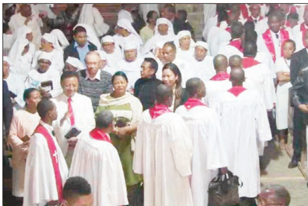
Ny filoha Marc Ravalomanana, nandritra ny fotoam-bavaka lehibe tany Ankaramalaza omaly.

Tontosa omaly 2 aogositra 2023 ny famaranana ny isantaona faha 82 ny Fifohazana ao amin'ny toby lehibe Ankaramalaza any amin'ny faritra Fitovinany iny. Vory lanona ireo mpino avy amin'ny Fiangonana Loterana Malagasy (FLM) manerana an'i Madagasikara, niaraka amin'ireo vahiny maro be tonga nanatrika ny fotoam-pifohazana tany antoerana, na kristiana tsy avy amin'ny FLM koa aza. Nandritra ny fotoambavaka lehibe dia miisa 435 ireo notokanana ho mpiandry. Ny tenin'ny soratra masina nanompnana ny fotoana dia ny Romana 4 : 7 " sambatra