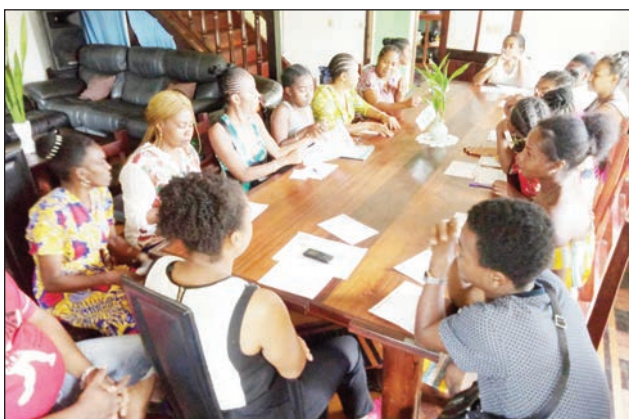
Ny fivorian'ireo mpitarika Vehivavy TIM tany Antalaha faritra Sava.

Ravalomanana ihany no anisan'ny manana traikefa amin'izay fitantanampirenena, mijery ny mahaso ny vahoaka aloha, izay vao mety ny mahafinaritra azy, fa tsy ny mifanohitra amin'izay. Hiparitaka, hanabe voho ny vehivavy TIM any amin'ny kaominina isanisany, misy azy avy avy eo, ireo mpitantana ny vehivavy TIM any amin'ny faritra, renivolitra eran-tanin'ny lavanila iny.