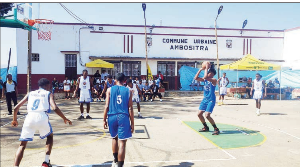
Basikety U18 any Ambositra.