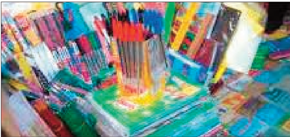
Na fotoam-pialan-tsasatra aza izao, efa manomana ny fitaovam-pianaran'ny mpianatra, amin'ny fidirana manaraka ny ray aman-dreny.

Vao nifarana tsy ela ny fotoam-pianarana ary miditra amin'ny fialan-tsasatra lehibe ny mpianatra, izay volana vitsy monja ihany, dia efa matrika fahasahiranana hatrany ireo ray aman-dreny. Ny volana jona no nifarana ny taom-pianarana ho an'ny sasany, ny hafa toa ireo niatrika fanadinam-panjakana samihafa dia ny volana jolay vao niàla sasatra. Misy fandania be dia be ho an'ireo ray aman-dreny izany mandra-pifaran'ny taom-pianarana. Kanefa ihany koa vao vita izany, dia atrehin'izy ireo sahadry ny ho amin'ny fampidirana ireo zanany hianatra amin'ny taom-pianarana manaraka. Efa hita anoloan'ireo sekoly samihafa na eny amin'ireo peta-drindrina napetrak'ireo sekoly, ny tsy miankina no tena manao izay, ny fiso-kafan'ny biraony sy ny fanaovana ny fisoratana