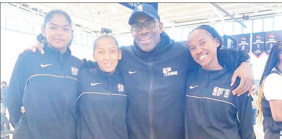
Izy telo vavy tany Johannesburg.

ders Africa », ka tany Johannesburg no nanatan-