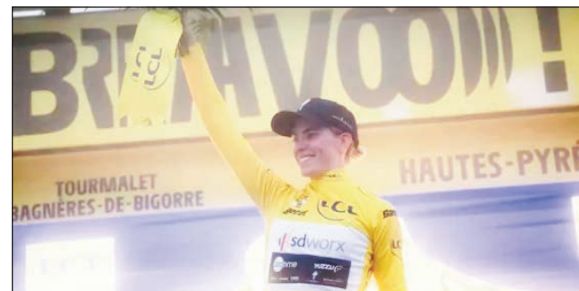
Ilay Néerlandaise Demi Vollering.