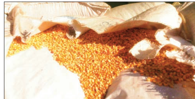
Katsaka novolena antsokosoko tao amin'ny faritra arovana Menabe Antimena, hatao ho sakafon'ny voafonja.