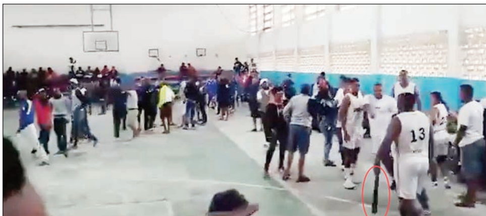
Ilay nitondra kibay teny an-kianja.