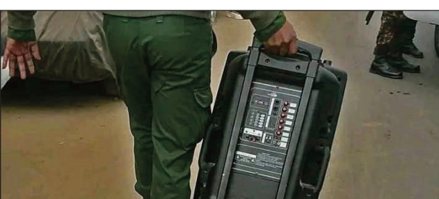
Ilay fanamafisampeo nalain'ny mpitandro filaminana teny Ankatso.