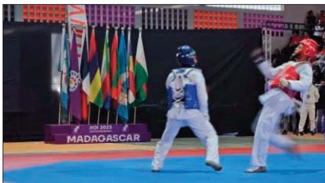
Fifaninana Taekwondo tetsy amin'ny Kianja Mitafon'i Mahamasina.

Raha noheverina ho nisiana hetsika goavana mbola tsy nampiseho ampahibemaso teto Madagasikara, tamin'ny nanaovana ny hetsika ara-teknolojika vaovao ilay fanokafana ny Lalaon'ny Nosy andiany faha-11 notanterahina andro alin'ny zoma 25 agositra 2023 tetsy amin'ny kianjan'i Mahamasina dia ny loza vokatra ny fifanosehana teo am-bavahady fidirana an'ity kianja ity ka nahafatesana olona nahatratra 12 hoan'ny isa ofisialy navoakan'ny HJRA, mba tsy ilazana ny isa 13 navoakan'ny fampahalalam-baovao hafa hatrany ivelany any sy naharatra onona maherin'ny 80 isa tany ho any ihany koa, no nisongadina mialoha tamin'ity lanonam-panokafana ity. Teo amin'ny andro voalohan'ny fifaninana-panokafana io dia efa nitarika vonjimaika teo amin'ny fahazoana medaly volamena ny Malagasy, izay efa nahazo medaly volamena niisa 21 sahadany tamin'io andro io ary nahatratra medaly 37 ny fitambaran'izany