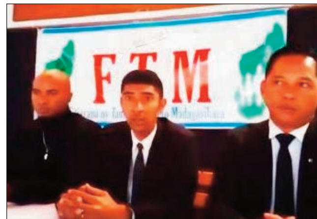
Ireo mpitarika ny antoko FTM.