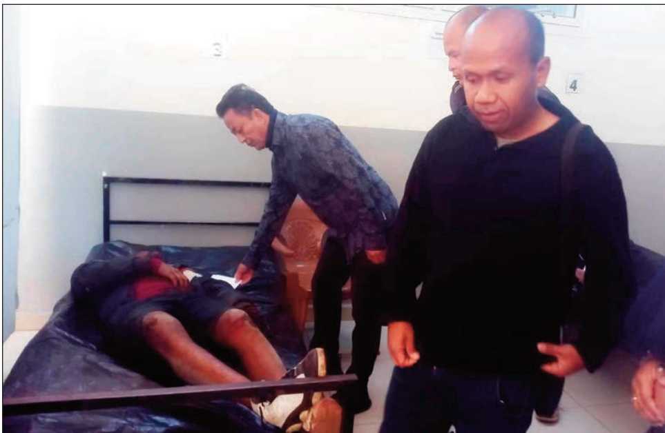
Ny filoha Marc Ravalomanana tetsy amin'ny Hopitaly HJRA ny sabotsy maraina teo.

Vokatry ny fifanosehana tao amin'ny fidirana ny kianja Barea Mahamasina ny zoma teo, ka nahafatesana olona 13 ary naharatra olona hatramin'ny 80, tsy nanadino ireo niharam-boina ny filoha Marc Ravalomanana, filoha nasionalin'ny antoko Tiako i Madagasikara TIM. Vao nandre ny loza izy sy ny mpiara-miasa aminy akaiky dia nidodododo nijery ireo niharam-boina sy ny fianakaviany tao amin'ny Hopitaly HJRA Ampefiloha ny sabotsy vao maraina lasa teo. Nampahery sy nitondra izay voatsiramin'ny tanana ho an'ny fianakavian'ireo niharam-boina izy nandritra izany, nankahery sy nitondra solondranomboankazo ary nividy fanafody ihany koa ho an'ireo marary mbola notsaboina tao. Amin'ny maha ray aman-dreny