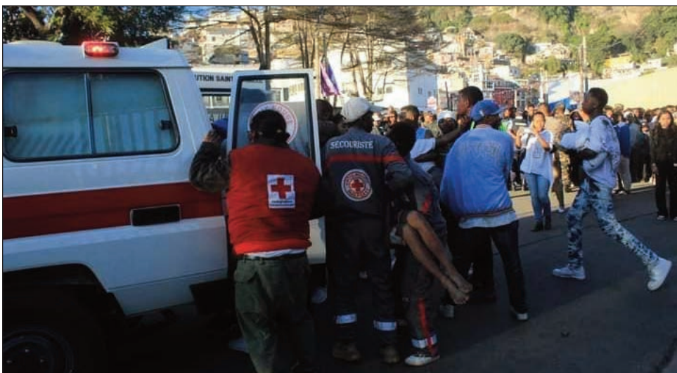
Vokatry ny fifanosehana teny Mahamasina ny zoma teo.

Maro amin'ny va-hoaka mpiara-mo-nina raha ny fana-dihadiana nataon'ny mpanao gazety no nilaza, fa "Fihantsiana na provocation" mihitsy no kendra-ny mpitondra fanjaka sy ny manodidina azy ireo atao amin'izao fotoana, satria efa mba samy manaja ireo vahiny marobe tonga eto mandray anjara sy manatrika ny Lalaon'ny Nosy ny rehetra, sy ireo mpizahatany manao vakansy eto ireo ny maro ankehitriny, nefa dia mbola ketrehina ho amin'ny korontana foana ve hoy ireo izay n-nipity feo tamin'ny gazety, ireny tranga teny Ankatso nataon'ny mpitandro filaminana tamin'ny mpianatra ireny. Ny sehon-javatra teny amin'ny Bypass, ary indrindra ny fifanosehana teo Mahamasina tamin'ny zoma ireny miampy ny grevy izay mitranga ao amin'ny Antenimierandoholona ao, momba ny karaman'ireo mpiasa, izay tsorina fa fahafaham-baraka goavana eo ima-som-bahiny sy ny maneran-tany mihitsy, dia isan'izay fihantsiana ataon'ny mpitondra amin'ny hisian'ny savorovoro izay. Ny mpitandro filaminana hoy ireo mpanohana mpilalao avy any ivelany sen-