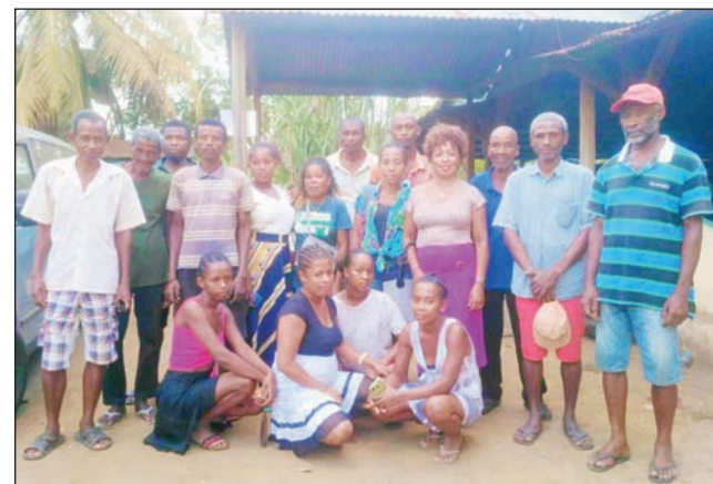
Ny vehivavy sy ny tanora ary ny mpitarika TIM Nosy-Be, tany Dzamandzary.