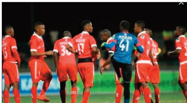
Gaborone United Sc Botswana.

Tapitra hatreo indray ny dian'ny solontena Malagasy, Elgeco Plus, amin'ny fiatrehana ny fifaninana baolina kitra Afrikana "Coupe de la Confédération de la CAF 2023", fa lavon'ny ekipan'i Gaborone United Sc Botswanais tamin'ny isa 3-1 tetsy amin'ny kianjan'i Mahamasina, teo amin'ny lalao mive-