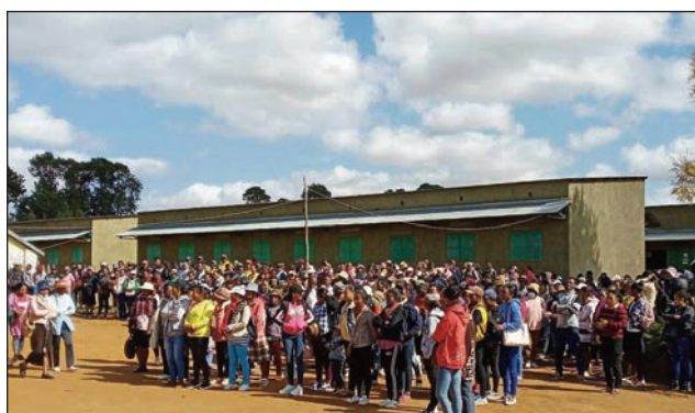
Ireo mpampianatra tonga tany Andranomanbelatra, nefa nody maina.