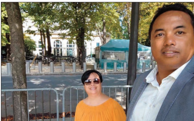
Ny solontenan'ireo avy amin'ny Collectif des Citoyens Malagasy Monde, avy nanatitra taratasy tao amin'ny lapan'ny filoha Frantsay tany Paris.

Nandefa taratasy misokatra amin'ny filoha Frantsay Emmanuel Macron, ny Collectif des Citoyens Malagasy, momba ny raharaha Romy Voos izay voasambotra tany Londres :