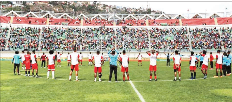
Barea Jeux des Iles, nandray tso-drano tetsy Mahamasina.