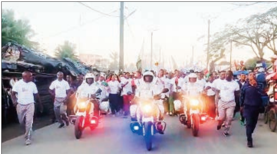
Afon'ny Lalao nandalo tany Toamasina.

Noraisina teto Antananarivo omaly indray ny afon'ny Lalaon'ny Nosy. Nafana ihany koa ny fandraisana izany teto an-drenivohitra, izay toerana hanatanterahana ny hetsika rehetra manodidina ny Lalaon'ny Nosy 2023. Ilay Afon'ny Lalaon'ny Nosy izay efa nampandalovina tany amin'ireo renivohi-paritany 5 eto Madagasikara ka ny Faritanin'i Toamasina no nandray azy farany tamin'ny alahady 20 aogositra 2023 teo. Tahaka ny niseho tany amin'ireo renivohi-paritany hafa rehetra dia tao anatin'ny hafaliana sy lanonana tsy nanam-paharoa ihany koa no nandraisan'i Toamasina an'ity Afo ity tamin'io