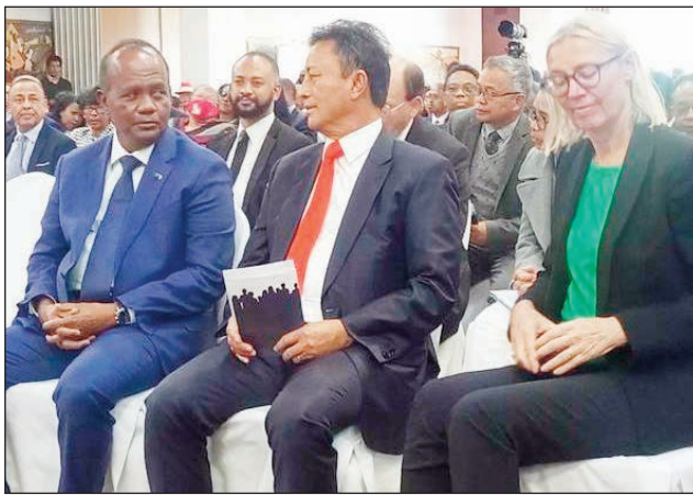
Ny filoha Marc Ravalomanana tetsy amin'ny Hotel Carlton omaly.