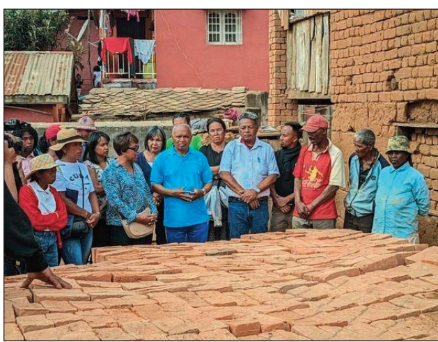
Ny asa sosialy nataon'ny TIM Talatamaty ny faran'ny herinandro teo.

Mitohy hatrany ny asa sosialy ataon'ny TIM Talatamaty ao amin'ny distrikan'Ambohidratrimo. Nanao asa tao amin'ny fokontany ANKADIVORY ny antoko Tiako i Madagasikara ao Talatamaty ny faran'ny herinandro teo. Nanolotra fitaovana maro hananganan'ireo fianakavina traboina ny trano fonenany noho ny voina nahazo azy ny antoko. Potika nianjera tsy nisy noraisina ilay tranon'ireo olona traboina. Mifanohana hatrany ny Tim Talatamaty ary tsy diso anjara amin'izany ireo vahoaka madinika izay tena tsy misy mpiahy ao amin'ity kaominina ity. Nanampy ny TIM Talatamaty tamin'izao hetsika izao ny Diaspora, izay nosoloin-dRamatoa Sylvie Razafintsalama tena.