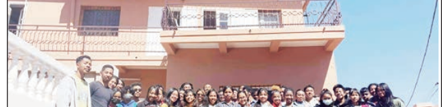
Mpianatra sy mpanabe, ao amin'ny Makoto School Analamahitsy.

Ny hampiaradana hatrany ny lafiny fanabeazana sy ny fampianarana, ahafahana mamolavola taranaka malagasy « vano-na » ho afaka miatrika ny hoaviny hamiratra tsy anatin'ny tahotra sy ahiahy, noho izy ireo efa mahalala ny andraikitra sy ny adidy miandry azy. Io no antom-pisian'ny « Makoto school », miorina etsy Analamahitsy (Ampitan'ny Supermaki).