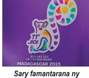
Sary famantarana ny Lalaon'ny Nosy 2023.

Ho tanterahina rahampitso zoma 25 Aogositra 2023, etsy amin'ny kianjan'i Mahamasina hanomboka amin'ny 5 ora hariva ny lanonam-panokafana amin'ny fomba ofisialy ny Lalaon'ny Nosy andiany faha 11 izay hatao ny 25 ka hatramin'ny 03 Septambra 2023 izao eto Madagasikara. Nisy ny fanambarana avy amin'ny tompon'andraikitra hetsika mikasika an'izany manao hoe : « Asehontsika ho hitan'ireo firenen-drehetra ny firaisankina, ny firaisam-po ary ny fihavanana Malagasy. An-kafaliana no andeha handraisantsika izany koa manasa antsika rehetra hanatrika ny lanonam-panokafana. Ho porofontsika hatrany fa iray ny Malagasy. 'Fandresena anaty firaisankina sy fahasamihafana' ». Raha ny hita sy tsikaritra aloha hatreto, ho latsa-danja noho ny efa natao teto amintsika ity Lalaon'ny Nosy amin'ity indray mitoraka ity. Ny Village des Jeux, na ny tanànan'ny lalao, hahafahan'ireo tanora aty amin'ny faritry ny Ranomasim-be Indiana tena hifanerasera akaiky aza tsy misy, fa dia samy any amin'ny Hotel misy azy ireo mpandray anjara.