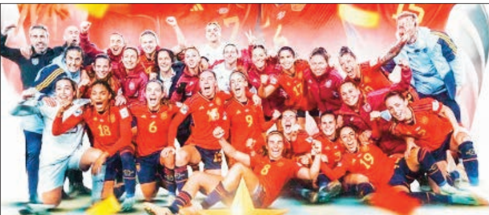
Ny Roja vehivavy espaniola, tompon'ny amboara eran-tany amin'ny baolina kitra 2023.

izay natao tao amin'ny kianja "Stade National de Sydney" tamin'ny alahady 20 aogositra 2023 lasa