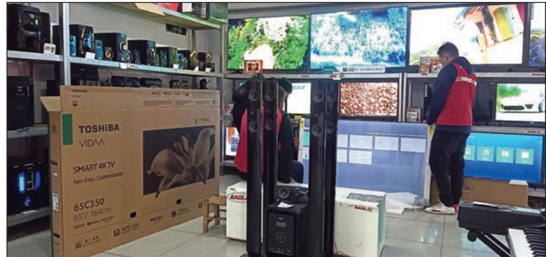
Entana, anisan'ny hiaka farany amin'ny Tranombarotra Baolai.

Rehefa manakaiky toy izao ny volana Septambra dia, tsy vitsy ireo izay te hanavao ny ao an-tokantrano ao. Hanampy betsaka amin'izany ny entana loha-laharana amin'ny kalitao izay hita ao amin'ny Tranombarotra « Baolai » etsy Analakely, Soarano sy Bazar - be Toamasina. « Mbola mitohy ilay fihenambidy goavambe amin'ireo Smart Tv sy Télé Led ato aminay, misy manomboka 32 hatramin'ny 85 pouces ary ny laser tv 100" (misy antoka 1 taona), izany dia mandrapaha-tapitra ny staoky » hoy hatrany ny tompon' andraikitra. Mbola vao nahatonga entana maro amin'ny vidiny mirary izy ireo toa ny fahita lavitra fisaka marika « Toshiba », izay ahitana manomboka 32 hatramin'ny 75", ny panneaux solaires mono sy polychristallins : izay ilaina tokoa amin'izao fotoana izao, four à gaz sy elektrika, Laser Tv 120" (misy antoka 12 volana), climatiseur, machine à laver transparent, synthétiseur, table de mixage, mini radio baffle bluetooth solaire, machine à café à capsule, subwoofer congélateur (mitazona hatsiaka 135 ora aorinan'ny delestazy). Ny fanazavana fanampiny, dia ho azo ao amin'ny site web » sy ny pejy fb: baolai ary ao amin'ny 033 37 188 88 (amin'ny ora fiasana). Dia hahafinaritra tokoa ny andavanandron'ny besinimaro miaraka amin'ny Tranombarotra «Baolai».