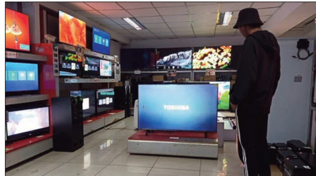
Entana vaovao vao tonga ao amin'ny Tranombarotra Baolai.

Amin' ny vanim-potoana toy izao, dia manavao ny tolotra omeny ny orinasa tsy miankina eto amintsika. Anisan' izany ny Tranombarotra «Baolai » etsy Soarano, Analakely sy Bazar - be Toamasina. « Maro be ny entana vaovao loha- laharana amin' ny kalitao hita ato