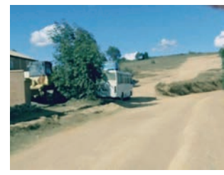
Lalana any amin'ny distrikan'Andramasina. Aly

dia anerenareo taxi-brousse ? angaha tsy voadinika mialoha vao nanomboka ? na tsy nanambara hoe governorana no manao ny lalana fa natao ny vahoakan'ny distrika. Dia manana adidy ny rehetra amin'izay."