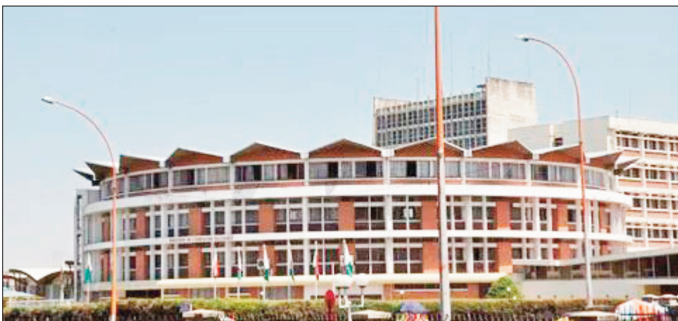
Ny ministeran'ny fanabeazam-pirenena etsy Anosy.

Ny 2 volana faha-4, hanomboka ny 11 martsa