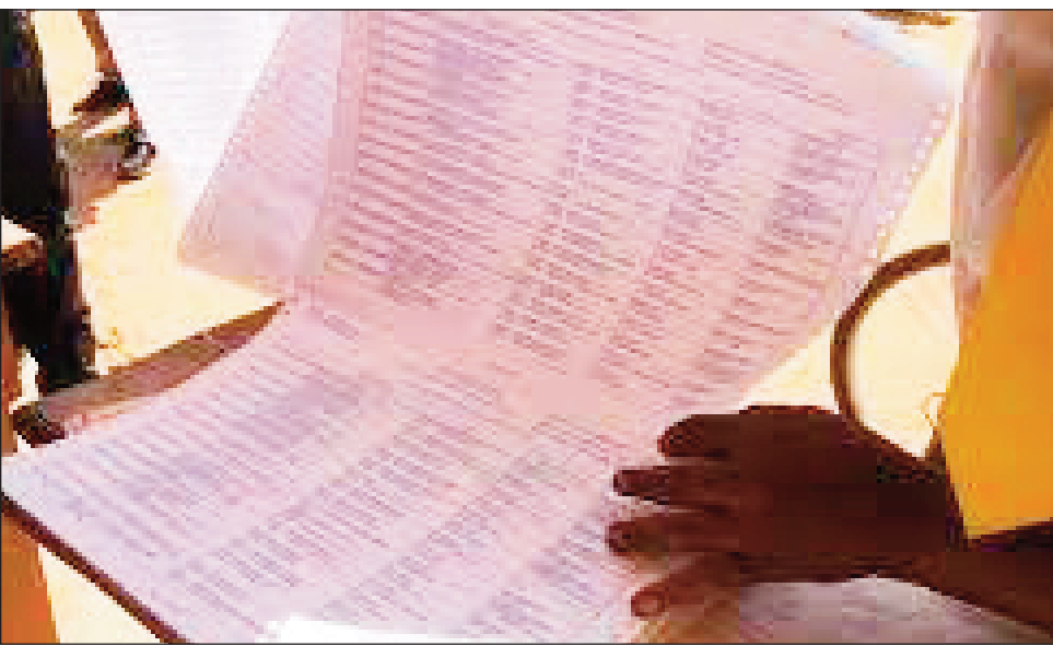
Lisi-pifidianana any anivon'ny fokontany.