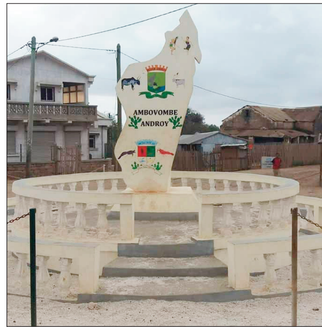
Ny tanànan'Ambovombe Androy.