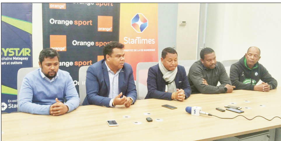
Valan-dresaka teny Mahamasina.

Nambaran'ny CFEM mpi-karakara ny hetsika "Orange Pro-League, tamin'ny valandresaka mialohan'ny lalao natao ho an'ny mpanao gazety tetsy Mahamasina, tamin'ny talata 04 jolay teo ka natrehan'ny mpikambana ao amin'ny FMF, sy ny solontenan'ireo mpilalao, fa ho tolora lalavola 15 tapitrisa Ar izay tafavoaka ho mpandresy amin'ny lalao famaranana ho tanterahina etsy amin'ny kianjamben'i Mahamasina amin'ny alahady 09 jolay 2023 hanomboka amin'ny roa ora tolakandro, na ny Fosa Juniors Fc Boeny na ny As Fanalamanga Alaoatra Mangoro, izay samy nanambara fa vonona hisalotra ny anaram-boninahitra avokoa ka ham-piseho lalao tsara hoan'ny mpijery ho tonga eny Mahamasina. Samy hahazo ny anjaram-bola tandrify azy kosa ireo ekipa 16 nandray anjara tamin'ity fifaninanana ity. Mialohan'ny lalaoan'ny roa