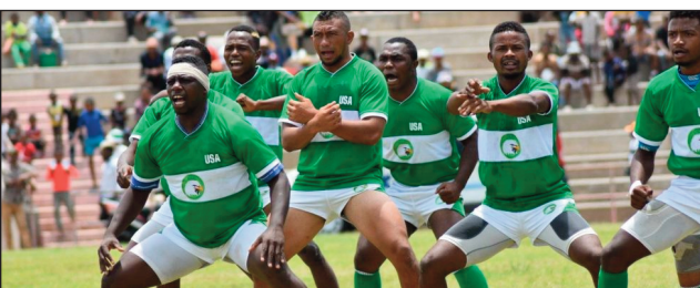
USA Ankadifotsy rugby.

Hafanafana ara-bakiteny eny amin'ny kianja Makis amin'ny alahady 09 jolay 2023 ho avy izao, fotoana hanatanterahana an'ireo lalao ampahaefa-dalan'ny fifaninanana "Rugby XXL Energy Top 20 2023", satria samy fiandrianana goavana avokoa no hiseho amin'io andro io.