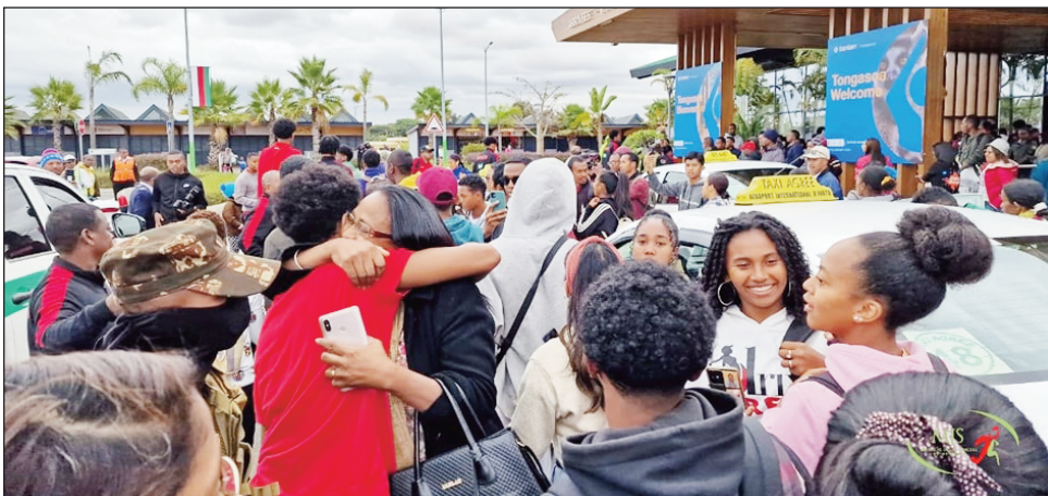
Fitsenana ny Ankoay U 19 teny Ivato.

Notsenaina am-boninahitra teny amin'ny seranam-piaramanidina Ivato tamin'ny talata 04 jolay atoandro teo, ny delegasiona basikety Malagasy nisy ny mpilalaoan'ny Ankoay lehilahy U19 Malagasy, avy nandray anjara tamin'ny "Mondial basket U19 2023", ka nahazo ny laharana faha-14 tamin'ireo mpandray anjara niisa 16 na dia vao sambany aza i Madagasikara nandray anjara tamin'izany fifaninanana avo lenta izany. Nitarika ny fitsenana azy ireo ny minisitry ny tanora sy fanatanjahantena Malagasy sy ny minisitry ny fitantanan-bola ary ny minisitry ny filaminam-bahoaka notronin'ny fianakaviamben'ny tontolon'ny