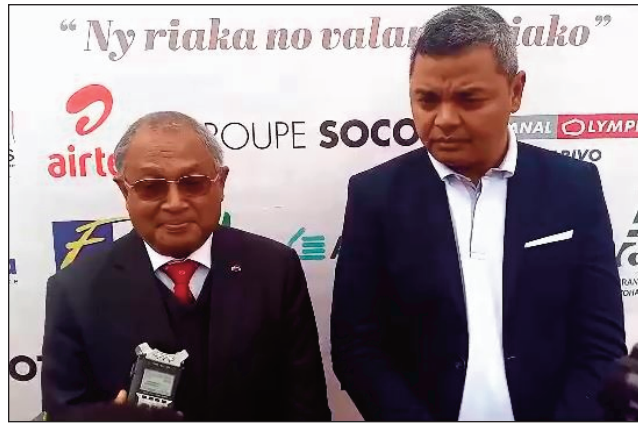
Ireo nitoto nahafotsy sy nahandro naha-masaka ny sarimihetsika: "Nampoina, ny riaka no valampariako."