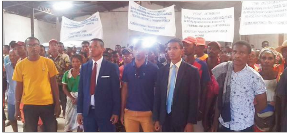
Ny fidinana ifotony, nataon'ny avy amin'ny Hafari Malagasy sy ny Fima, tany Mampikony.

Nihaino ireo vahoaka izay mampiasa ny tanin'ny Group Socota sy ny Sarlacos amin'ny fambolena black eyes, any amin'ny distrikan'i Mampikony faritra Sofia, ny Filohan'ny Hafari sy ny FIMA, rehefa naharay ny fitarainan'ireo mpamboly noho ny fibodoan'olom-bitsy ny tany hofain'izy ireo. Mamelona ireo tantsaha mpamboly, tanora, zaza amam-behivavy mananontena izany tany izany, nefa misy manakorontana sy mampiasa herisetra raha ny fitarainan'ireo mpamboly ka nampitondra takaitra azy ireo ara-moraly sy ara-batana. Noho izany dia nanao fidanana ifotony ny ekipa avy ao amin'ny HAFARI Malagasy sy ny FIMA, izay no-