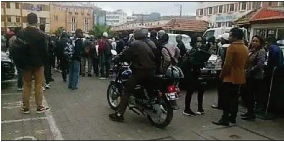
Mpiasan'ny CUA nitokona tetsy Analakely omaly.