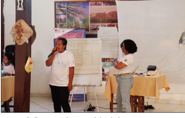
Atrikasa momba ny zon'olombelona natao tany Morondava faritra Menabe.

Ho fanamafisana ny fahafahan'ny fikambanan'ny fiarahamonim-pirenena (CSO), hanamora ny eza-ka fanentanana amin'ny alalan'ny fametrahana fiarahamiasa amin'ny manam-pahefana ho fiarovana ny zo maha olona dia nisy ny atrikasa ny 03 hatramin'ny alakamisy 06 jolay 2023 teo nokarakarain'ny Alternatives Madagasgar, izay fikambanana miasa amin'ny famahana ny olan'ny fiaraha-monina sy ny fanontaniana mifandraika amin'ny maha-olombelona, tao amin'ny Centre Ecotourisme Menabe Morondava. Fotoana nanaovana tantsoroka nanomezana teknika amin'ny fandrafetana tati-