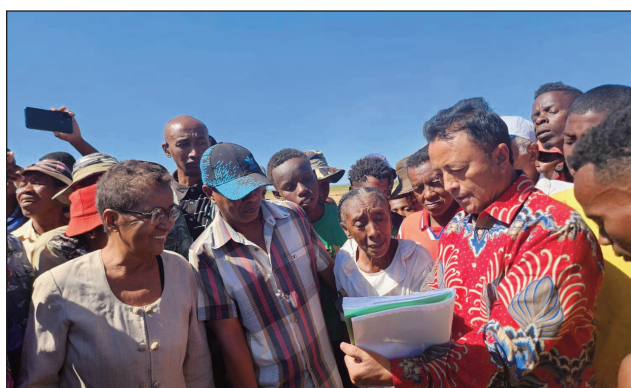
Ny filoha Marc Ravalomanana tany Marovoay.

Tao aorian'ny kongresy nasionalin'ny antoko Tiako i Madagasikara (TIM) ny 1 jolay lasa teo, miroso mitety faritra mampahafantatra ny MAP Plus amin'izao fotoana ny filoha Marc Ravalomanana. Tany Marovoay faritra Boeny izy ny faran'ny herinandro teo. Mihitsoka tanteraka ny firenena ankehitriny, hitondrana vahaolana voalohany sy maika ny resaka sakafo hoy izy : "faly tena faly aho mihaona mivantana aminareo eto Marovoay androany manazava voalohany ny MAP PLUS. Marovoay dia anisan'ny sompitri'i Madagasikara. Asa maika voalohany ao amin'ny MAP PLUS ny hitondrana vahaolana ho an'ny sakafo. Raha vary no resaka dia eo: ny Omby, ny Rano, ny Masomboly, ny tanimbary, ary ny tantsaha. Kanefa raha tsy omena sehatra ny tantsaha, tsy omena fampiofanana sy fitaovana enti-mamokatra mifanaraka amin'ny vanimpotoana sy vaninandro dia zava-poana dia zava-poana ny ezaka ataon'izy ireo. Noho izany ny MAP Plus dia manome lanja manokana ny famokarana sy ny fambolena ary ny sakafo ho an'ny Malagasy rehetra