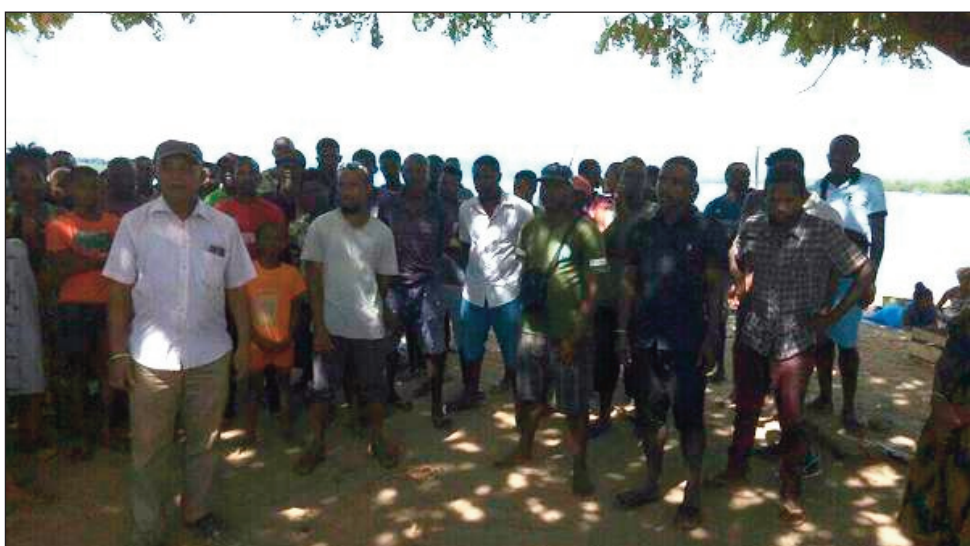
Didimpoitra faobe maimaimpoana, nokarakarain'ny Solombavambahoaka Feno Ralambomanana ao amin'ny Boriboritany faha-3, tao Bel'Air ny sabotsy teo.