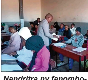
Nandritra ny fanombohan'ny fanadinana BEPC tao amin'ny Lycée Pôle Morondava.

Andro vitsy mialohan'ny fanadinam-panjakana BEPC dia niparitaka tamin'ny tambazotran-teraserera, fa misy manana lazaadina, ka izay mila dia mandefa Mp amin'ilay mpanao publication, maro ny roboka. Nandray ny andraikiny ny fanjakana, ka nisy ireo tratra ary nambara tamin'izany, fa laza adina hosoka fa tsy ilay hampiasaina amin'ny fanadinana BEPC 2023 ity ireo niparitaka, ka dia nangina teo ny rehetra. Raha ny zava-nisy anefa dia tena nisy ireo laza adina nivoaka alohan'ny fotoana, ka isan'ny nahazo izany ireo mpiadinana 2 lahy izay tratra tao amin'ny foibem-panadinana Lycée Pôle Morondava faritra Menabe. Raha ny fizotran'ny nahatratrarana azy dia niera nivoaka, ka tojo tamin'ny chef de centre nanao fisafoana, hita tamin'izany fa vakiraoka efa feno valina laza adina Physique no tany aminy, izay tsy soratanany, ka noentina natao fanadiha-