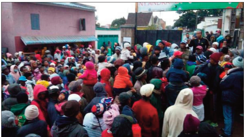
Kaominina Antafiambotry Nosy Faly distrikan' Ambanja faritra Diana. Nitokona ireo vahoaka mpanjono an-dranomasina, tsy manaiky ny ataon'ireo vahiny mpanjono an-tsokosoko any an-toerana... Efa nisy lalana manan-kery napetraky ny mpitondra mahakasika tsy fahazahoana manjono amin'ny alina nefa mbola misy mandika izay lalana izay ireo vahiny any an-toerana.