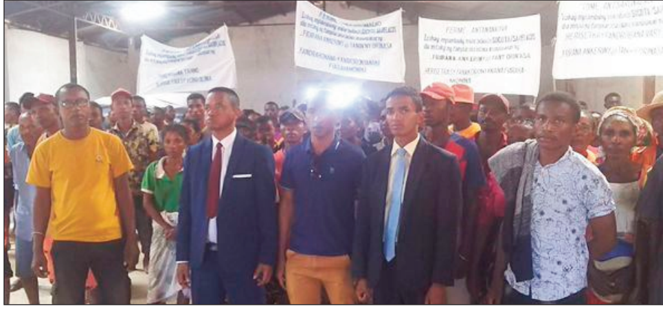
Ny fidinana ifotony, nataon'ny avy amin'ny Hafari Malagasy sy ny Fima, tany Mampikony.

Nihaino ireo vahoaka izay mampiasa ny tanin'ny Group Socota sy ny Sarlacos amin'ny fambolena black eyes, any amin'ny distrikan'i Mampikony faritra Sofia, ny Filohan'ny Hafari sy ny FIMA, rehefa naharay ny fitarainan'ireo mpamboly noho ny fibodoan'olom-bitsy ny tany hofain'izy ireo. Mamelona ireo tantsaha mpamboly, tanora, zaza amam-behivavy mananontena izany tany izany, nefa misy manakorontana sy mampiasa herisetra raha ny fitarainan'ireo mpamboly ka nampitondra takaitra azy ireo ara-moraly sy ara-batana. Noho izany dia nanao fidanana ifotony ny ekipa avy ao amin'ny HAFARI Malagasy sy ny FIMA, izay no-