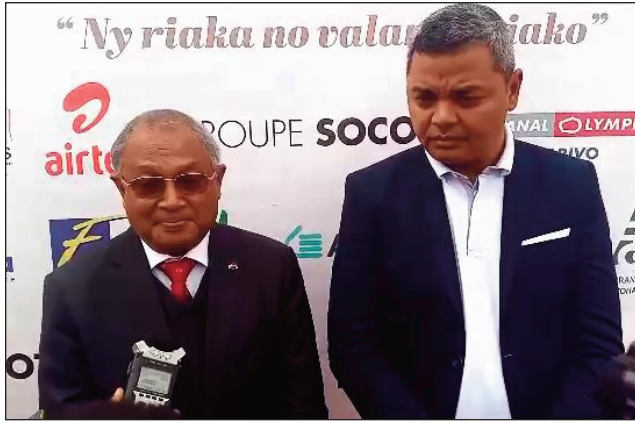
Ireo nitoto nahafotsy sy nahandro naha-masaka ny sarimihetsika: "Nampoina, ny riaka no valampariako."