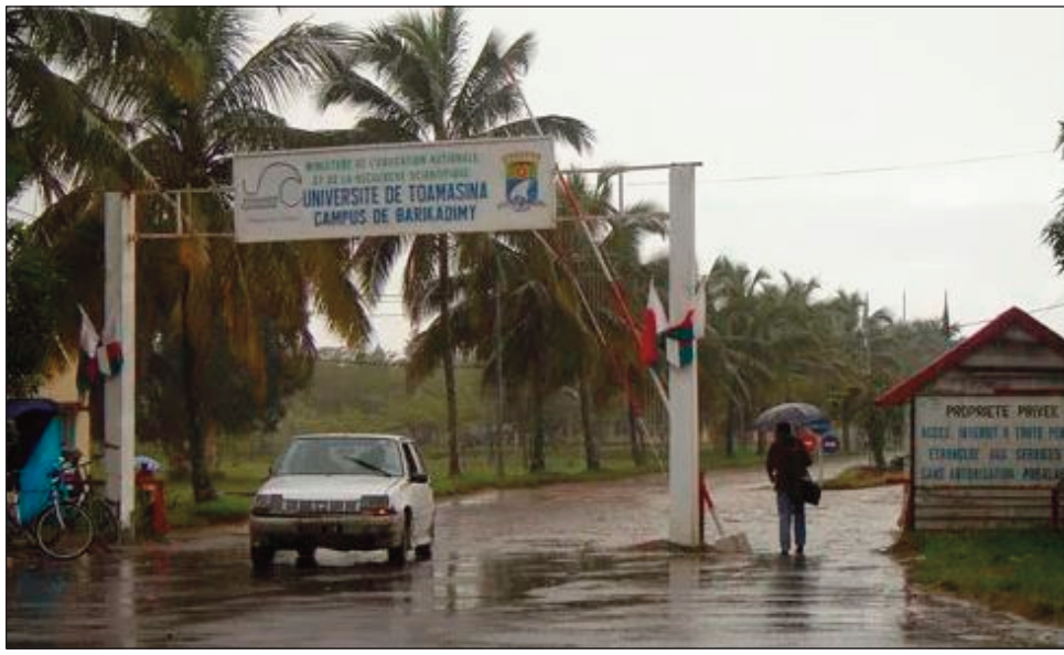
Ny Oniversiten'i Toamasina, anisan'ny handray ireo afaka bacc taom-pianarana 2023.

Tsara fanomanana ny fanadinana baccalauréat any Toamasina, fanadinam-panjakana izay nanomboka omaly 17 Jolay, ato amin'ny Faritra Atsinanana, Analanjirifo, Alaotra, Mangoro. Miisa 31792 ny isan'ny mpiadina, ka ny 1577 amin'ireo no manao Baccalauréat Technique, ary 2220 ireo "candidats libres." Nisy fiakarany 767 ny isan'ny mpiadina tamin'ity taona ity. 63taona ny zokiny indrindra ary 13 taona ny zandriny indrindran, izay mpiadina any Mananara Avaratra faritra Analanjirifo. Nanomboka tamin'ny 7 ora maraina ny fanadinana tamin'ny omaly 17 Jolay. Ireo no fantatra nandritra ny fahaonana tamin'ny Mpanao Gazety nataon'ny