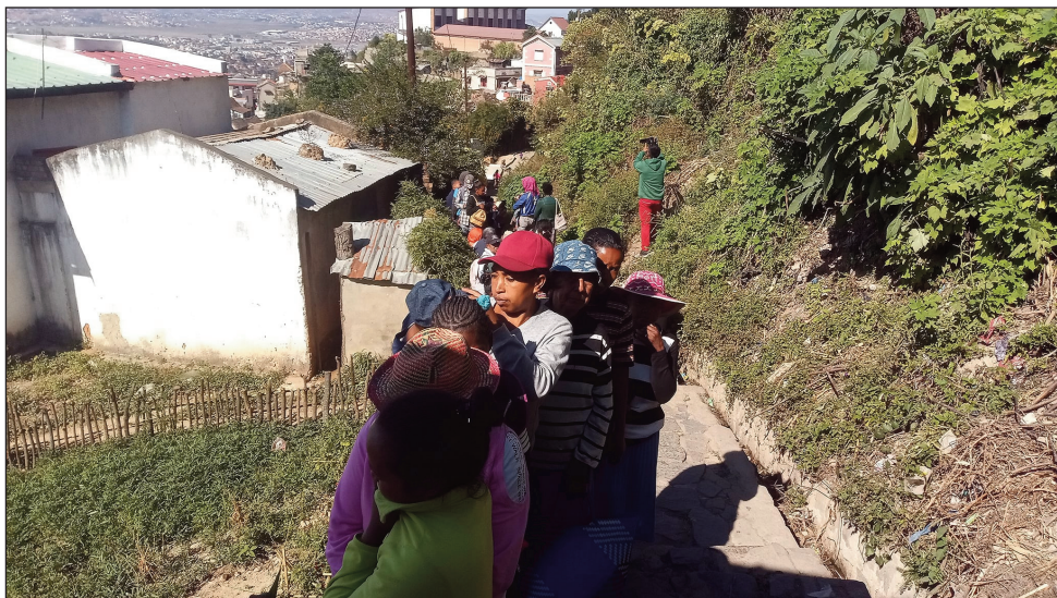
Nizara vary ho an'ny olona miisa 3500 ny kaominina Alasora Avaradrano noho ny fetim-pirenena, tao amin'ny kianja Maitso Alasora ny zoma teo. Nanatrika izany ny filoha Marc Ravalomanana filoha nasionalin'ny antoko TIM.