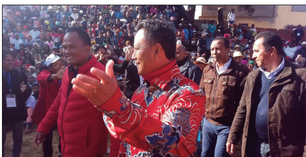
Ny filoha Ravalomanana teny Alasora ny zoma lasa teo.