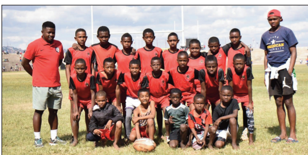
Festival des Rugby tetsy Andohatapenaka.