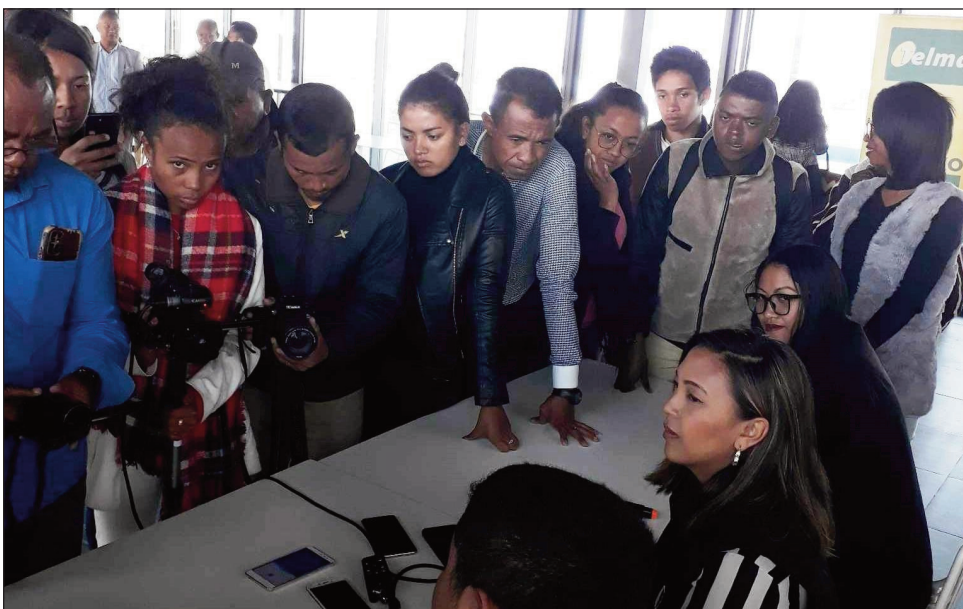
Valandresaka teny Andraharo.

Fantatra avy tamin'ny valandresaka hoan'ny mpanao gazety natao omaly alatsinainy 12 jona 2023 teny amin'ny "Campus Telma Andraharo", fa nahavita fifanarahana miavaka "Accord de partenariat" tamin'ny marika telefaonina Itel ny orinasan-tserasera Telma ny amin'ny hahazoan'ireo Shop Telma manerana ny Nosy mivarotra ny hiaka farany amin'ny smartphones dia ny "smartphones A60" no-vokarin'ny marika Itel. Tena mampiavaka an'ity "smartphone" iray ity amin'ny ankapobeny, ankoatra ny tanjany manokana (32Go de mémoire extensible jusqu'à 18Go, 2Go de Ram) dia ny fananany vatoaratra 5000mAh sy ny fahafahany mitahiry sary hatrany amin'ny 560 isa any ho any amin'ny alalan'ny fakan-tsarin'ny misy ny "intelligence artificielle". Marihana fa izay mpanjifa mi-vidy an'ity vokatra ity any amin'ireo Shop Telma rehetra manerana ny Nosy dia hahazo 2Go de Ram