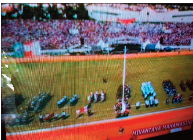
TVM nandefa hetsika nivantana.

Lavon'ny Manchester City notarihan'ilay mpanazatra kalaza, Pep Gauradiola, 1-0 ny Inter Milan, teo amin'ny lalao famaranan'ny fifaninanana baolina kitra malaza sy avo lenta indrindra manerantany « UEFA Champion's League » andiany 2023, izay notontosaina tany amin'ny kianjan'i Istanbul Turquie, tamin'ny sabotsy 10 jona 2023 teo. Sambany teo amin'ny tantara nisiany no nandrombaka an'ity amboara ity ny ekipa Anglisy Manchester City. Tsy nandeha nivantana (sambany ihany koa) tamin'ny televiziona Malagasy TVM ity famaranana