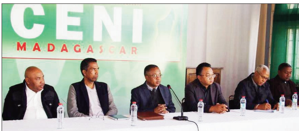
Ireo avy amin'ny biraon'ny CENI.