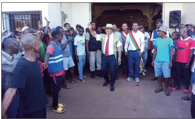
Hatrao anatin'ny ka hatrany ivelany, maro ireo niatrika ny kongresim-paritry ny TIM tany Vangaindrano.