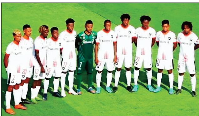
Fosa Juniors Fc tetsy amin'ny By- Pass tamin'ny alahady.

L avon'ny ekipan'ny Fosa Juniors Fc Bony tamin'ny isa 3-1, ny ekipan'ny Ajesaia Bongolava, tamin'ny alahady 11 jona 2023 teo, tetsy amin'ny kianja "Elgeco Plus Stadium By-Pass", teo amin'ny ankatoky ny famaranana mandrosy ny fifaninanana "Orange Pro-League 2022-2023 (baolina tafiditr'i Vévé (16') sy Dax (43') ary Andy Max (68") no niantoka an'io fandre-sen'ny Fosa Juniors Fc an'ny Ajesaia io, izay nampiditra ny baolina tokana azony teo amin'ny 90' tamin'ny alalan'i Feno. Tsara toerana araka izany