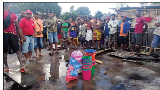
Hetsika sosialy nataon'ny TIM Vavatenina, ho an'ireo may trano tany an-toerana.