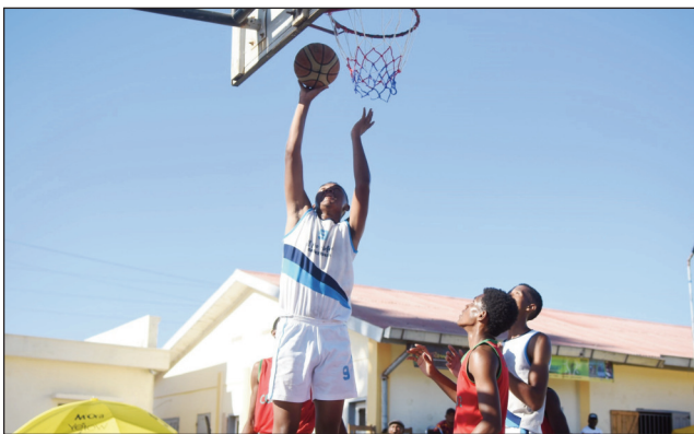
Basket N1B tany Morondava.

Nanomboka tamin'ny sabotsy 10 jona 2023 lasa teo tany Morondava, ny fifaninanam-pirenenena fiadiana ny ho tompon-dakan'i Madagasikara 2023, eo amin'ny taranja Basiketany baolina sokajy N1B lehilahy, izay marihana fa tsy hifarana raha tsy amin'ny faha-18 jona 2023 ho avy izao. Nisongadina teo amin'ny fahazoana isa be indrindra nandritra an'ireo andro roa voalohany (sabotsy 10 sy alahady 11 jona 2023) ny ekipan'ny Sbbc Boeny raha nihaona tamin'ny Serasera Vakinankaratra. Voka-dalao