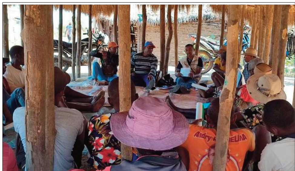
Efa miomana amin'ny hanaovana ny kongresim-paritry ny TIM Vatovavy ihany koa ny antoko TIM ao Manajary.