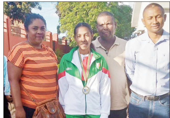
Hakotiana noraisina am-boninahitra tany Tsiroanomandidy.