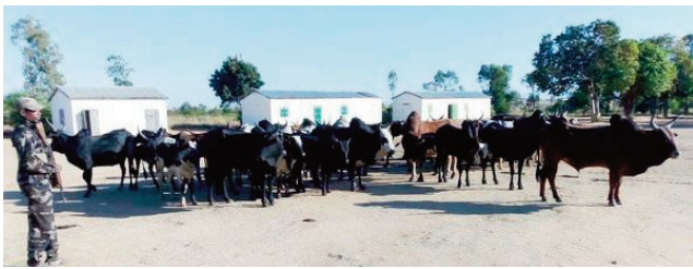
Ireo omby azon'ny miaramila, miandry ny tompony any Ikalamavony.

Dahalo 3 no lavo vokatry ny fifandonana tamin'ny miaramila tany amin'ny distrikan'Ikalamavony faritra Matsiatra Ambony. Dahalo niisa 08 nitondra kalachnikov niaraka tamin'ny omby manodidina ny 30 mahery eo no fantatra, fa nitoby tao amin'ny kizon'i Manody, antsoina hoe Manambato Andragnomandragna, Fokontany Androy, kaominina Fanjakana, distrikan'Isandra, izay faritra manasarakana ny distrikan'Ikalamavony sy Isandra ary Ambohimaheaso, araka ny