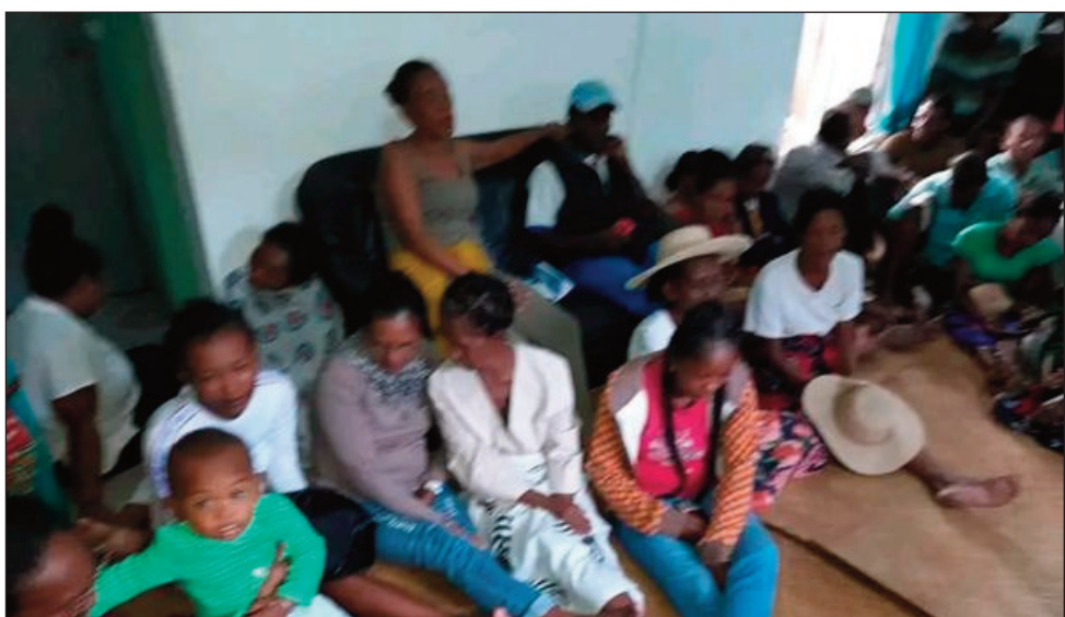
Nitsidika ny Centre Valbio ao Ranomafana Ifanadiana faritra Vatovavy ny filoha Marc Ravalomanana, amin'ny fandalovany amin'ny lalampirenena faha-25 (RN25) iny. Nifanakalo hevitra tamin'ireo mpianatra mpikaroka avy any Etazonia izy nandritra izany.