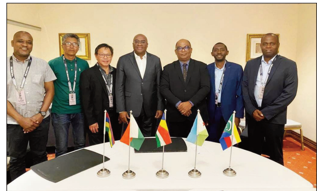
Ntsay Abel tany Maputo (faha-3 avy ankavanana).