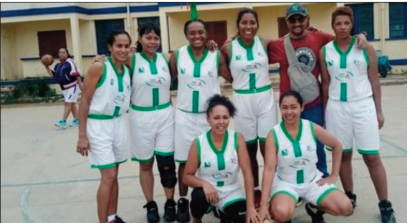
Ekipa Basket Asief Mjs Analamanga.

Hisongadina ny fifaninanana basikety ho tontosaina etsy amin'ny kianja "Terrain Toby Ratsimandrava Andrefan'Ambohijanahary, amin'ny fitohizan'ny fifaninanana Asief rejionalin'Analamanga 2023amin'ity faran'ny herinandro ity. Fandaharan-dalao sabotsy 10 jona 2023 : Kianja « Terrain Toby Ratsimandrava Andrefan'Ambohijanahary » 7.30 (DA) MID # MEDD 8.30 (JC) MTEFTLS # APMF 9.30 (DA) SANTE # EMA 10.30 (JD) MEF # CUA 11.30 (DB) HJRA # MTEFP 12.30 (DB) MINAE # MJS 13.30 (JC) MATSF # PRM Marihana fa mitondra « Bordereau » sy « CIN » ireo mpilalao rehetra.