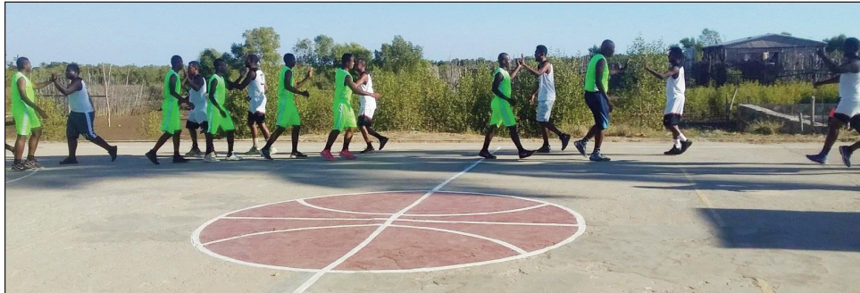
Kianja basikety « Terrain Capj Morondava ».

Tontosa omaly zoma harivan'ny 09 jona 2023, tao amin'ny "Maison des Jeunes Morondava", ny fitoviana Morondava, ny fivoriana "Réunion Technique" ny fifaninanana fiadiana ny ho tompondaka nasionaly 2023 sokajy N 1B lehilahy. Anio sabotsy 10 jona 2023 kosa ao amin'ny kianja "Terrain Capj sy Caserne de la Gendarmerie" any Morondava vao tena hanomboka ny fifaninanana, ka ireto avy ireo ekipa handray anjara amin'izany : Génération 619 sy Ass (Menabe), Serasera sy Ffpro (Vakinankaratra),