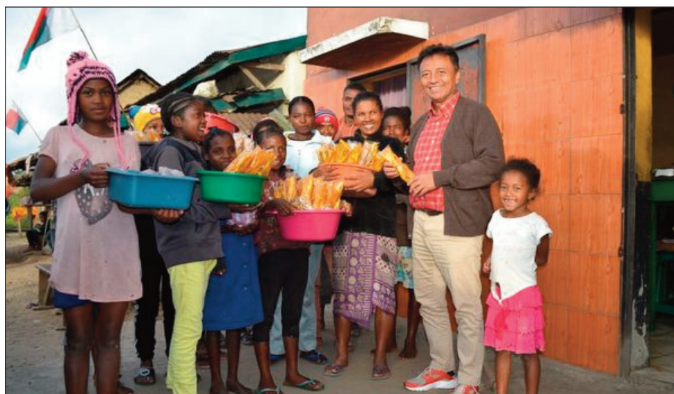
Ny sasany amin'ny komity mpikarakara ny kongresim-paritry ny TIM any Fitovinany, nitafa tamin'ny MBS Radio Manakara omany.