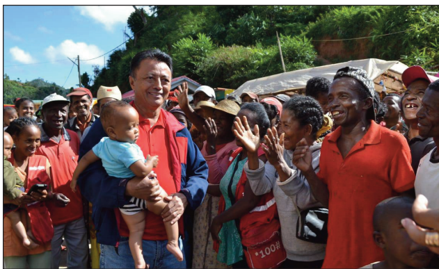
Ny filoha Marc Ravalomanana tany amin'ny RN25 omaly.

Tanterahana amin'izao faran'ny herinandro izao ny kongresim-paritry ny antoko Tiako i Madagasikara any amin'ny « Grand Sud-Est », na any atsimo atsinanana i Madagasikara iny, izay ahitana faritra 3 dia Fitovinany, Atsimo Atsinanana ary ny faritra Vatovavy. Ny « Grand Sud-Est » raha ny famaritana azy dia avy any Nosy-Varika faritra Fitovinany, tonga any Vangaindrano faritra Atsimo Atsinanana, ka hatrany Fort-Dauphin faritra Anôsy. Anio sabotsy no hanatanterahan'ny antoko najoron'ny Dada ny any Fitovinany, hatao anio any Manakara ; rahampitso alahady ny any Atsimo Atsinanana, hatao any Vangaindrano ary ny alatsinainy ho avy izao ny kongresim-paritry ny TIM any Vatovavy, hatao ao Mananjary. Heverina fa haka tsodrano any amin'izany faritry ny « Grand Sud-Est » izany ihany koa ny filoha Marc Ravalomanana, mialohan'ny kongresy nasionalin'ny antoko, ary indrindra mialohan'ny fifidianana filoham-pirenena hatao eto amintsika amin'ity taona ity. Anisan'ny be mpifidy eto Madagasikara ny amin'ireo faritra ireo, ka tsy ataon'ny antoko TIM sy ny filoha Ravalomanana ambanin-javatra ny fihaonana amin'ny mpikatroka, ny mponina, ny anton'olona maro samihafa ary ireo ray aman-dreny any an-toerana. Lalana tsy maintsy hizorana ho an'ny rehetra mangata-tsodrano hirotsaka hofidiana eto amin'ny firenena koa ny any atsimo atsinanan'ny Nosy iny. Ho tafahoana tokoa ny tia sy ny manina mandritra ny 3 andro any Manakara, Vangaindrano ary Mananjary. Ny filoha