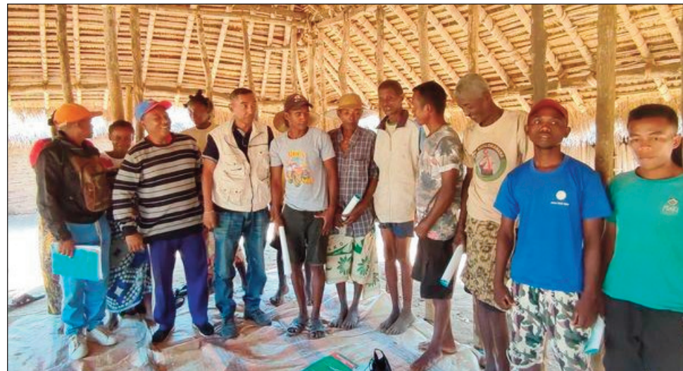
Ny fivoriana nananganana ny COMTIM tany Andabotoka Maintirano.

Tafajoro ny herinandro lasa teo ny COMTIM any amin'ny kaominina Andabotoka distrikan'i Maintirano faritra Melaky. Niatrika ny fananganana izany tany an-toerana, ny mpandrindra ny TIM Région Melaky sy ny filohan'ny DISTIM Maintirano. Nisongadina nandritra ny fotoana ihany koa, fa vonona hanabe voho ny antoko ireo biraon'ny COMTIM vao najoro ireto, ary vonona hampandany ny filoha Marc Ravalomanana, filoha nasionalin'ny antoko, amin'ny fifidianana filohampirenena ho avy amin'ity taona ity. Nanentana faramparany koa izy ireo ny mponina any amin'izany toerana izany