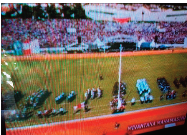
TVM nandefa hetsika nivantana.

Lavon'ny Manchester City notarihan'ilay mpanazatra kalaza, Pep Gauradiola, 1-0 ny Inter Milan, teo amin'ny lalao famaranan'ny fifaninanana baolina kitra malaza sy avo lenta indrindra manerantany « UEFA Champion's League » andiany 2023, izay notontosaina tany amin'ny kianjan'i Istanbul Turquie, tamin'ny sabotsy 10 jona 2023 teo. Sambany teo amin'ny tantara nisiany no nandrombaka an'ity amboara ity ny ekipa Anglisy Manchester City. Tsy nandeha nivantana (sambany ihany koa) tamin'ny televiziona Malagasy TVM ity famaranana