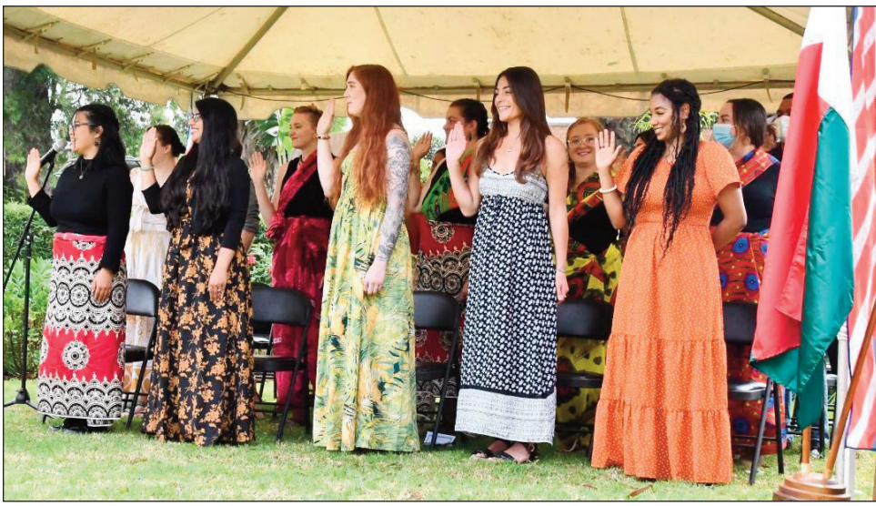
Ireo mpilatsaka an-tsitrapo ao amin'ny Corps de la Paix Amerikana, nanao fianianana.

Nitombo isa ireo mpilatsaka an-tsitrapo amerikana avy amin'ny Peace Corps miisa eto Madagasikara. Miisa 21 ireo mpilatsaka an-tsitrapo Peace Corps vaovao, izay nanao fianianana ny herinandro teo, eto Antananarivo, teo anoloan'ny Mpanolontsaina Voalohan'ny Ambasady Amerikana Tobias Glucksman, izay tafiditra ao anatin'ny famerenana tsikelikely ny asan'io rafitra io, taorian'ny fampodiana faobe ireo mpilatsaka an-tsitrapo vokatra ny valan'aretina Covid-19 tamin'ny taona 2020. Talohan'ny fianianany dia nianatra momba ny teny sy kolontsaina Malagasy nandritra ny 12 herinandro ireo mpilatsaka an-tsitrapo, sady nanamafy ny fahaiza-manao ara-teknika. Mivonona handeha ho any amin'ny toerana misy ireo tetikasany eto Madagasikara izy ireo ankehitriny ary hiasa any mandritra ny roa taona. Ireo mpilatsaka an-tsitrapo rehetra ireo dia hiasa amin'ny sehatry ny fahasalamana ary hanohana ny asa eny anivon'ny toeram-pitsaboana CSB hanatsarana ny fahasalaman'ny reny sy ny zaza, ny fahazoana rano fisotro madio sy ny fidiavana ary ny fanatsarana ny fahasalamana ara-pananahan'ny tanora. Ny Mpanolontsaina Voalohan'ny Glucksman dia nanihina, fa ireo mpilatsaka an-tsitrapo dia ambasa-