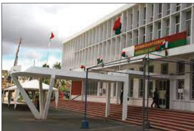
Ny lapan'ny Antenimierampirenena eny Tsimbazaza.

Toa tena tsy miraharaha ny resaka fifidianana hatreto ny fifidianana, mbola tsy fantatra na ho voadinika na tsia eny Tsimbazaza sy etsy Anosikely ny momba ny resaka fanitsiana ny lalam-pifidianana eto amintsika. Tsy tafiditra ao anaty ny lahadiniky ny fivoriana ara-potoan'ny Antenimierampirenena ny fanitsiana ny lalàna mifehy ny fifidianana. Ny Lalàna momba ny fananantany dia nataon'ny fitondrana teo aloha, kanefa nohavozina. Ny Lalàna momba ny akoranafy dia nataon'ny fitondrana teo aloha, kanefa nohavozina. Ny Lalàna momba