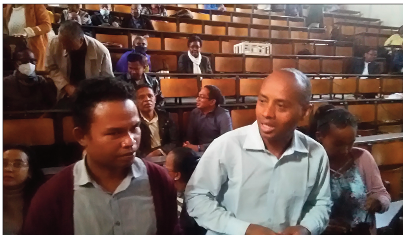
Ireo avy amin'ny Seces Antananarivo.

Tsy hisy ny fampianarana eny amin'ny sekoly ambony Politeknika hanomboka anio Talata 09 Mey 2023, satria tsy hiasa intsony ireo mpampianatra mpi-karoka an-tselika nohon'ny tsy fandraisan'ireto farany ny tambikaraman'izy ireo nanomboka ny taom-pianarana 2018-2019 lasa teo. Nanambara ny solontenan'ny mpampianatra an-tselika iray mitaky amin'ny fitondram-panjakana sy ny ministera mpiahy, mba hialoan'izy ireo ara-drarin'ny valinkasasan'ny mpampianatra an-tselika, no sady mitaky ny angarahana amin'ny fomba fandraisana mpampianatra mpikaroka. Nanamafy ny solontenan'ny mpampianatra an-tselika eo anivon'ny Oniversite Antananarivo, fa mitaky ny fanajana ny sata mifehy ny mpampianatra an-tselika, mba hampirindra ny fampianarana sy ny asa rehetra izay ataon'ireto farany ary miantso an'ireo mpampianatra an-tselika any amin'ireo Oniversite manerana ny Nosy, mba hanatevin-draharana an'izao fitakiana izao. Nilaza ny Profesora Ravelonirina Sammy Gregoire, filohan'ny Seces sampana Antananarivo, fa manaitra ny fitondram-panjakana, mba handoa ny karaman'ny mpampianatra an-tselika efa ho 4 taona misesy izao ary tokony havoakan'ny fitondram-panjakana ny volavolana didim-panjakana miisa 5 ho fampiharana ny lalàna 2001/005. Nanamafy ny filohan'ny Seces Antananarivo, fa tokony havoakan'ny fitsarana avo momban'ny Lalampanorenana ilay tolo-dalàna izay efa voarainy, izay tsy nahitam-baliny hatreto ary miantso ny mpam-