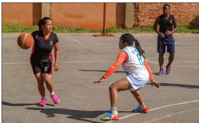
Lalao basket- ball Asief 2023.

Nitohy ireo fifaninana samihafa amin'ny fifaninana “Championnat Asief Analamanga 2023”, ka ny lalao Baolina kitra, basket- ball ary volley- ball no natrehana ny sabotsy teo. Fandaharan-dalao basikety baolina ny sabotsy io teny amin'ny kianja Toby Ratsimandrava Andrefan'Ambohijannahary : 7:30-DA : MID # EMA, 8:30-DA : MEDD # MEN, 9:30-DB : SENAT # METFP, 10:30-DB : CUA # MJS, 11:30-JA : PAOMA # DGBF, 12:30-JA : ME-SUPRES # MJS. Fandaharan-dalao Baolina kitra