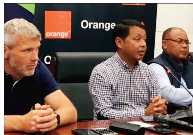
Ny CFEM tetsy Mahamasina.