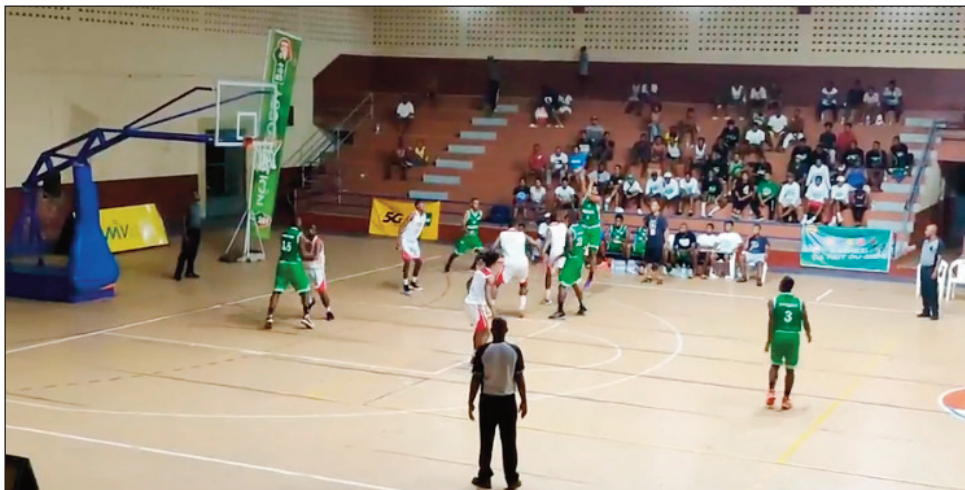
Basket N1 A tany Mahajanga.

Ekipa roa tamin'ireo 6 voafaritra tany ampandohana, fa handray anjara no tsy tonga any Mahajanga mandray anjara amin'ny fifaninana basikety « Championnat national N1A Hommes 2023 Conférence Ouest », izay nanomboka tamin'ny alarobia 03 mey 2023 lasa teo ka tsy nifarana raha tsy ny alahady 07 mey 2023 teo, dia ny SEBAM Boeny sy ny MB2ALL Analamanga. Ekipa miisa 4 izany sisa no niatrika an'ity fifaninana ity dia ny ASCUT Atsinanana, GNBC Analamanga, MBC Atsinanana ary ny AS Fanalamanga. Voka-dalao (homologués) ny andro voalohany alarobia 03 mey 2023 : As Fanalamanga Alaotra Mangoro (76) Mbc Atsinanana (76), Ascute Atsinanana (56) – (53) Gnbc Analamanga.