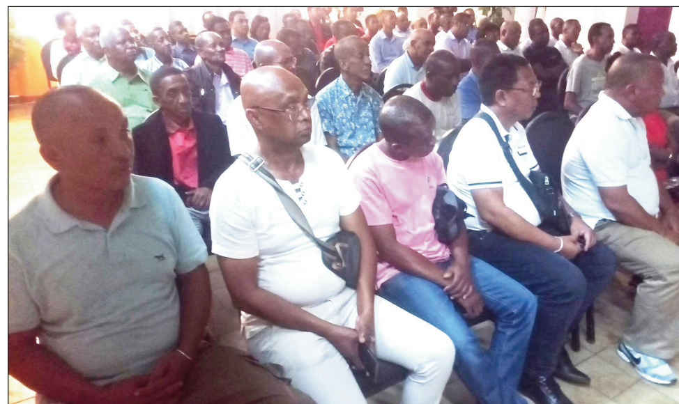
Sady nanomana ny kongresy ny TIM Atsinanana, no nanantana ny mponina hanaramaso ny lisi-pifidianana, ny tanora TIM Toamasina.