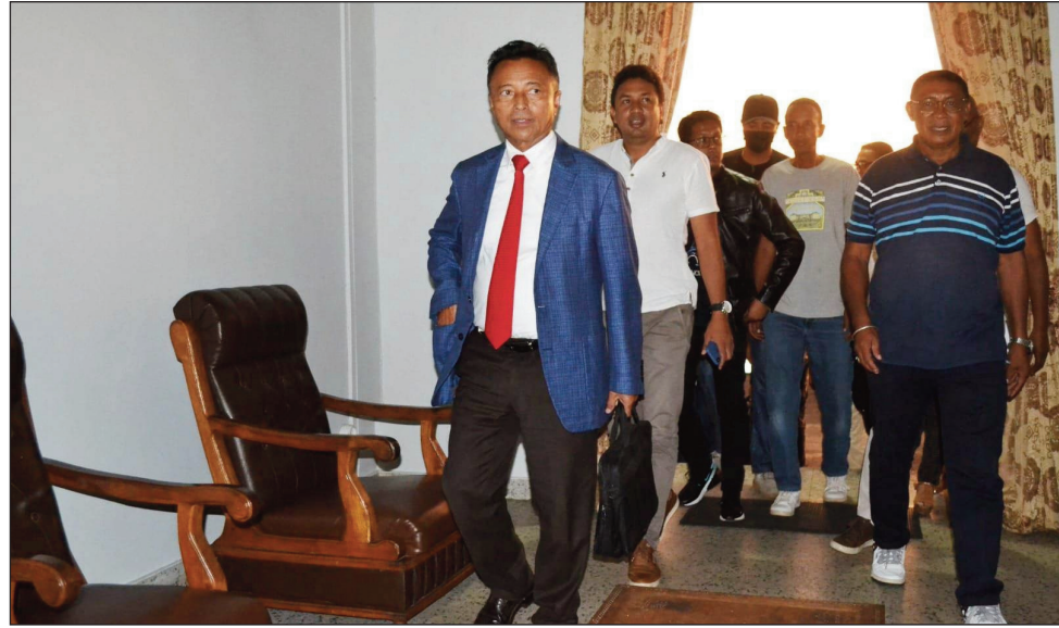
Ny filoha Marc Ravalomanana, nihaona tamin'ireo olom-boafidy depiote sy ben'ny tanàna teo aloha avy amin'ny antoko TIM, any amin'ny faritra Atsinanana.