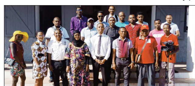
Ireo mpanao gazety niaraka tamin'ny Ben'ny tanànan'i Belo Tsiribihina.

Rugby "Ladies Makis 7s" sy ny "Makis U20" lehilahy