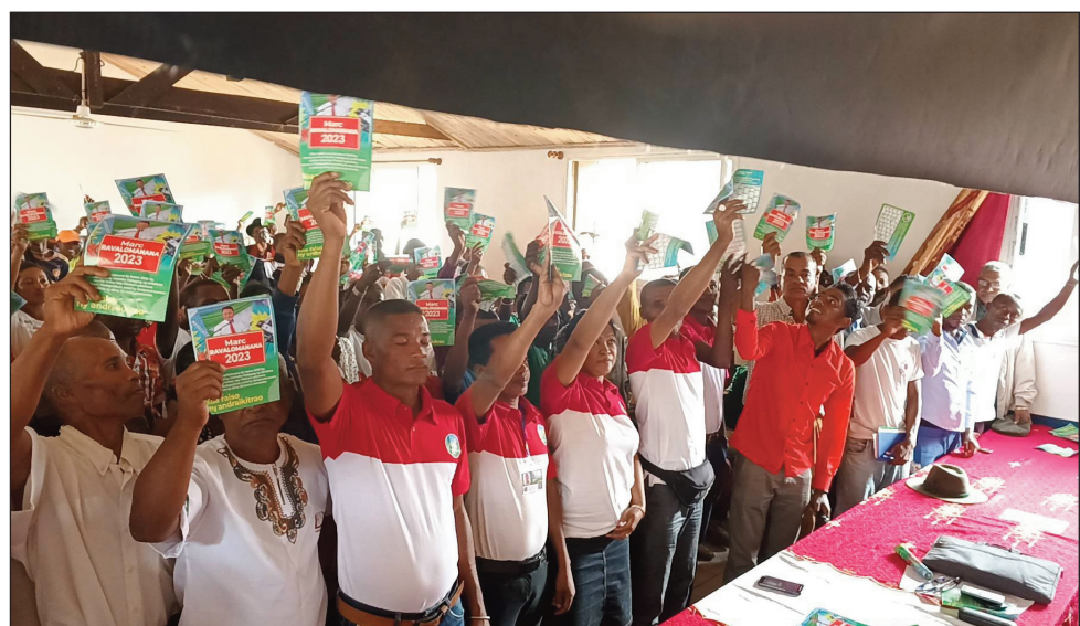
Ireo mpitarika ny Tanora TIM Androy, vonona hampandresy ny Filoha Marc Ravalomanana.