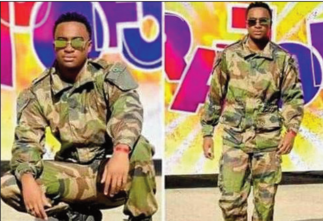
I Ayo Naej, nitafy akanjo mitovy loko amin'ny an'ny mpitandro filaminana.