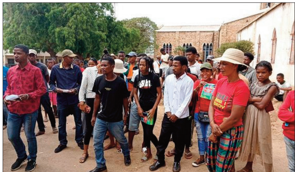
Ny fivorian'ny mpitarika TIM any Analanjirofo, miomana amin'ny fandraisana ny konresim-paritry ny antoko TIM any Fenoarivo Atsinanana amin'ny faran'ity herinandro ity.