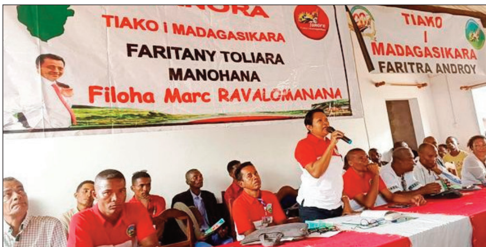
Ny fihaonana teo amin'ny mpitarika TIM Toliara, sy ireo mpitarika ny antoko any amin'ny faritra Androy.

Manohy hatrany ny fanentanana sy ny fanetsehana ary ny famelomamaso ny antoko Tiako i Madagasikara any ifotony, ny mpitarika an'ity antoko ity. Tontosa tamin'ity herinandro ity ny fihaonana teo amin'ny mpitarika ny antoko any Toliara, tarihan'i Me Elisoa, sy ny mpitarika ny antoko TIM any amin'ny faritra Androy. Nahatonga solontena avokoa ny mpitarika ny antoko avy amin'ny distrika mandrafitra ity faritra ity, toy ny avy ao Ambovombe, Beloha, Tsihombe, ary ny avy any Bekily. Niatrika izany koa ny solontenan'ny tanora sy ny vehivavy avy amin'ireo distrika ireo. Nandritra izany no nanentanana ny rehetra ho amin'