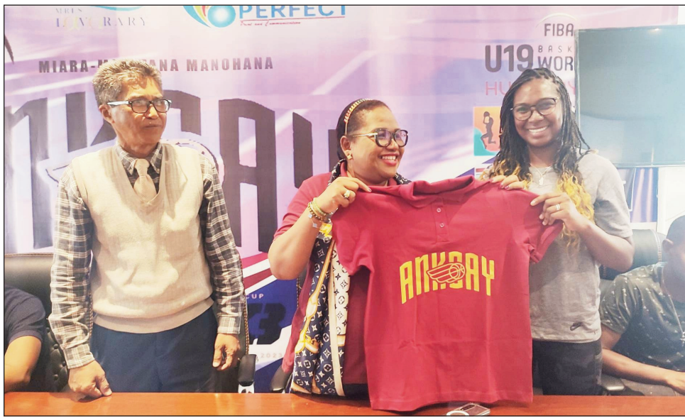
Fanolorana fanampiana ny Ankoay 3x3 lahy sy vavy teny Ambatoroka.