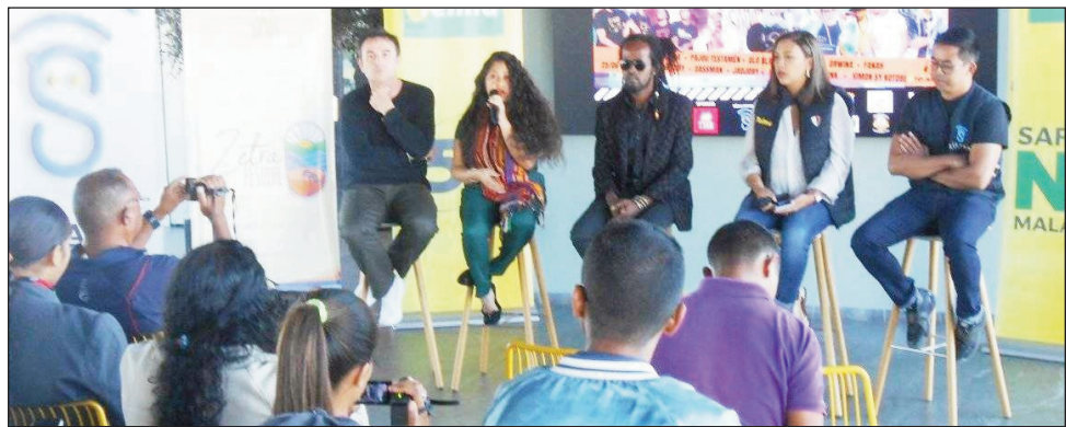
Fampahafantarana ny Festival Zetra tao amin'ny Campus Telma.

Ny gadon-kira Osika sy ny kolontsaina Sihanaka amin'ny ankapobeny, no tena ho voizina amin'ny hetsika « Festival Zetra » andiany voalohany, ho tontosaina ao amin'ny "Espace Laza Ambatondrazaka, amin'ny 24 sy 25 jona 2023 ho avy izao ary ao koa ny fampahafantarana an'ireo zava-tsy fahita firy mampisogadina an'iny Faritra Alaotra Mangoro iny. Toy ny fahita mahazatra amin'ny "Festival" tahaka itony dia hisy ny "Carnaval" lehibe mamakivaky ny tanànan'Ambatondrazaka, hiala eny amin'ny "La place" ary mipaka hatreny amin'ny "rond point Jovenne" hanombohana ny hetsika amin'ny 24 jona maraina, izay hiandrasana mpandray anjara mahatratra 300 isa ary ho faranana amin'ny "Soirée VIP" amin'ny alin'io andro io ihany. Hisy ny Podium lehibe hiseran'ireo mpanakanto avy ao an-toerana miisa 6