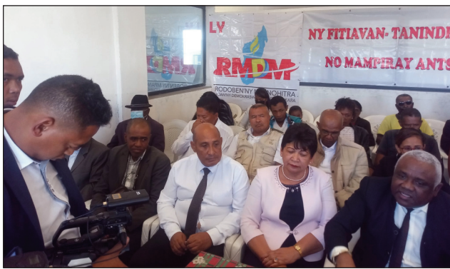
Ny avy amin'ny rodoiben'ny mpanohitra RMDM, nitafa tamin'ny mpanao gazety tetsy Bel'Air.