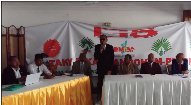
Ny Vondrona G5 tetsy amin'ny Hotel Astauria Antanimena.

damina ny firenena ary izany dia tsy maintsy atao mialohan'ny fifidianana. Miantso ny fitondrana izy ireo hamoaka ny tetiandro momba izany. Manaraka izany, hajoro ny komity manokana hikarakara ny fikaonandoham-pirenena miainga avy eny ifotony: ahitana ny mpitondra fanjakana, vondrona sy antoko politika, ray amandreny am-panahy sy aradrazana, sendika, fikambanana sns... Manoloana izany dia mitaky ny G5 sy ny vondron-kery rehetra nivory, mba handraisan'ny fanjakana andraikitra eo amin'ny famoahana tetiandro hanatanterahana ny fikaonandoham-pirenena io. Manome fe-poatoana 15 andro nanomboka omaly 19 mey ny mpizaika rehetra hama-