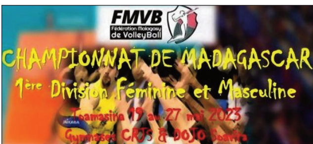
Volleyball 1DF sy 1DM any Toamasina.

Ny "Séance de Travail" no nanombohana ny hetsika volleyball fiadiana ny ho tompondakan'i Madagasikara 2023 sokajy 1DF sy 1DM omaly zoma marainina 19 mey 2023. Marihana fa ao amin'ny kianja mitafon'i Drjs Toamasina sy ao amin'ny Dojo Soavita any Toamasina no hanatanterahana ny fifaninanana rehetra ny 19 ka hatramin'ny alahady 28 mey 2023 ho avy izao. Mahatratra ekipa 10