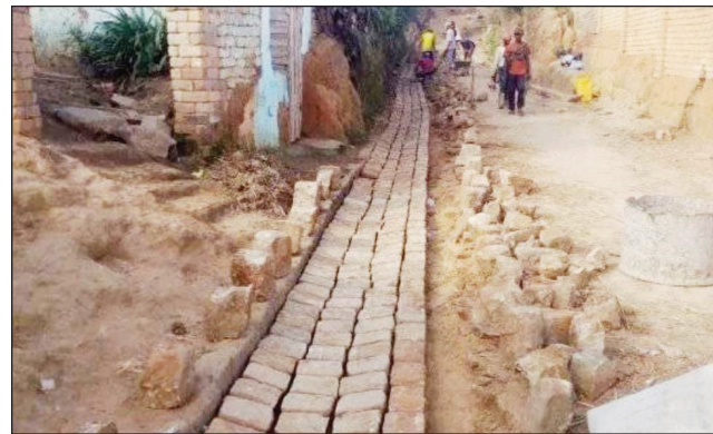
Lalankely namboarina tao amin'ny kaominina Ambohidrapeto.