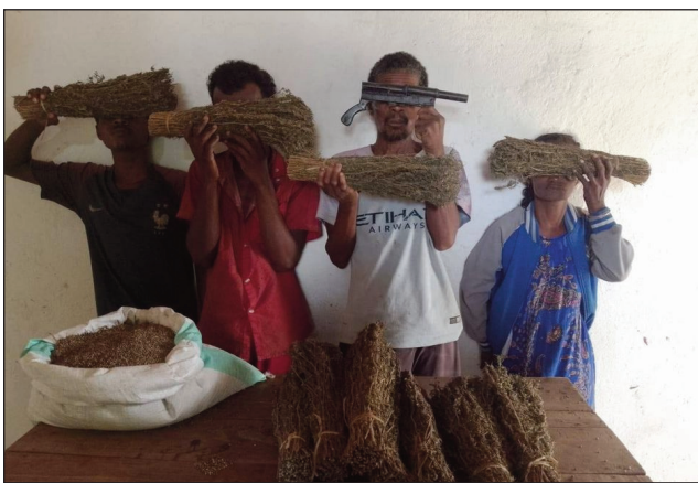
Ireo olon-dratsy, mpamboly, sy mpanaparitaka zava-mahadomelina.

Noho ny fiaraha-miasan'ny mpitandro filaminana sy ny fokolonona any amin'ny kaominina Doany any amin'ny distrikan'Andapa faritra Sava, sarona ny tanin-drongony mirefy 4 ha tany an-toerana. Olona 4 mpamboly, mpikarakara ary mpivarotra rongony no voasambotry ny Zandary tao Doany Distrikan'i Andapa. Velarantany nambolena rongony mirefy 04 ha, rongony efa voamboatra milanja 500 kg, voan-drongony milanja 20kg eo ho eo, no sarona tamin'izany ary mbola nahatratrarana ba-