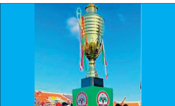
Telma Coupe de Madagascar.

Mahatratra ekipa miisa 142 manerana ny nosy no nisratra anarana fa handray anjara amin'ny fifaninanana baolina kitra "Telma Coupe de Madagascar 2023" hafantara izay anankiray ahisolotena an'i Madagasikara any amin'ny fifaninanana Afrikana fiadiana ny "Coupe de la Confédération Africaine 2023" . . Ireo avy ny isan'ireo mpandry anjara isam-paritra : Alaotra Mangoro misy ekipa (3), Androy ekipa (2), Atsinanana (6), Analanjirofo (2), Analamanga (22), Bongolava (4), Atsimo Andrefana (5), Boeny (5), Sofia (3), Itasy (4), Amoron'i Mania (3), Matsiatra Ambony (5), Diana (3), Sava (2), Ihorombe (2), Atsimo Atsinanana (2), Vatovavy (1), Menabe (1), Vakinankaratra (2), Pro League (16) izay hiditra an-tsehatra any amin'ny dingan'ny 1/16-ndalana.