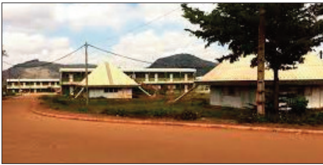
Ny sekoly ambony Polyteknika, na ESPA eny Vontovorona Antananarivo Atsimondrano.

Mankalaza ny faha-50 taona nijoroany amin'ity taona ity ny sekoly ambony Polyteknika eny Vontovorona, na ny ESPA. Ny sabotsy 3 jona izao no hanombohana ny fankalazana izany tsingerin-taona izany. Noho izay antony izay, ny mpikarakara dia manasa ny mpiasa: PERSONNEL ENSEIGNANT, PERSONNEL ADMINISTRATIF ET TECHNIQUE, mpianatra: ÉTUDIANTS, maitimolaly: ANCIENS, SPONSORS, PARTENAIRES, ... hiarahifaly mandritra ny fisakafoanana sy lanonana ombam-pifaliana, izay ho tanterahina ao amin'ny Espace Yandy By