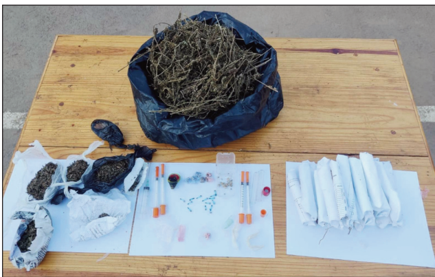
Ireo fitaovana, sy ireo zava-mahadomelina saron'ny zandary.

Tratra ny mpanapari-taka zava-mahadomelina mahery vaika: rô rô na heroine tao Ambohidratrimo distrikan' Ambohidratrimo faritra Analamanga. Nahitam-bokany ny fidinana ifotony nataon'ny zandary avy ao amin'ny kaompania Ambohidratrimo, sy ny alika mpitsongo dia an'ny Crfdc Ivato, tetsy Mahitsy ny sabotsy teo. Izany dia tafiditra anatin'ny ady amin'ny fiparitahan'ireo zava-mahadomelina mahery vaika, izay hita soritra tokoa fa manimba ireo tanora amin' izao fotoana izao dia ilay antsoina hoe "