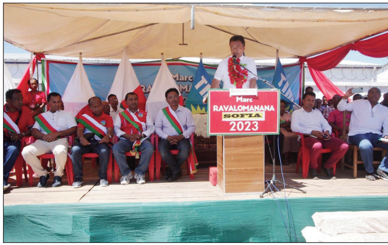
Ny antoko TIM tany Antsohihy ny sabotsy teo.

Na tany amin'ny faritra Sava, na tany amin'ny faritra Diana, na tany Sofia, fahombiazana ny dian'ny filoha Marc Ravalomanana, filohan'ny rodoben'ny mpanohitra RMDM, sady filoha nasionalin'ny antoko TIM, tany amin'ny tapany avaratr'i Madagasikara iny. Ireo toerana rehetra no-lalovany dia samy niantso an'i Dada avokoa ireo vahoaka marobe tamin'ireny toerana ireo, niantso izy ireo ny filoha Marc Ravalomanana hanavotra indray ny vahoaka sy ny firenena Malagasy, izay latsaka an-katerena tanteraka amin'izao fotoana, noho ny tsy fahaiza-mitantan'ny fitondrana Rajoelina. Ny filazana fa « champion » ity filoha ity amin'ny sehatra samy hafa ankehitriny, ataon' ny vahiny hoy ny maro nandritra izany dia karazany fanesoana ny filoha Rajoelina ihany, fa « champion » ny fanapotehana sy ny lainga, izy sy ireo mpiara-dia aminy.