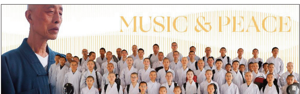
Ny « Jinghui symphonie orchestra », mihira ny fandriampahalemana sy ny fitoniana.

« Jinghui symphonie orchestra », hivondronan'ireo Sinoa moine, miisa manodidina ny 60 mianadahy. Mpitendry zavamananeno toy ny lokanga, harpe, sodina, contre basse, sns... sady mpihira ary misy mandihy ihany koa izy ireo mandrafitra ny « Jinghui symphonie orchestra », izay mivoy ny mozika nentimpaharazana Sinoa toy ny « mozika klasika bodista ». Miangaly ihany koa ireo mozika klasika nojarihan'ireo andrarezina be-neran-tany toa an'i Mozart, Beethoven, sns... ihany koa ny « Jinghui symphonique orchestra ». Ny taona 2019 no nigadona teto Madagasikara izy ireo. Ankehitriny, eny Andranovelona, Lalam-pirenana faha-efatra no misy ny monasitera itobiany. Raha tsiahivina, ny 01 mey 2022, tetsy amin'ny CCI Ivato, no nanatanteraka seho voalohany ny « Jinghui symphonie orchestra ». Fampisehoana izany niompana betsaka, ho amin'ny fangataham-pitahiana ho soa sy ho tsara eo amin'ny fifandraisan'ny firenena Sinoa sy Madagasikara ary ho amin'ny fampanjakana ny fandriampahalemana maneran-tany. Matihanina amin'ny filalaovana