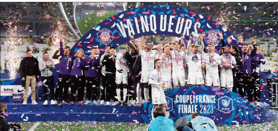
Toulouse FC, vainqueur Coupe de France 2023.