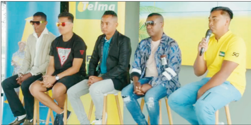
« Festival Sômarôho 2023 ».

Hiavaka dia hiavaka tanteraka ny hetsika "Festival Sômarôho", hokakarain'ny "Groupe Wawa" miaraka amin'ny fanohanana ny Telma amin'ity taona 2023, ho tontosaina any Nosy Be amin'ny 01 ka hatramin'ny 13 aogositra 2023, satria dia miditra amin'ny andiany faha-10 amin'ity taona ity, sady miaraka marihana amin'ny faha-20 taonan'ny tarika Wawa ihany koa. Anisan'ny mampiavaka azy ihany koa ny hanatanterahana ny hetsika "After Sômarôho", hisian'ny hetsika ara-panatanjahantena sy hetsika fitsidihana manokana ny hakanton'ny tanànan'i Nosy Be, ankoatra ny fanatanterahana an'ireo hetsika efa nahazatra hatramin'izay andiany 9 notanterahina izay. Mbola hampiavaka an'ity hetsika 2023 ity ihany koa, ny hanoloran'ny "Groupe Wawa" sy ny orinasa Telma loka maro