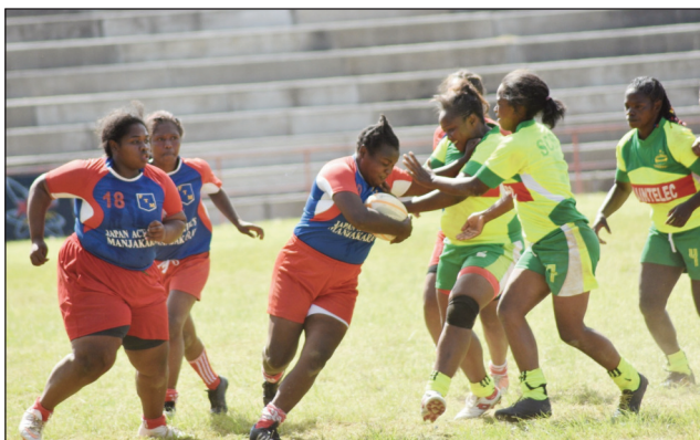
Lalao rugby vehivavy tamin'ny sabotsy.