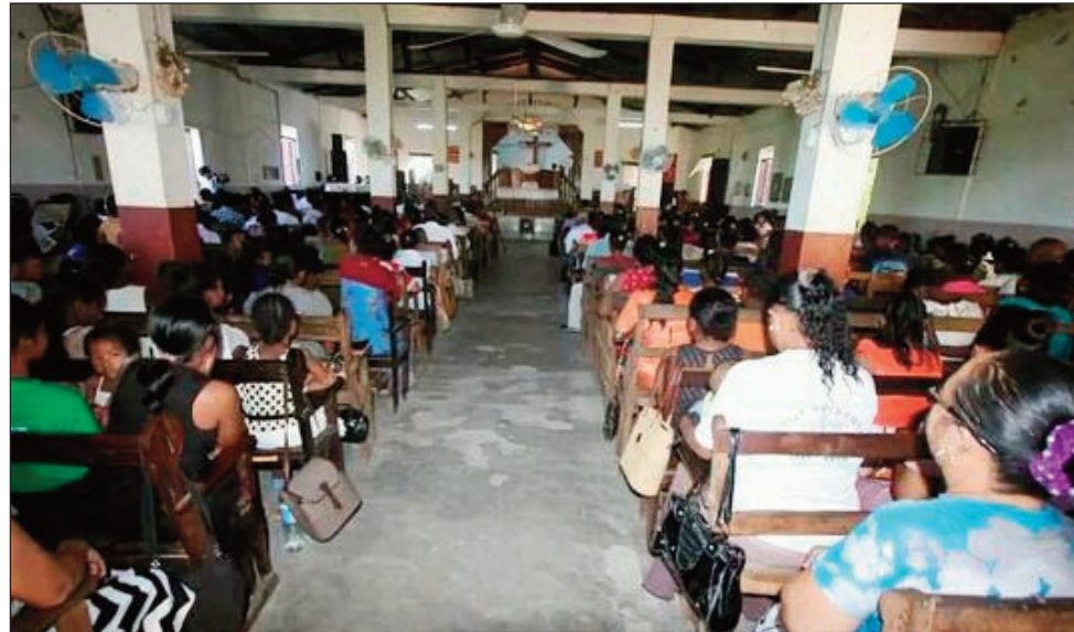
Akon'ny fitsidihan'ny filoha Marc Ravalomanana ny tany Antsohihy faritra Sofia ny faran'ny herinandro teo, sy akon'ny kongresim-paritry ny antoko TIM tany an-toerana.