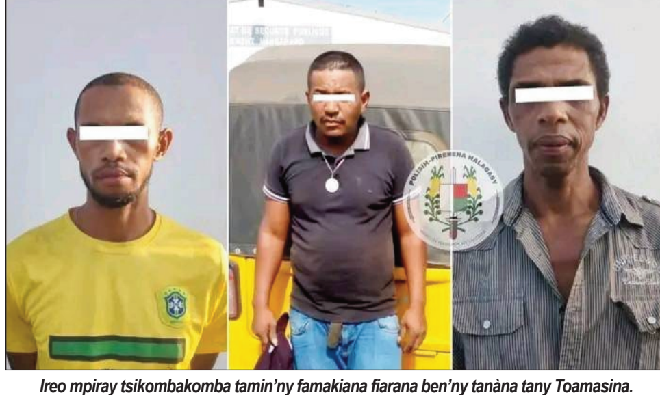
Ireo mpiray tsikombakomba tamin'ny famakiana fiarana ben'ny tanàna tany Toamasina.

Zava-nitranga afak'omaly tany Toamasina: fiara nentin'ny ben'ny tanànan'i Sambava faritra Sava ni-petraka amoron-dalana, no nisy namaky ny fitaratra aoriana. Very tamin'izany ny vola 1000 000 Ar sy vola 100 euros ary ireo antontan-taratasy maro samihafa nipetraka tao anaty fiara . Rehefa azony izay nalainy dia nandositra tamin'ny tuc tuc ilay lehilahy . Tsy nian-dry ela ny Polisy nitady ilay tuc tuc. Traatra ilay lehilahy ary rehefa natao ny