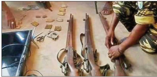
Ireo basy sy bala sarona.