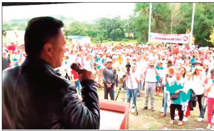
Ny filoha Marc Ravalomanana.