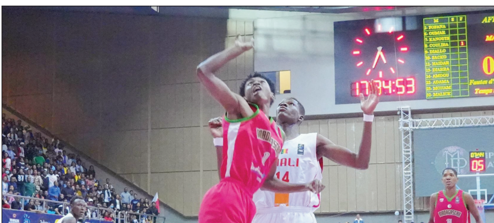
Fihaonana basikety N1A lehilahy Malagasy.

Nampahatsiahy an'ireo mpilalao basikety Malagasy naniry ny hifindra klioba, mialohan'ny fanombohan'ny fifaninana nasionaly N1A lahy sy vavy 2023 hatao any Antsirabe ny FMBB « Federation Malagasy de Basket Ball », fa nifarana omaly alarobia 5 aprily 2023 ny fanatanterahana an'izany FIFINDRANA KLIOBA izany, ho an'ireo mpilalao rehetra tsy ankanavaka anatin'ireo sokajy ireo araka ny voafaritry ny lalàna nohavozina tamin'ny taona 2017 « aliéna 3 », izay manam-