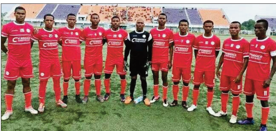
Ny ekipan'ny Cosfa Football 2023.

Ny Cosfa Football ao amin'ny vondrona "Conférence Nord" manana isa 23, no ekipa faharoa tafita hiatrika ny dingana "Playoffs", amin'ny fifaninana baolina kitra "Orange Pro-League 2022-2023". Amin'ny alahady ho avy izao dia hikatroka amin'ny ekipan'ny Tffc Mahajanga etsy amin'ny kianja syntetika Mahitsy ity ekipan'ny Miaramila ity amin'ny andro faha-13. Fandaharan-dalao andro faha-13 samy hanomboka amin'ny 2 ora 30 avokoa. Vondrona "Conférence Nord" sabotsy 08 aprily 2023 : Cosfa # Tffc (kianja sentetika Mahitsy), Alahady 09 aprily 2023 : Uscafoot # Ajesaia (kianja monisipaly Alarobia), Asa Diana # Fosa Junior Fc (kianja