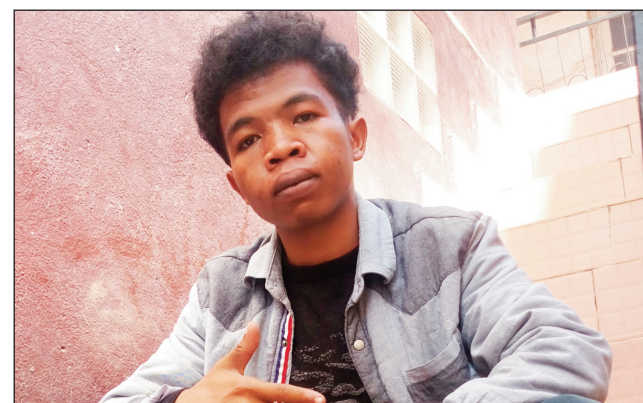
I Guste, 08 taona niangaliana ny Rap gasy.