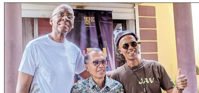
Mpikarakara sy mpandray anjara, amin'ny Nosy Boraha Jazz Festival.