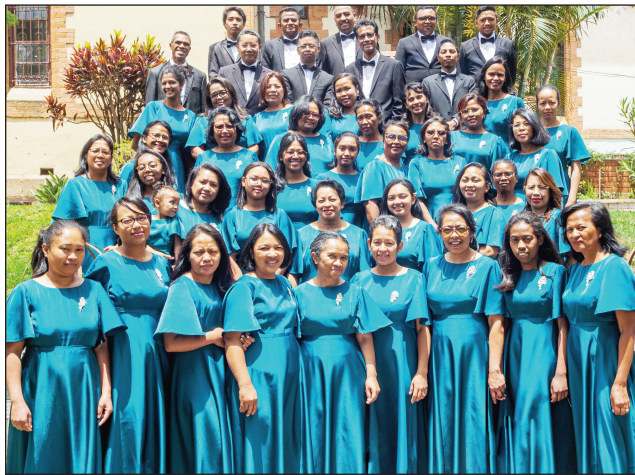
Ny Chorale Orimbato ao amin'ny FJKM Tranovato Ambatonakanga.