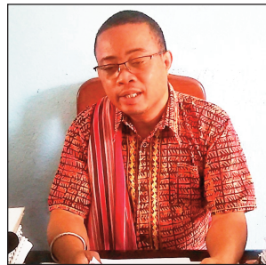
Ny filohan'ny ANTM.