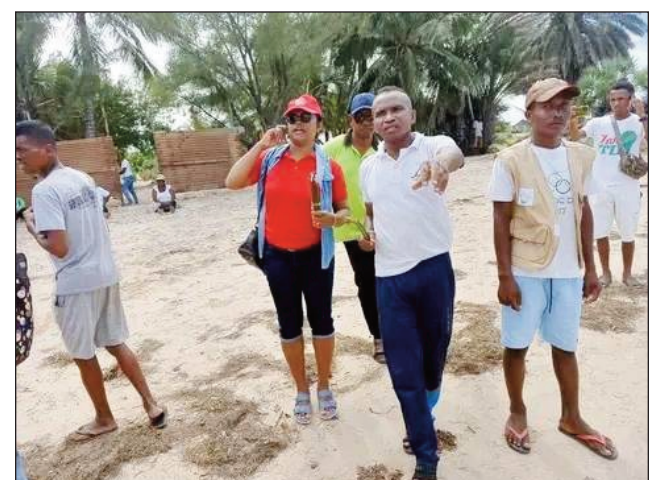
Ireo mpitarika ny fambolena ala honko tany Saint-Augustin.