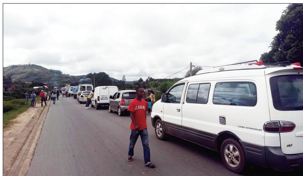
Na nisy aza ny fanakanana, nandeha an-tongotra ny filoha Marc Ravalomanana nihazo an'i Sambaina sy Manjakandriana.