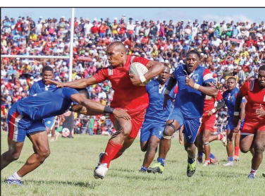
Fihaonana ny Ftm sy Cosfa Rugby tamin'ny lasa.

Nampiseho ny heriny indray ny fileovana Cosfa rugby sy Ftm Manjarkaray, tamin'ny alahady 02 aprily 2023 teny amin'ny kianja Makis Andohatapanaka, tamin'ny fiatrehana ny andro faha-3 amin'ny fifaninananana « Rugby XXL Top 20, 2023 » andro faha-3, fa samy nanamontsana tamin'ny elanelan'isa navesatra dia navesatra ny fileovana Mang'Art Manjarkaray sy ny Usa Ankadifotsy. Voka-dalao andro faha-3 : Scb (27) – (37) Uasc Rugby, Cosfa Rugby (69) - (18) Mang'Art, Uscar (34) – (28) Ftat, Ftm (75) – (19) Usa.