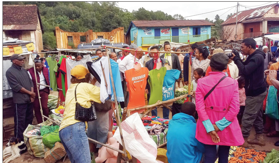
Nosakanan'ny mpitandro filaminana indray ny filoha Marc Ravalomanana sy ny mpiara-dia aminy, raha nihazo an'i Manjakandriana omaly io.