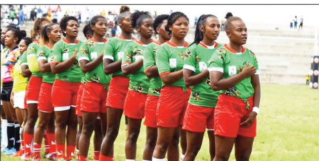
Makis à 7 vehivavy.