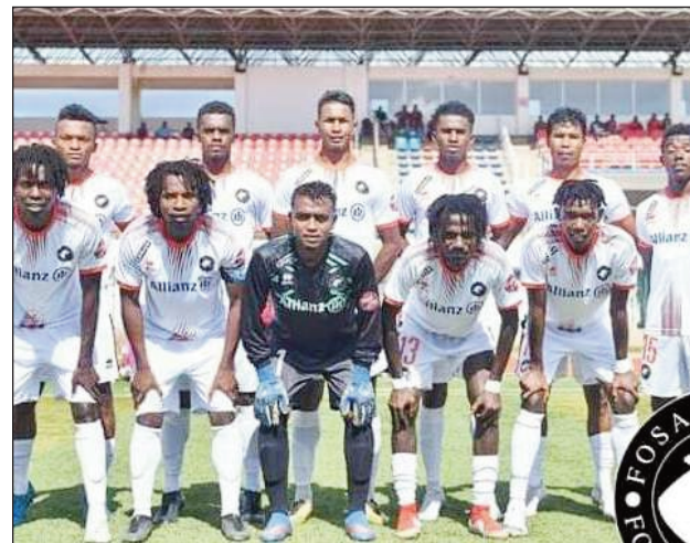
Ekipan'ny Fosa Juniors Fc Boeny.