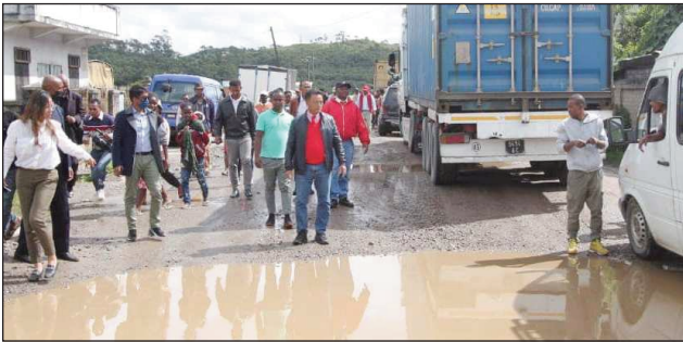
Ny filoha Marc Ravalomanana nandeha an-tongotra, fa voasakana ny fiarakodia nitondra azy sy ireo mpiara-dia aminy.