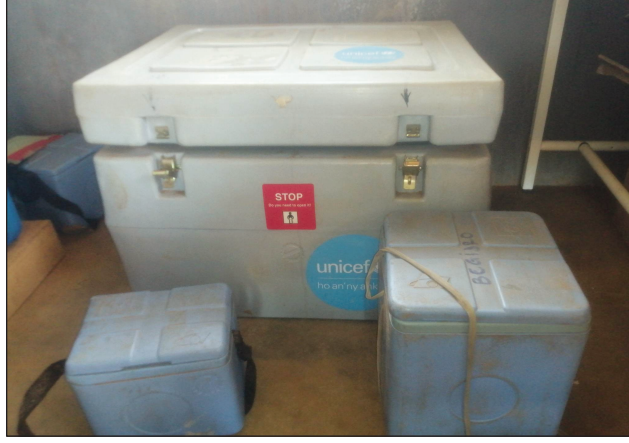
Appareils pour porter et conserver les vaccins.

Pour la vaccination, il est un peu difficile d'approvisionner le CSB2 de Begidro car ceci part de la DPEV (Direction du Programme Elargi de Vaccination) à Antananarivo et arrive au chef-lieu de district à Belo/Tsiribihina. Là, il faut compter deux jours pour l'obtenir par voie fluviale, mais ça dépend de la stabilité sur la rivière Tsiribihy et de la sécurité dans la localité aussi. Donc au lieu de tous les deux mois, l'approvisionnement de vaccins dans les CSB2 se fait tous les mois en augmentant le stock pour éviter une rupture de vaccin soudainement, en raison des problèmes mentionnés précédemment. Quant au stockage du vaccin, il est totalement sécurisé car il existe des appareils de l'UNICEF qui vont stocker et conserver le vaccin avec un réfrigérateur solaire, et il y a aussi un port de vaccin qui respecte la chaîne du froid, donc des vaccins endommagés ne sont pas à craindre. En ce