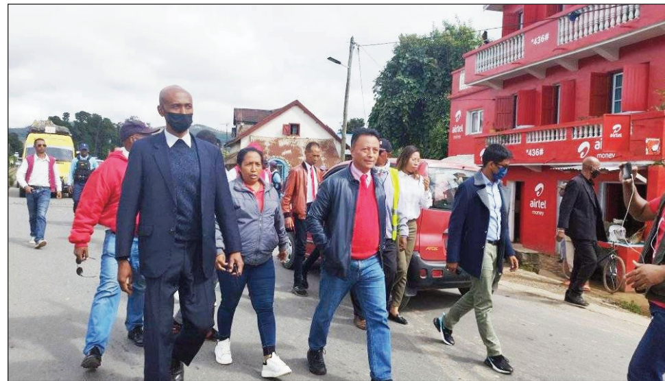
Tafahoana tamin'ny mponin'i Manjakandriana tao Sambaina ihany, ny filoha Marc Ravalomanana sy ny mpiara-dia aminy.