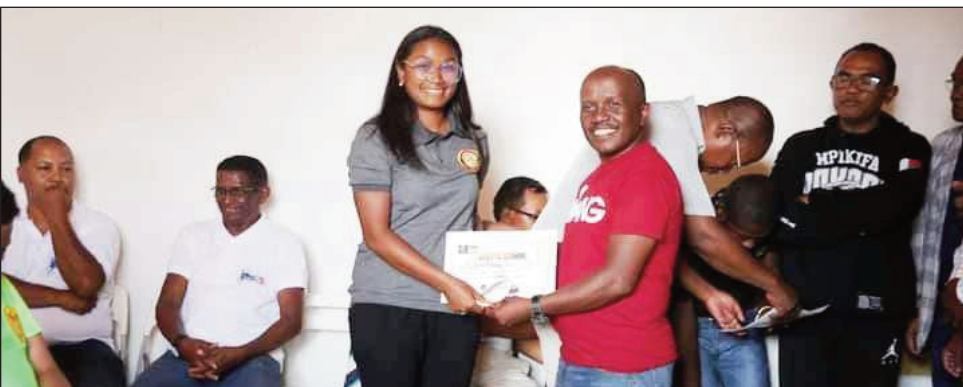
Famohana mpitsara basikety "TARATRA 2023" teny amin'ny ANS Ampefiloha.