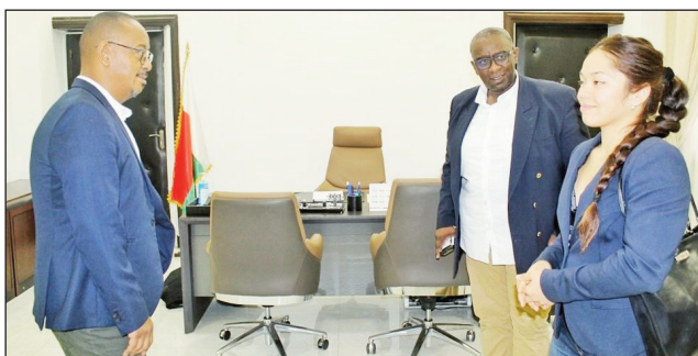
Filohan'ny FMJ niaraka tamin'i Laura tetsy Andohan'Analakely.

Nampahafantarina ny filohan'ny FMJ "Federation Malagasy de Judo", tamin'ny firesadresahany tamin'ny minisitry ny tanora sy fanatanjahantena Malagasy tamin'ny sabotsy 01 aprily teo teny amin'ny biraon'ity farany eny Andohan'Analakely, fa lalao iraisam-pirenena miisa 3 be izao no hatrehana ny Judokas Malagasy ato ho ato dia ao ny fiadiana ny ho tompondakan'i Afrika sokajy "Cadet sy Junior", izay hatao amin'ny volana jolay ho avy izao, sy ny "Open Africa" sokajy Ju-