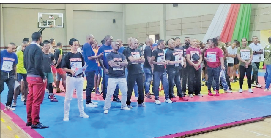
Fiofanana mpanazatra sy mpitsara tolona.

Mpanazatra sy mpitsara lalao tolona Malagasy niisa 26 no niatrika fiofanana niaraka tamin'ireo manam-pahaizana vahiny telo mirahalany tetsy nandritra ny 5 andro maninjitra. Notanterahina tamin'ny talta 25 aprily 2023 lasa teo, tetsy amin'ny Lapan'ny Fanatanjahantena Mahamasina, ny fotoam-pizarana ny taratasisim-pamarinana ho an'ireto mpanazatra sy mpitsara lalao ireto. Tonga nanontrona izany ireo Tale isan-tsokajiny eto anivon'ny Minisitery izay nisolontena an'Atoa Minisitry tompon'andraikitra.