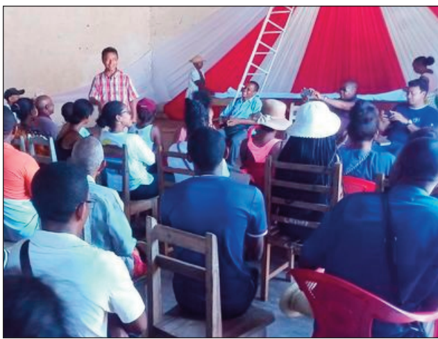
Ny fanomanana ny kongresim-paritry ny antoko TIM any Antsohihy.

Tena talanjona avokoa ireo nolalovan'ny filoha Marc Ravalomanana filoha nasionalin'ny antoko TIM, sady filohan'ny rodoben'ny mpanohitra RMDM, raha nahita azy akaiky, tamin'ny fandalovany tany amin'ny faritra Sava, Diana ary any amin'ny faritra Sofia izy amin'izao fotoana. Saika tsy nino avokoa ireo nahita ny tanjany, sy tena mbola mampijaridina an'i Dada. Tao aorian'ny tany Ambanja faritra Diana, hiatrika ny kongresim-paritry ny antoko TIM any amin'ny faritra Sofia izy anio, kongresy handraisan'ireo solontenan'ny antoko TIM, avy amin'ireo distrika mandrafitra ny faritra Sofia. Omaly tolakandro, nivory niaraka tamin'ireo tomponandraikitra ny TIM ao an-drenivohitry ny faritra Sofia izy, mahakasika ny fanatontosana ny kongresimparitry ny antoko TIM faritra Sofia hatao anio sabotsy hanomboka amin'ny 10 ora maraina. Fa ho famintinana ny diany tany Sava sy Diana, nanambara ny filoha Marc Ravalomanana fa: "nahafoy fotoana ianareo teto Ambanja anio nifanakalo hevitra tamiko. Aza avela ho raraka an-tany izao herim-ponareo izao. Fotoana hanovantsika ny tantara izao amin'ny alalan'ny fifidianana. Koa andeha ary hifampitaona amin'ny havana aman-tsakaiza ho any amin'ny Fokontany hisoratra anarana anaty lisi-pifidianana, ary hanamarina izany avy eo. Tsy mahalavi-tany ny fanarenana an'i Madagasikara. Nandalo teto Ambilobe aho rehefa avy nitety ny faritra SAVA. Tsy nisalasala isika ny nifampihaino sy nifanakalo hevitra. Manantena anareo aho fa samy ha-