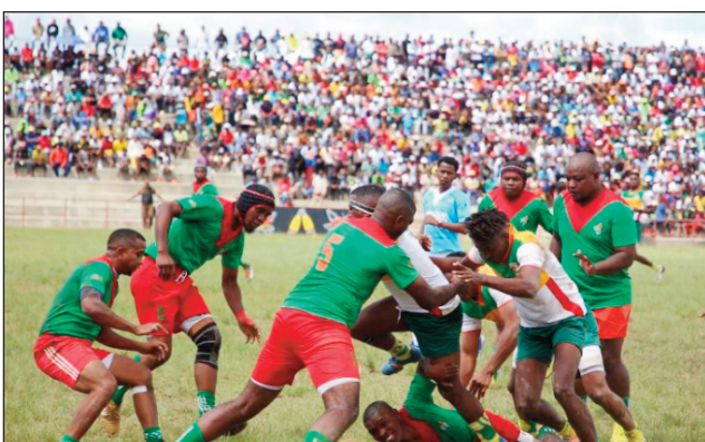
Rugby XXL Top 20, 2023.

Mitohy ny fifaninana rugby « Championnat de Madagascar 2023 D-2 sy D-1 vehivavy » ary ny « Championnat de Madagascar Elite Federale XXL Top 20 2023 » izay tontosaina eny amin'ny kianja Makis Andohatapanaka avokoa amin'ity faran'ny herinandro ity. Fandaharan-dalao « Championnat de Madagascar 2023 Féminine » D-1 sy D-2 Asabotsy 29 aprily 2023 (Tsy misy vidim-pidirana) : Sokajy D-2- 09:00 : Fanja Anjanahary # Rosa Antohamadinika, 11:00-Sab-