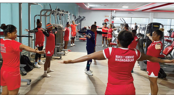
Fikotranan'ny Ladies Makis 7s any Afrika Atsimo.

Nanomboka omaly zoma 28 aprily ka hifarana rahampitsy alahady alahady 30 aprily 2023 ny dingana faharoa amin'ny fifaninanana rugby « 2è Manche du tournoi 7s Challenger Series » hotontosaina any amin'ny kianja "Markotter Stadium, Stellenbosch SOUTH AFRICA" ka ao amin'ny vondrona D no misy ny Ladies Makis 7s Malagasy. Fizaram-bondrona Pool A : Tonga, Italy, Chile, Jamaïca, Pool B : Germany, Uganda, Brazil, South Korea, Pool C : Hong Kong-China, Belgium, Zimbabwe, Papua New Guinea, Pool D : South Africa, Thailand, Magascar, Paraguay, Pool E : Begium, Czechia, Colombie, Papua New Guinea, Pool F : China, Poland, Hong Kong-China, Mexico.