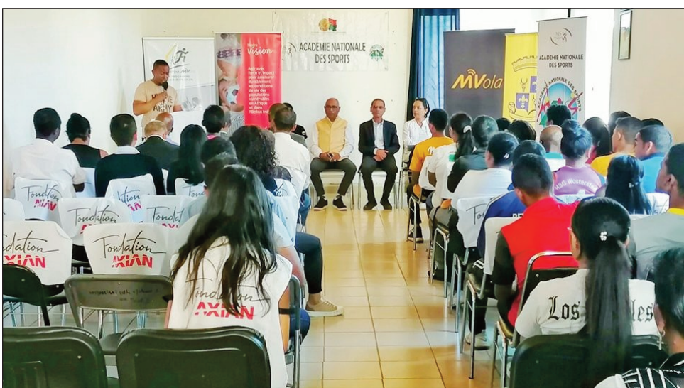
Fampiofanana teny amin'ny ANS Ampefiloha.

Mpanabe samihafa niisa 37 avy amin'ny boriborintany 6 mandrafitra ny kaominin'Antananarivo renivohitra izay ahitana toerana maromaro toy izao : •Cisco Tana Ville naome Mpanabe ambaratonga voalohany, •Ny Akany ao amin'ny CUA, •Ny association Tana, •Ny association Grandir dignement, •Association Un Enfant c'est l'Avenir, •Association Un Enfant par la main, •Académie Nationale des Sports no niatrika fiofanana ho Mpanenta fanetseham-batana nanomboka tamin'ny alatsinainy 17 aprily ka hatramin'ny alakamisy 20 aprily 2023 lasa teo. Notontosaina tao amin'ny ANS Ampefiloha tamin'ny talata 25 aprily 2023 lasa teo ny fotoamparanana ny fampiofanana azy ireo tetsy