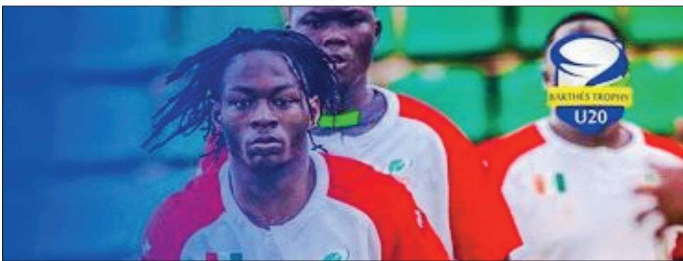
Makis U20, 2023.