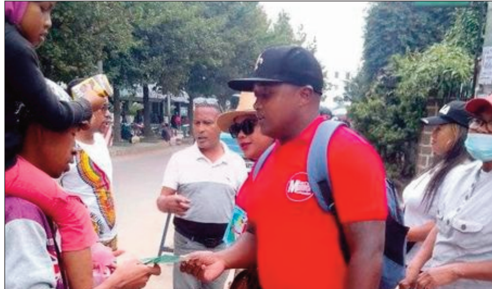
Ny fandalovan'ny filoha Marc Ravalomanana tany Befotaka amin'ny RN6 iny.