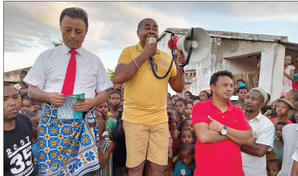
Ny filoha Marc Ravalomanana nivory niaraka tamin'ny TIM Antsohihy, ho fanomanana ny kongresim-paritry ny antoko any amin'ny faritra Sofia anio.