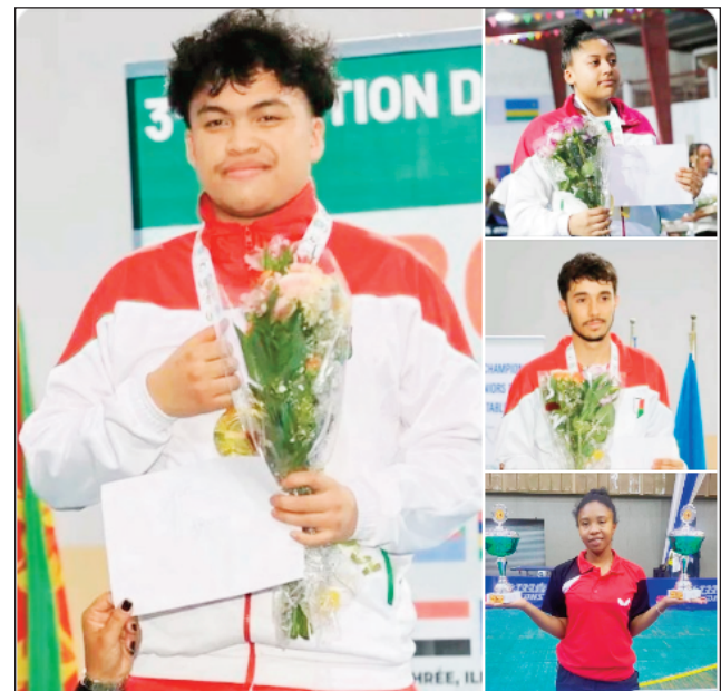
Mpilalao Tenisy ambony latabatra Malagasy.