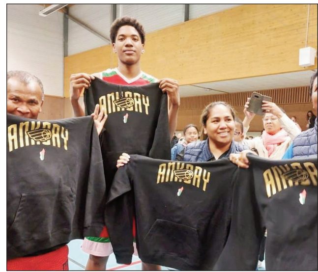
Fanolorana fanamiana mafana ny Ankoay U19.