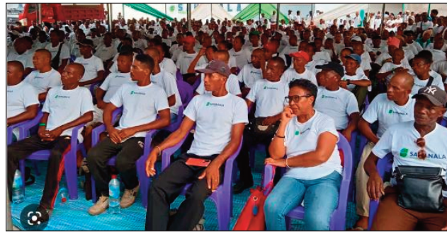
Ny fivoriamben'ny orinasa sosialy Sahanala Vanille tany Ambanja.