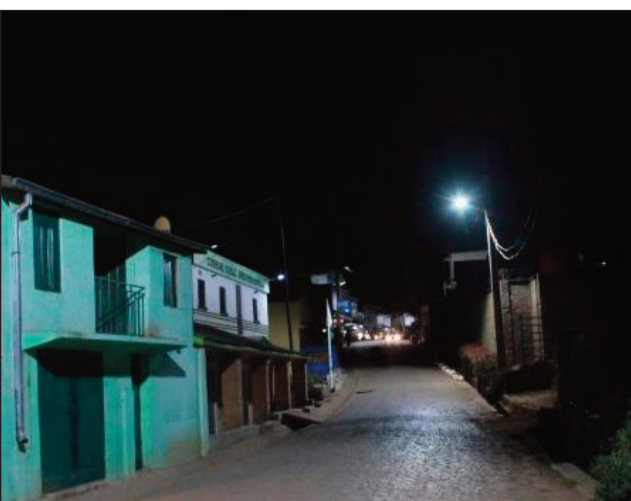
Ambohimambola amin'ny alina.

Noho ny tsy fandriampahalemana mahazo vahana amin'izao fotoana ao amin'ny distrikan'Antananarivo Avaradrano, indrindra ny ao amin'ny kaominina Alasora, sy ao amin'ny kaominina Ambohimambola, nanao fanambarana ny ao amin'ny fiadidiana ny tanànan'Ambohimambola fa nanomboka omaly, misy ny tsy fahazoana mivezivezy amin'ny alina, na « couvre feu » ao amin'ity kaominina ity. Tsy azo atao ny mivezivezy ao anatin'ny kaominina Ambohimambola manomboka amin'ny 9 ora alina, ka hatramin'ny 3 ora maraina. Ireo izay tsy maintsy mivoaka amin'ny alina noho ny antony manokana dia tsy maintsy mitondra karanonondro avokoa. Raha mpiasa tsy maintsy miasa amin'ny alina dia tsy maintsy mitondra ny karatra maha-mpiasa azy ao amin'ny orinasa izay iasany. Ny Bar sy ny Karaoke dia mihidy amin'ny 9 ora alina avokoa ary ny lanonana rehetra ihany koa dia foana tsy azo atao. Manan-kery mandritra ny fotoana tsy voafetra izany didy izany.