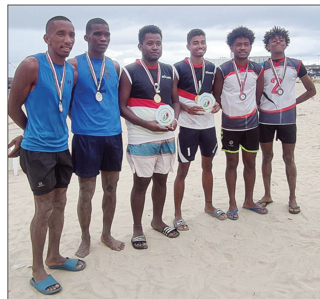
Equipes Championnes 2023.