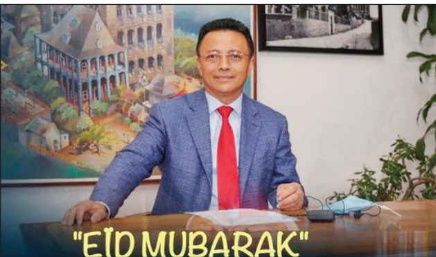
Ny filoha Marc Ravalomanana.