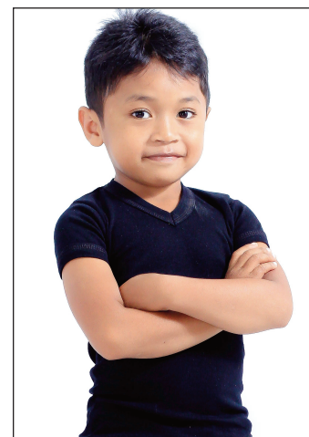
Christian K, misakaiza akaiky amin'ny mozika sy ny hira.