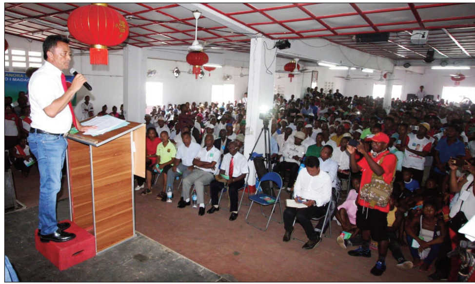
Feno ihany koa ny trano, nandritra ny fihaonan'ny filoha Marc Ravalomanana tamin'ny tany Antalaha, na tampotampoka aza no nahatongavany tany.