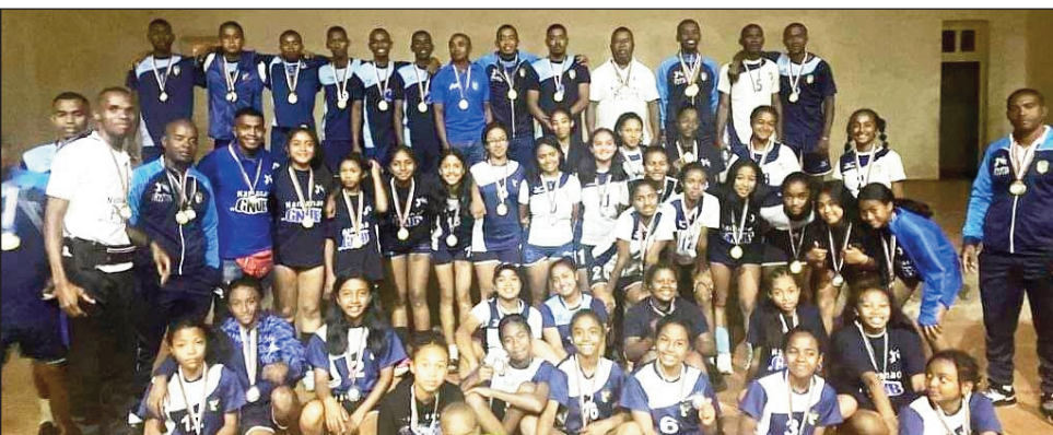
Mpilalao Volley-ball Jeunes sy 2D lahy sy vavy tany Antsirabe