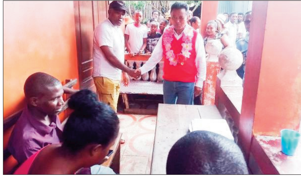
Feno hipoka ny tao anatin'ny sy ny tany ivelany, tamin'ny fihaonan'ny filoha Marc Ravalomanana tamin'ny vahoakan'i Sambava, tao amin'ny Cercle Chinois tany an-toerana.