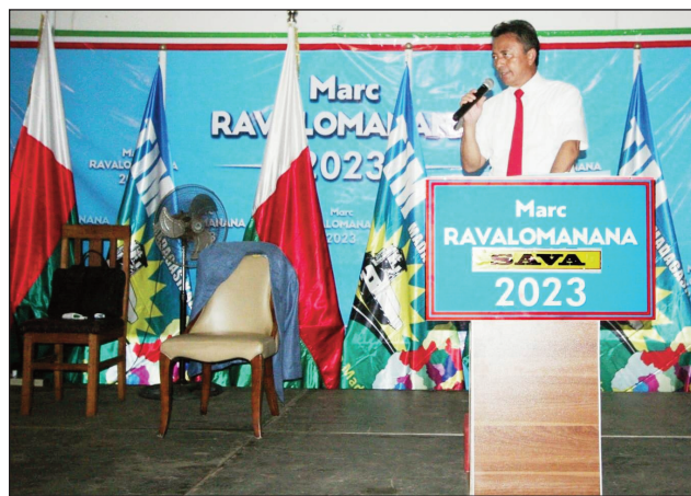
Ny filoha Marc Ravalomanana, mitsidika ny any Sava.

nankery intsony ny lisi-pifidianana teo aloha rehetra. Afaka jerena ny rohim-pifandraisan'ny Ceni mifandraika amin'ny faritra, distrika, kaominina, fokontany misy anao. Fa nasiany resaka koa ny mahakasika ny olan'ny lavanila amin'izao fotoana, tokony ho laharam-pahamehana ny fijerena ny olan'ny tantsaha, fa tsy ny an'ny mpandraharaha mpanangona sy mpanondrana ity vokatry fanondrana ity ihany, hoy izy. Tao Antalaha, vao nahita ny filoha Marc Ravalomanana dia tonga marobe ny olona na dia tampoka aza ny fahatongavany. Tsy mba nisy fizarana zavatra na artista, fa ny anay hoy ireo mpikatroka dia Dada ihany, izy no mahita ny vahaolana ho an'ny zanany dia ny Malagasy iray manontolo tsy misy resaka firazanana fa iray ihany.