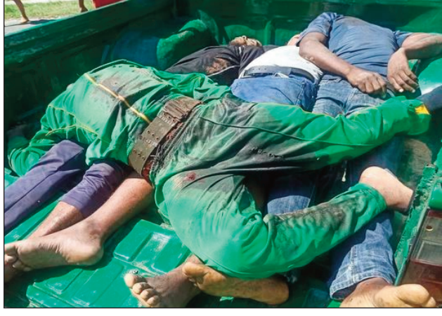
Ireo jiolahy miisa 4, lavon'ny mpitandro filaminana tany Toamasina.