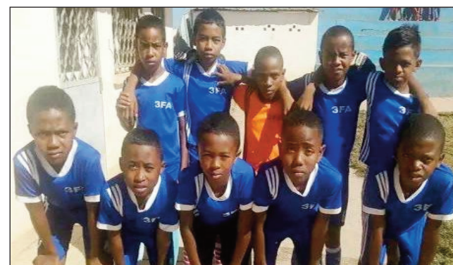
Ekipa mpandray anjara eny Ankadikely.