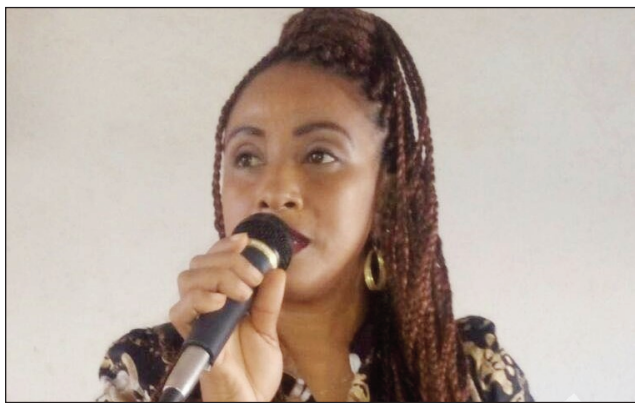
Ny filohan'ny CED any Befandriana Avaratra.

Tany amin'ny distrikan'i Befandriana Avaratra faritra Sofia, no nahitana fisoratana anarana be indrindra, tamin'ny lisi-pifidianana navoakan'ny CENI: vaomieram-pirenena mahaleotena misahana ny fifidianana afak'omaly, namarana vonjy maika izany lisitry ny mpifidy izany. Na izany aza, mbola mitohy hatramin'ny 31 mey izay fisoratana anarana amin'ny lisi-pifidianana izay eny anivon'ny fokontany manerana ny Nosy. Nahazo salan'isa 98% ary mitazona ny laharana voalohany amin'ireo distrika 119 manerana an'i Madagasikara ny distrikan'i Befandriana-Avaratra tamin'ny fanatratrarana ny tanjona izay