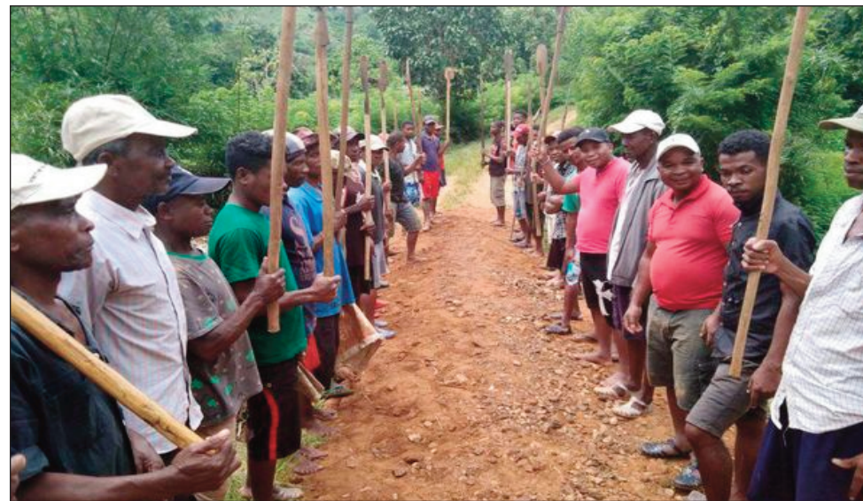
Niara-nisakafo tamin'ny lambanan-dravina ny rehetra tao aorian'ny asa tanamaro fanaovan-dalana.