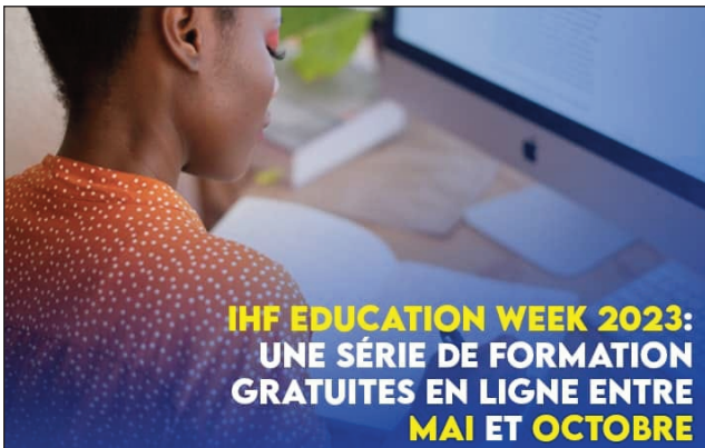
Handball «Education Weeks 2023».

Ho tanterahina amin'ny volana mey sy oktobra 2023 ho avy izao ny herinandro fampiofanana handball «Education Weeks», natokana hoan'ireo mpanazatra sy mpilalao ary ireo liana amin'ny taranja hand-ball maneran-tany, ka ny "Fédération Internationale de Handball" (IHF) no hikarakara an'izany. Toy izao ireo fandaharam-potoana harahina amin'izany : 1) Beach Handball Education Week (webinaires sur différents sujets liés au beach handball): 15 – 21 mai 2023 2) Coaches and Referees