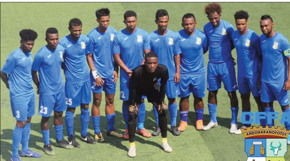
Ny Cffa Andoharanofotsy 2023.