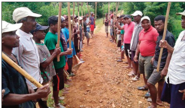
Asa tanamaro, fanaovan-dalana nataon' ny antoko TIM, tany Vavatenina.

Nisy asa tanamaro nataon'ny antoko TIM: Tiako i Madagasikara, tany Antanamarina distrikan'i Vavatenina faritra Analanjifrofo, tamin'ity herinandro ity. Nisy arak'izany ny fanamboarana ny lalana tany an-toerana izay nataon'izy ireo, izany ihany koa dia ahatsiarovan'izy ireo ny filoha Marc Ravalomanana, izay manana fanamby: "amboary ny lalana eto Madagasikara", nahavitany lalana hatramin'ny 9000 km tamin'ny fotoana nitondrany. Izao asa tanamaro izao no