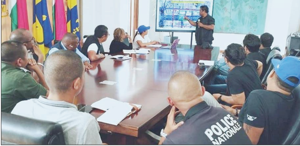
Ny Tarika Ambondrona sy ireo mpitandro filaminana.

Azo lazaina ho mbola hitohy amin'ny alahady ho avy izao ny fety eto Antananarivo Renivohitra. Hanatanteraka hetsika goavana ankalamanjana, etsy amin'ny Araben'ny Fahaleovantena Analakely ny Tarika Ambondrona amin'io andro io. Noho izay antony izay, sy noho ny maha tena goavana ny hetsika, niara-nidinika ny momba ny ho fandaminana izany, tamin'ireo tompon'andraikitra isantsokajiny misahana ny resaka filaminana sy fandriampahalemana ny tarika Ambondrona omaly. Voaresaka nandritra izany ny momba ny fiarovana ny olona, fiarovana ny fitaovana, fiarovana ny toerana sy ny zava-misy eo aminy. Ny fampiasana ny