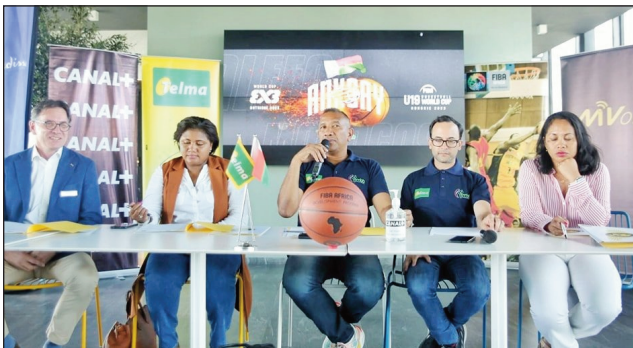
Valandresaka ho an'ny mpanao gazety teny Andraharo.

Nanomboka tamin'ny alatsinainy 10 aprily 2023 teo, ny fampivondronana (fiofanana ara-teknika, fanazaran-tena miampy lalao fitsapana maro), hataon'ireo mpilalao basikety Ankoay U19 Malagasy, any amin'ny "centre sportif d'Elan-Chalon France", ho fanomanana ny handraisan'izy ireo anjara amin'ny fiadiana ny amboara erantany taranja Basket-ball U9 izay hatao amin'ny 24 jona, ka hatramin'ny 2 jolay 2023 ho avy izao any Debrecen HONGRIE. Tamin'ny valandresaka ho an'ny mpanao gazety nataon'ny FMBB sy ny Telma teny amin'ny "Campus Telma Andraharo" ta-